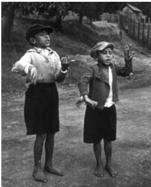
Antonín Kubišta, Rození primáši, publikováno v časopisu Fotografický obzor, ročník 1936