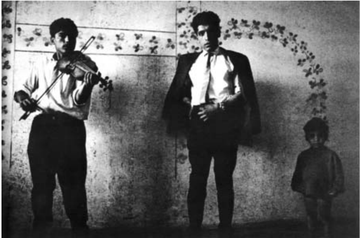
Josef Koudelka, Kendice 1965