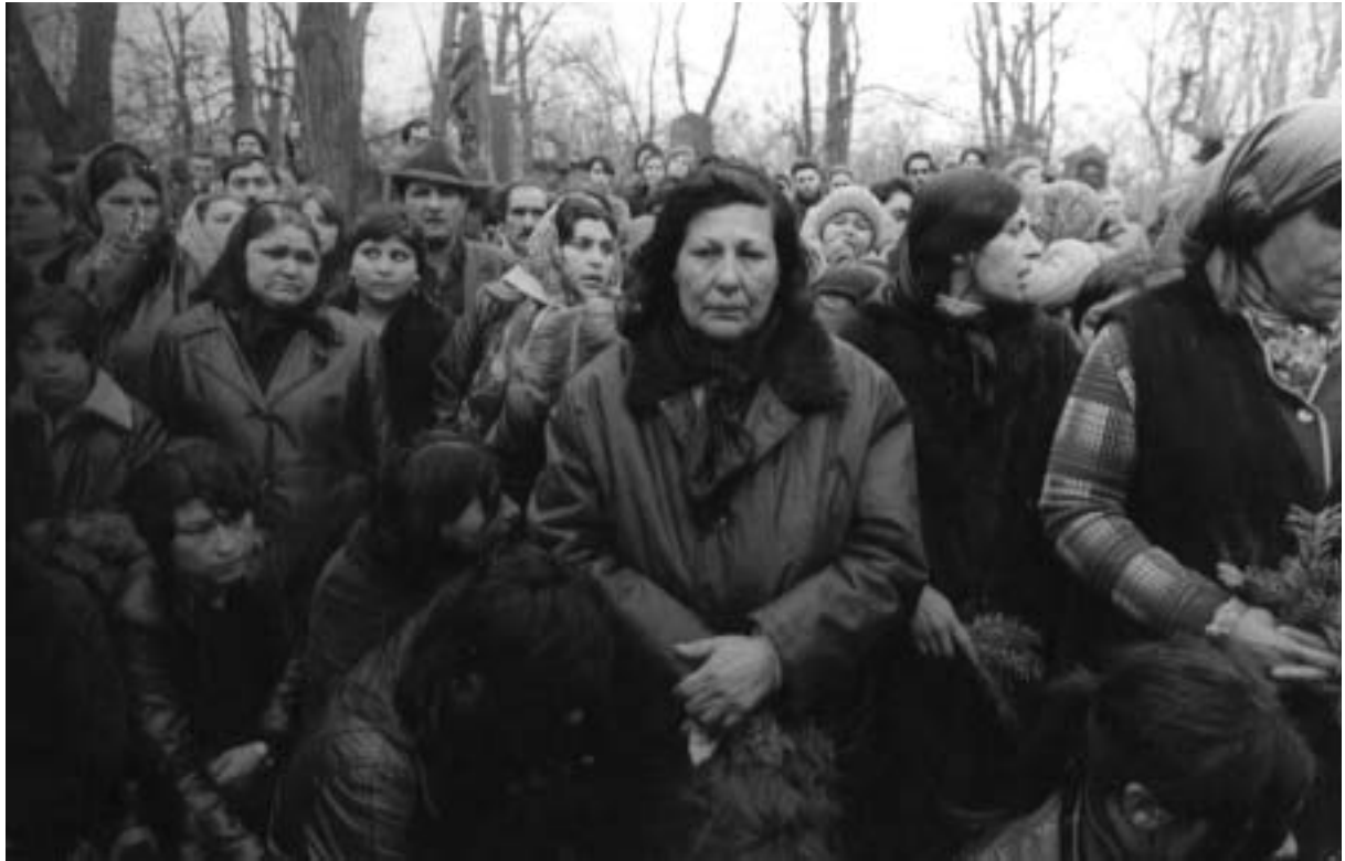
Karel Cudlín, Pohřeb, 1982