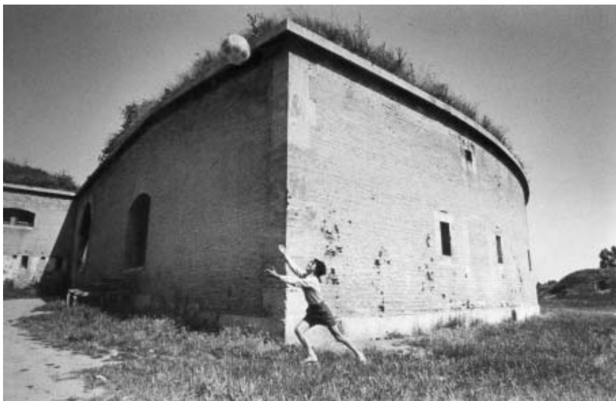
Fedor Gabčan, z cyklu Lidé z pevnosti, 1970 – 72