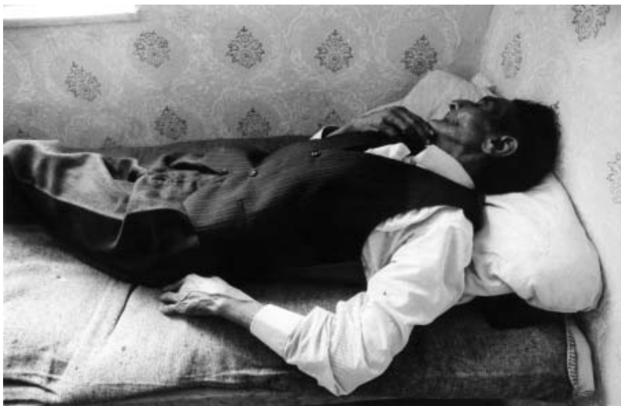
Robert Portel, z cyklu Osada, 1985 – 91

různými předměty a vtiskuje tak těmto dávno zapomenutým snímkům zcela nový rozměr – jednou rozsvítí světla u traktoru, jindy vlkovi domaluje zářící oko. Jakoby fotografie pod jeho rukama znovu ožívaly.