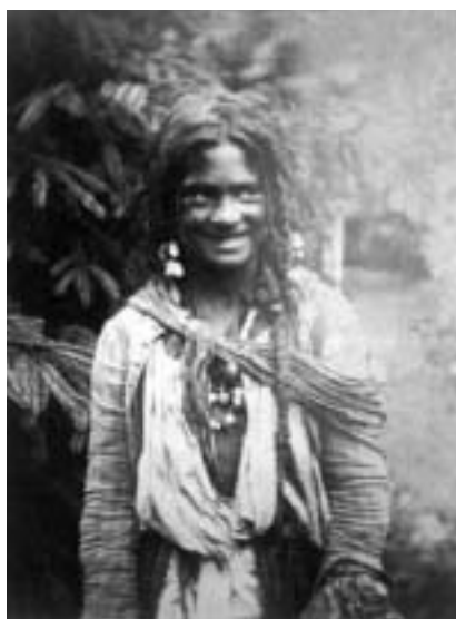
Ant. Stifter, Romská dívka , kolem 1895

Nejstarší fotografie, kterou se mi na dané téma podařilo vyhledat, se nazývá Romská dívka . Autorem snímku je Antonín Stifter (1855 – 1910) a její vznik se datuje kolem roku 1895. Antonín Stifter byl nepochybně jedním z nejvýznamnějších fotoamatérů první generace organizovaného amatérského hnutí u nás. Zasáhl do všech podstatných témat soudobé fotografie. Tato fotografie je otištěna v knize Pavla Scheuflera „Galerie c.k. fotografů“. V této knize nalezneme i snímek Romské matky s dětmi . Jde o kolorovaný diapozitiv z doby před rokem 1914 od Karla Dvořáka, snad nejvlivnější osobnosti české amatérské fotografie před první světovou válkou.