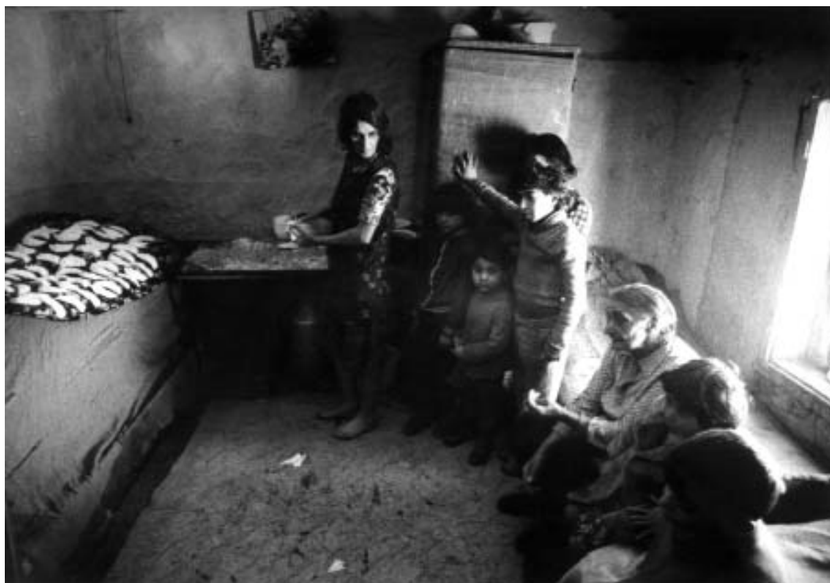
Robert Portel, z cyklu Osada , 1985 – 91

Více než jeho cikánské fotografie jsou známější jeho asambláže sestavované z reprodukcí fotografií starých novin a časopisů, které tvůrčím způsobem doplňuje