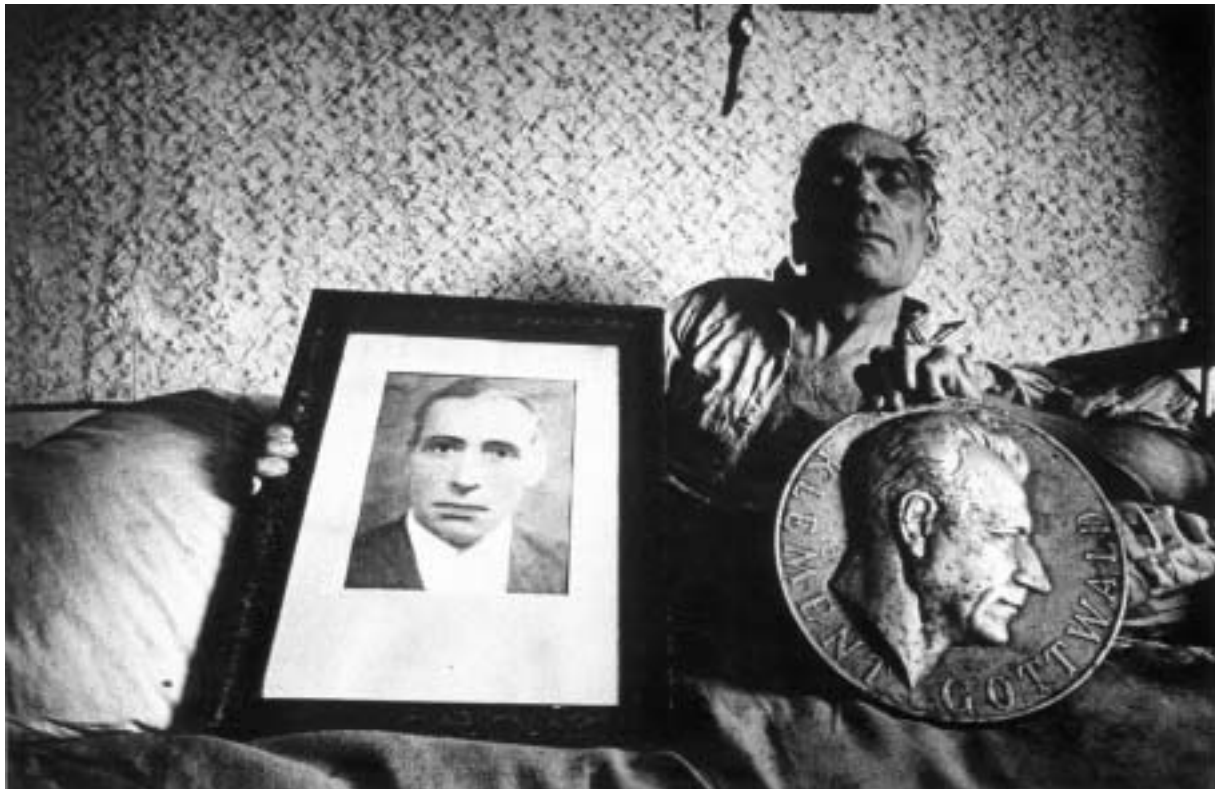
Josef Koudelka, Rakusy 1964