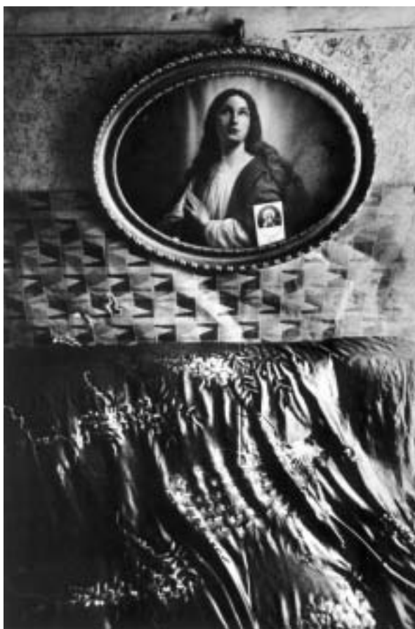
Josef Koudelka, Jihlava 1967