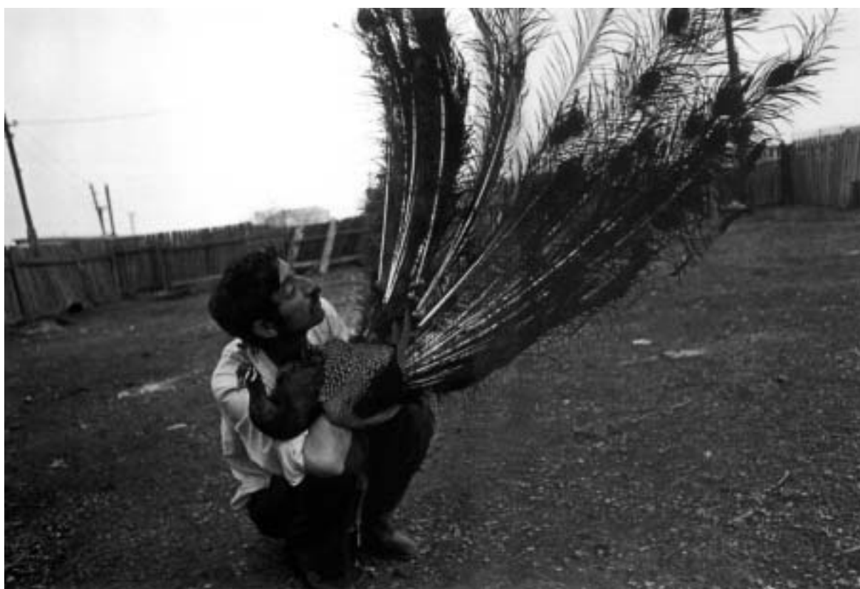
Ljalja Kuznětsovová, z cyklu V dalekých stepích, 70. léta