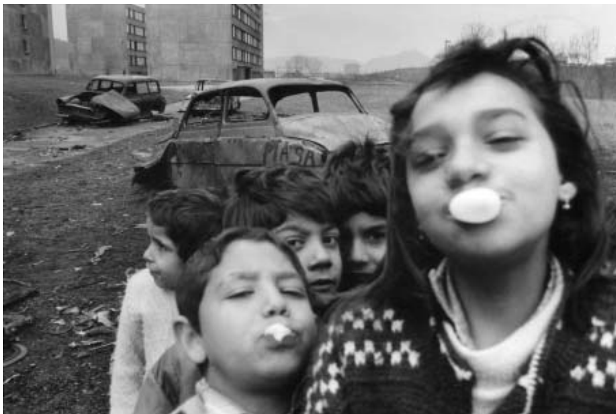
Ibra Ibrahimovič, z cyklu Střepy severních Čech , 1992