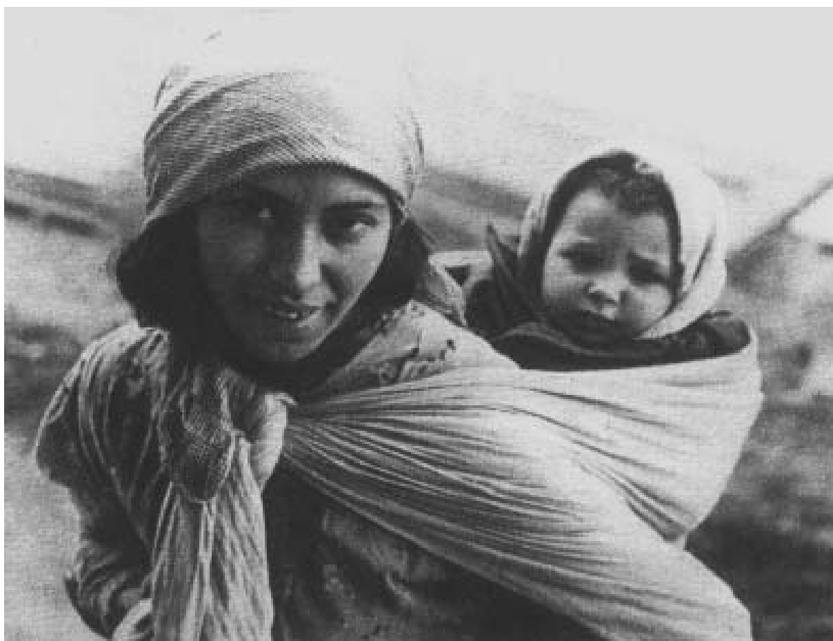
Josef Kubín, Matka, z cyklu Cikáni, 1932 – 36