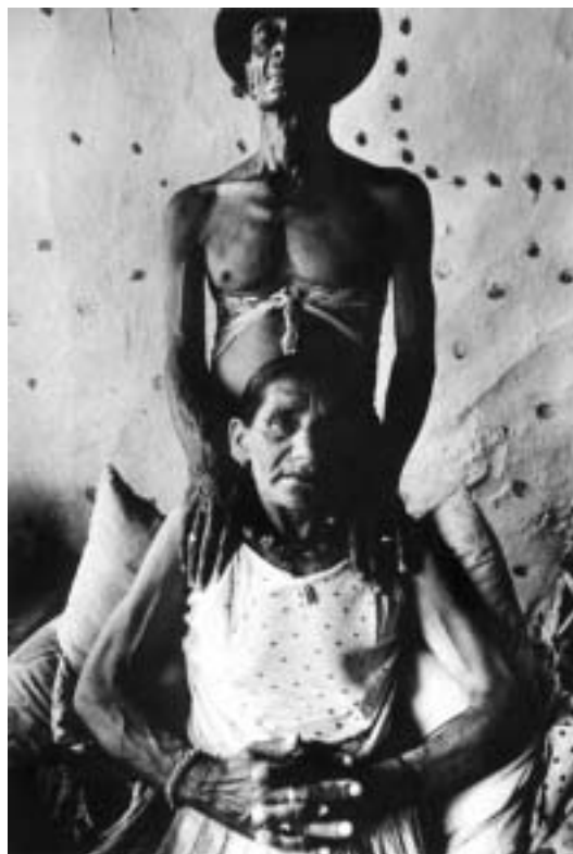
Josef Koudelka, Žehra 1967

V srpnu 1968 fotografoval Koudelka invazi vojsk Varšavské smlouvy. A právě tyto snímky mu přinesly náležitý ohlas v zahraničí; psal o nich i Milan Kundera. Nejznámější z nich dokumentuje prázdné Václavské náměstí. V popředí je polozdvížené předloktí