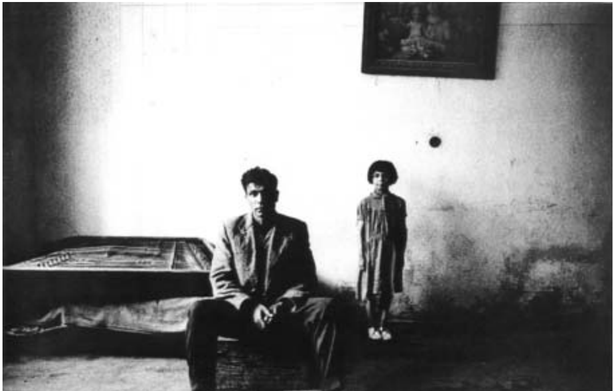
Josef Koudelka, Kadaň 1963