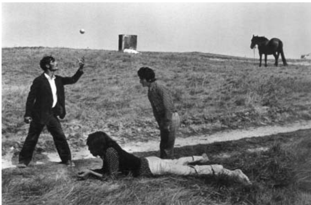
Josef Koudelka, Francie 1973

V roce 1970 odjel Josef Koudelka z Československa. Od Magna získal stipendium na fotografování Cikánů. Dostal tříměsíční výjezdní doložku na cestu po západní Evropě. Po uplynutí lhůty žádal o prodloužení pobytu. Když mu bylo zamítnuto, rozhodl se pro emigraci.