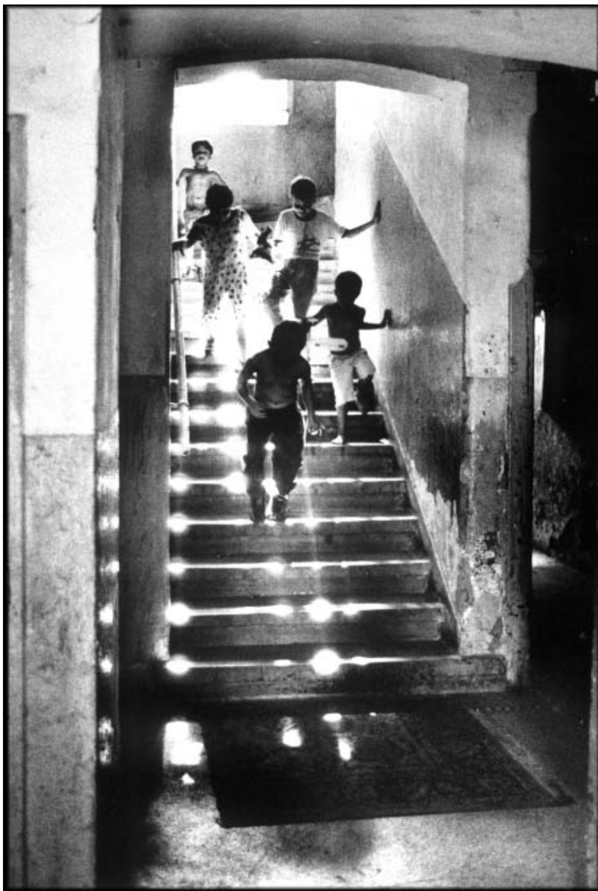
Libuše Rudinská, z cyklu Jiní Pražané, 2000