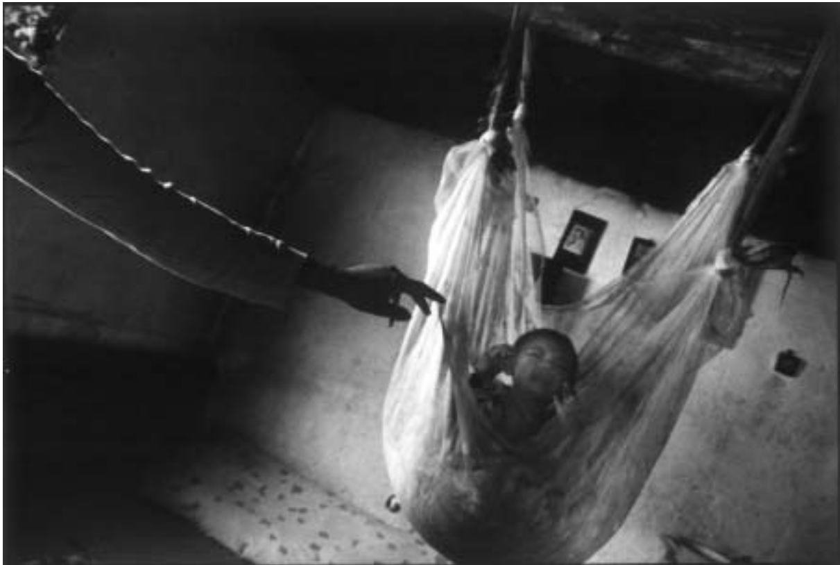
Milan Jaroš, z cyklu Cikáni, 2000 – 2001