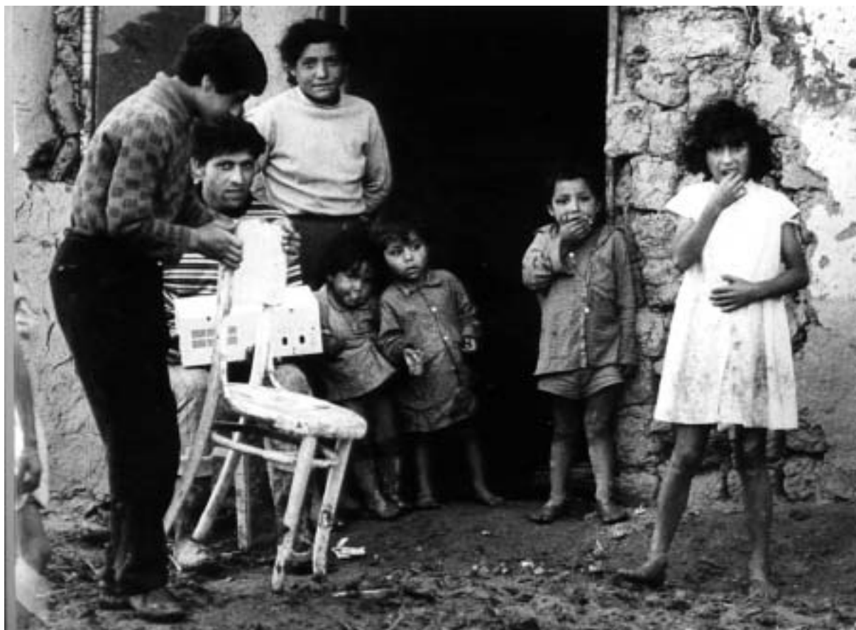
Petr Sikula, Z cyklu Lidé z hliněné vesnice , 1970–71

Sikulovo počáteční zaujetí pro reportáž kulminovalo v jeho cyklu Lidé z hliněné vesnice , který vytvořil v letech 1970 – 1971 v romských osadách na východním Slovensku v okolí Zemplínské Šíravy u Michalovců. Je pokračováním Sikulova obdivu k lidem, kteří dokáží žít svým tradičním způsobem života v harmonii s přírodou.