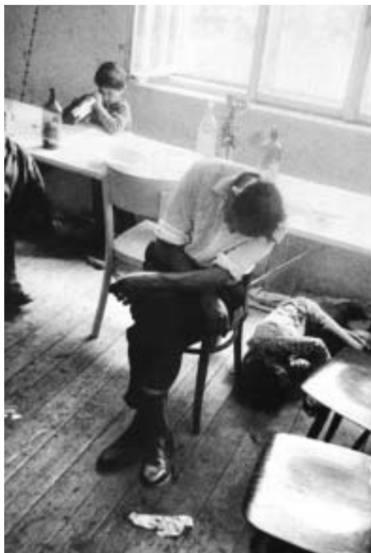
Čierny Balog 1967