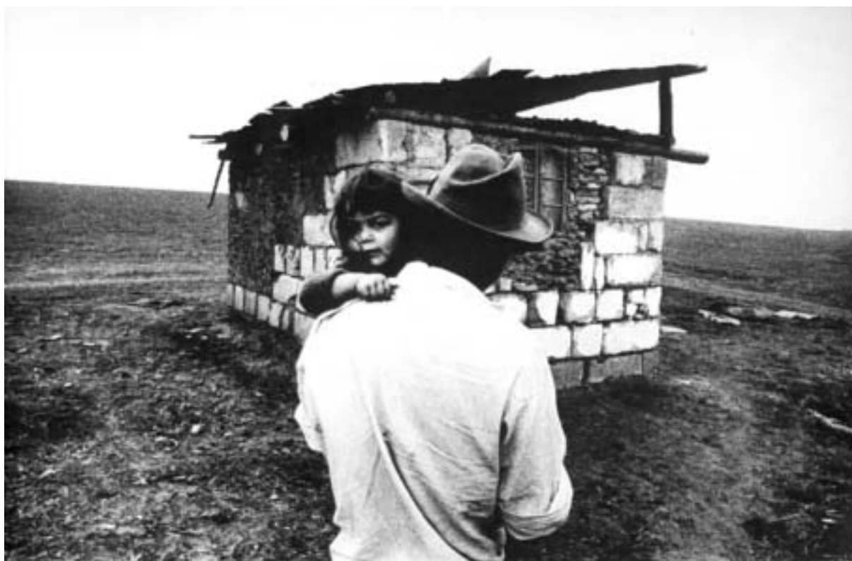
Josef Koudelka, Svinia 1966

Josef Koudelka se začal jako první fotograf vážně zajímat o cikánskou tematiku, dalo by se říci, že toto téma objevil a posléze se mu stalo osudným.