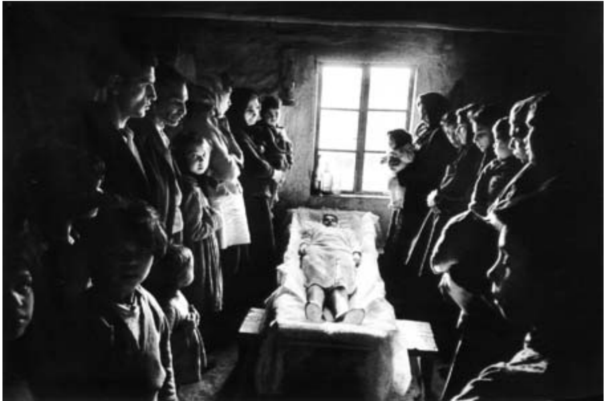
Josef Koudelka, Jarabina 1963