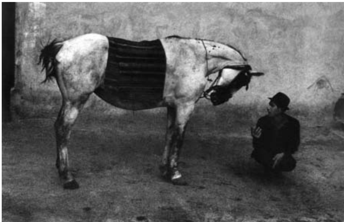
Josef Koudelka, Rumunsko 1968

svou tajemností a mnohovýznamovostí zároveň. Jsou prostými kulisami lidského společenství.