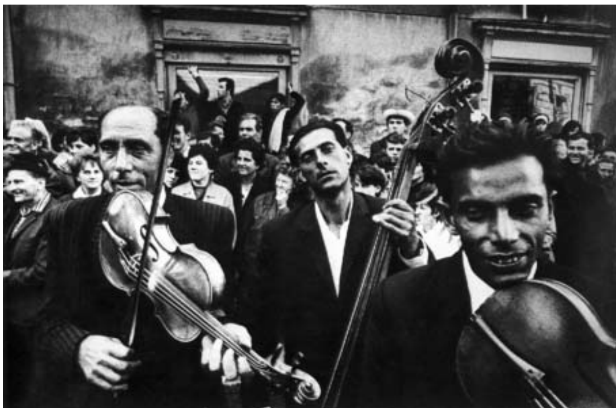
Josef Koudelka, Strážnice 1965