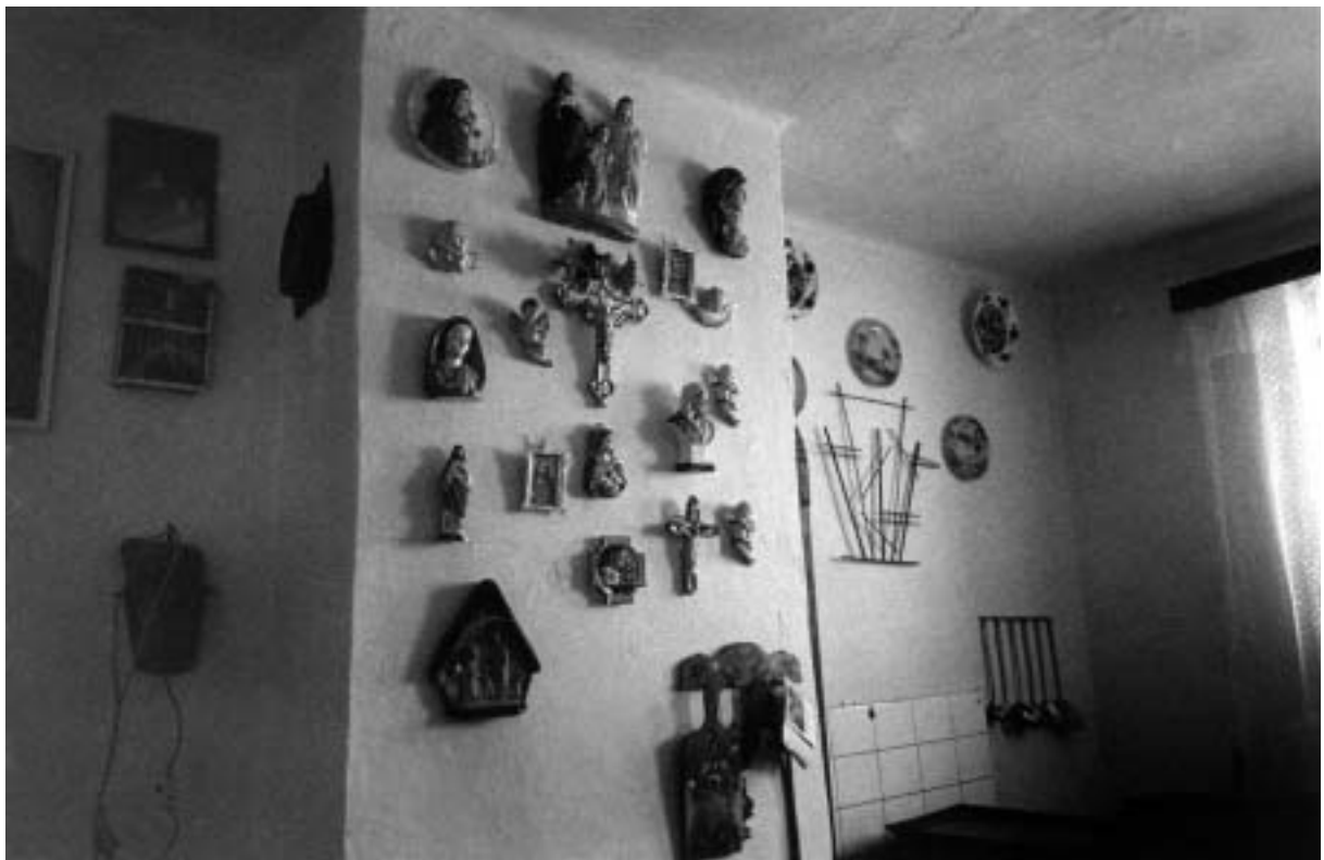
Libuše Jarcovjáčková, z cyklu Cíkáni, Levoča 2003