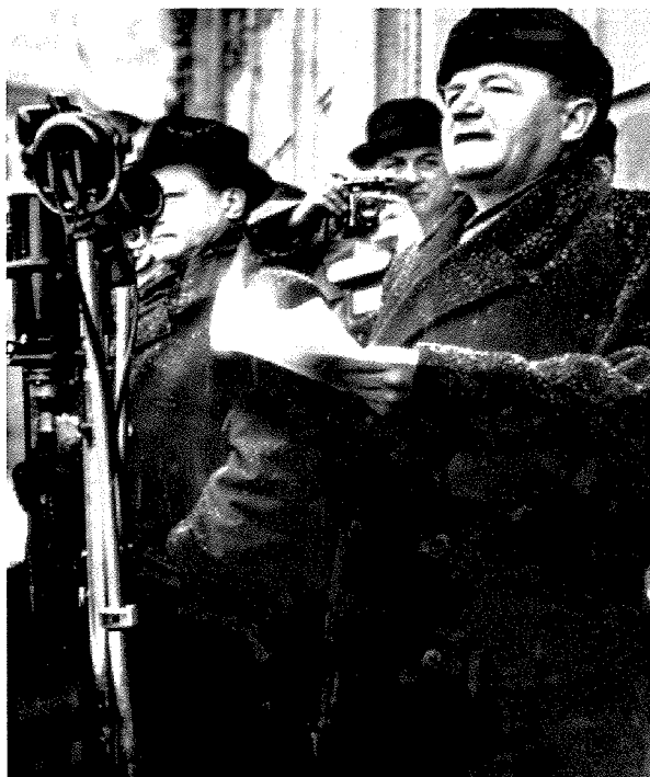
Ia - Klement Gottwald, Vlado Clementis a Karel Hájek - původní fotografie z února 1948