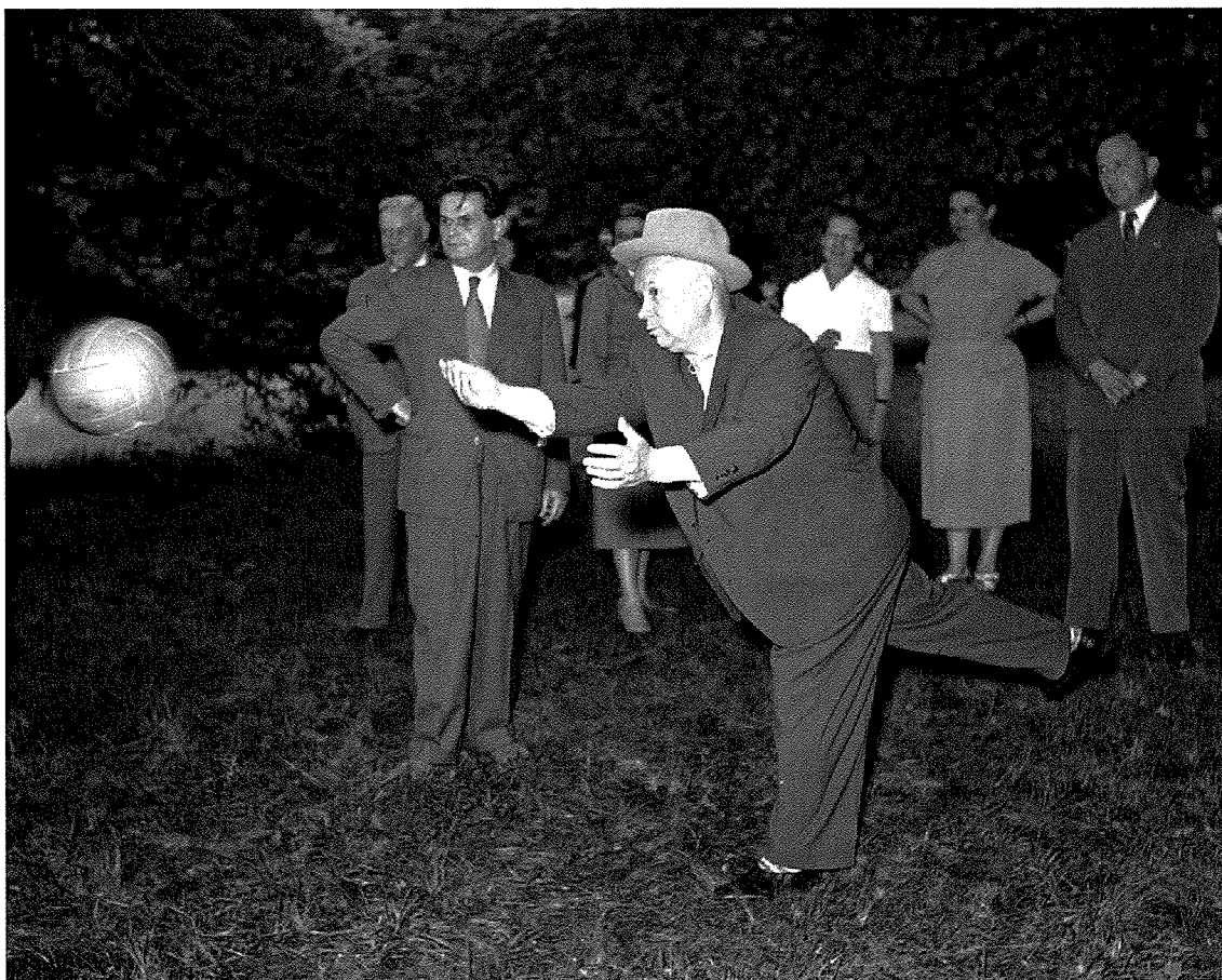
IIIa - Nikita S. Chruščov v Lánech, červenec 1957.