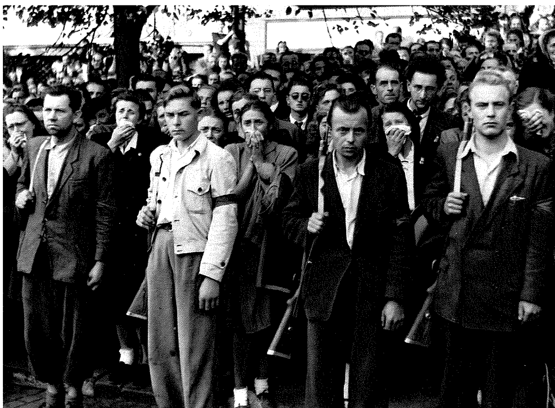
Ie - Trasa smutečního průvodu Prahou při pohřbu prezidenta Edvarda Beneše, 8. září 1948.