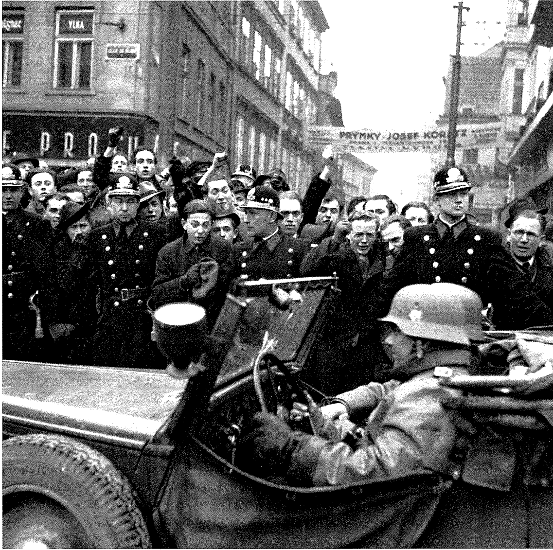
Ic - Pražané zlostně hrozí zaťatými pěsti přijíždějícím okupantům, 1939.