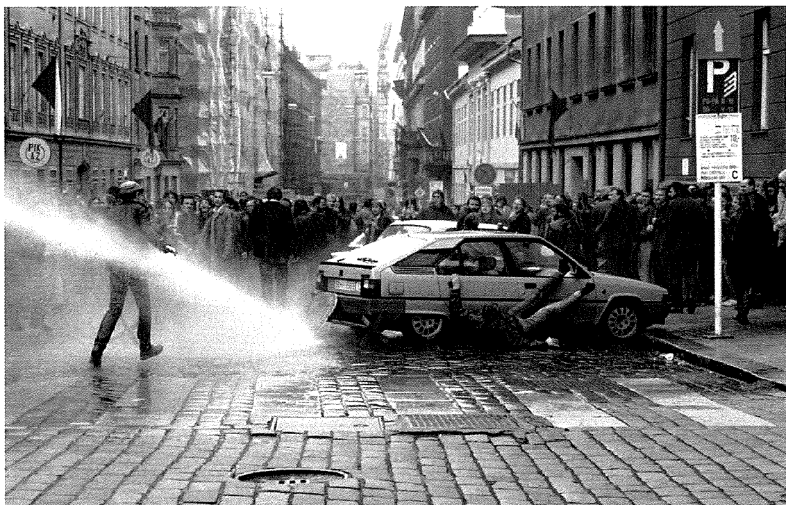
Ig - Policejní zásah vodním dělem proti účastníkům pokojné manifestace v Praze, 28. říjen 1988.