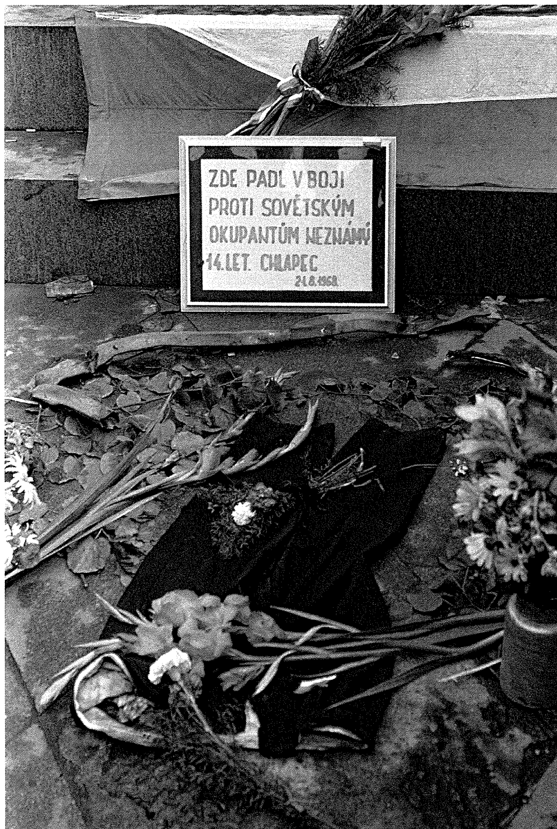
If - Pomníček obětí okupace, 1968.