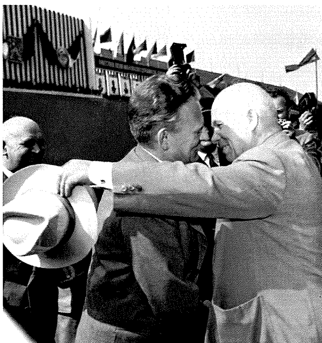
IId - Retušovaná verze