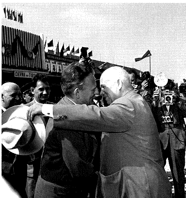
IIC - Antonín Novotný a Nikita S. Chruščov v bratrském objetí, v pozadí Vilém Barák.