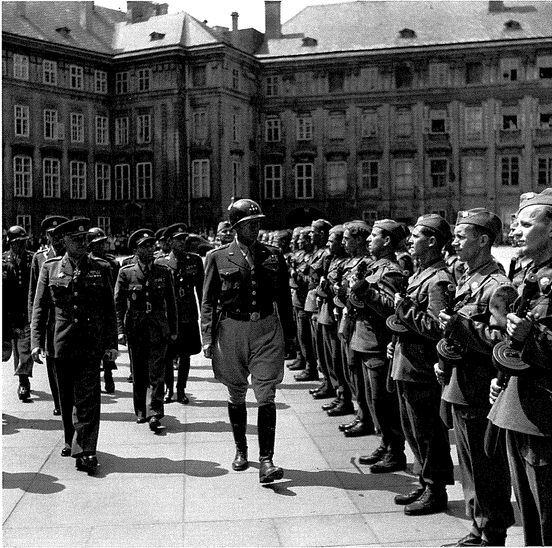
Id - Americký generál George S. Patton na Pražském hradě, 27. července 1945.