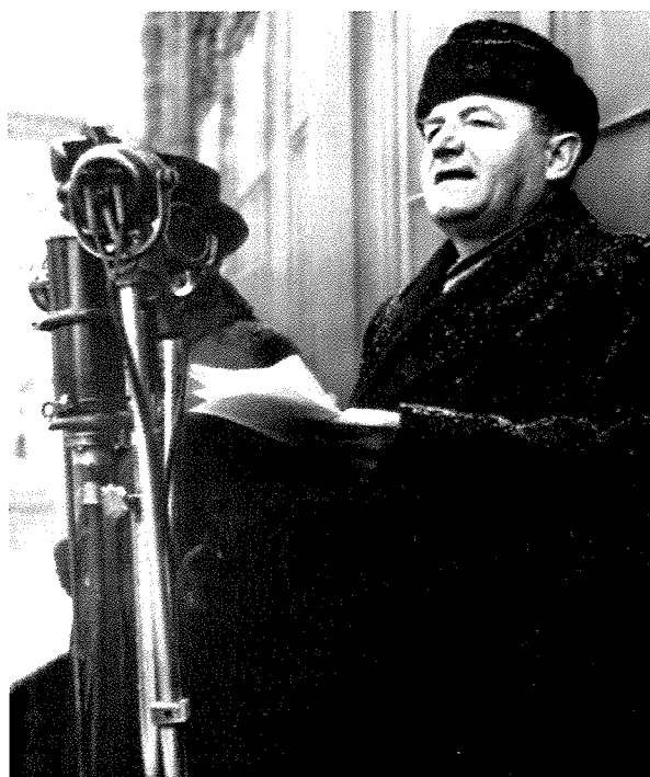
Iib - Retušovaná verze