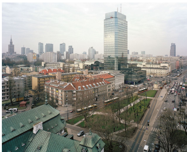
Z serií Inne Miasto , Elżbieta Janicka a Wojciech Wilczyk, 2011

Jak říkají sami autoři: „(projekt) navrhuje reflexi postupných etap vytváření poválečné Varšavy, koncepcí architektury a urbanismu, z nichž každá vychází z hodnocení minulosti a zároveň je formou uvažování o současnosti a budoucí společnosti: od rovnostářských vizí sociálního bydlení až po neoliberální logiku maximalizace zisku bez respektování předchozích předpokladů a na úkor sociální soudržnosti. Symbolická místa zobrazená na fotografiích - bývalá nemocnice Bersohn a Bauman, synagoga Nożyk, bývalá ulice Nalewki, bývalý Umschlagplatz a další - se zapsala do dějin židovské Varšavy jako 'Jiné město’.” 2