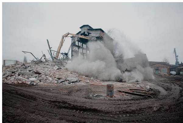
Rozbiórka zespołu siedmiu budynków mieszkalnych robotników stoczniowych, wzniesionych przez fundację Schichaua pod koniec XIX wieku. Numery inwentarzowe: 177, 179, 181, 183, 185, 187, 189., Michał Szlaga, 2011

Szlaga se svými fotografiemi zachází jako s důkazy v teoretickém procesu. Podle jeho názoru byly proměny v loděnici něčím, co by mělo zajímat právníky. Zdůrazňuje však, že díky svým fotografiím získal v oblasti sporu subjektivitu: „(...) Chtěl jsem zdokumentovat budovu předtím, než zmizí, i když jsem netušil, jak tento proces zastavit. Proběhly první pokusy o lobbování, setkání s poslanci a senátory a pokusy o zásadní ovlivnění: <<podívejte se, jak je krásná, pojďme vytvořit společnou akci a začít ji chránit>>. Zároveň jsem časem přestal věřit, že moje fotografická práce je užitečná. Tuto možnost jsem spíše viděl v kontextu toho, že jsem zůstal takto rozpoznatelným fotografem. To mi dalo hodně. „Ne hodnota mé práce, ale situace, která se díky ní vytvořila. Dokázal jsem se ozvat.” 2