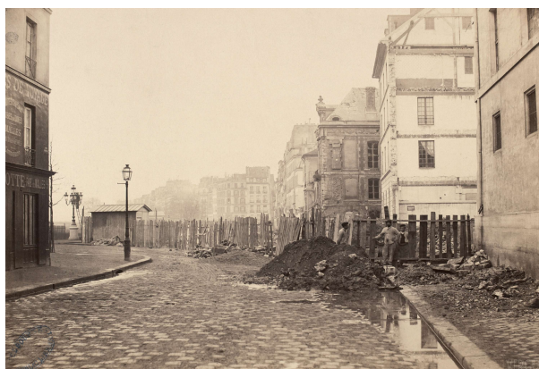
Rue du Sully, Charles Marville, 1876

Marvillovým prvotním úkolem bylo zdokumentovat staré budovy a ukázat jejich nestandardní prvky, aby bylo možné konfrontovat fotografie z doby před přestavbou s postupně vytvářenými fotografiemi již modernizovaných prostor. Aktivity, které prefektura zadala, měly jednoznačně propagandistický charakter a jejich cílem bylo vytvořit u veřejnosti pozitivní vnímání investice. To souviselo s tím, že přestavba byla silně kritizována. Jeho odpůrci obviňovali Haussmanna z experimentování s živým městským organismem a z bezohledného ničení mnoha historicky cenných oblastí městské zástavby (především centrálních čtvrtí Saint-Denis a Saint-Martin). Je důležité zdůraznit, že Marvillovy fotografie nebyly nástrojem sociální intervence, ale pákou, kterou používalo centrum moci. Nicméně klíčovou otázkou je kauzální síla fotografického obrazu aplikovaného na městský diskurz. 2