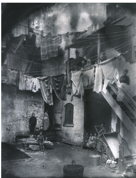
Mulberry Bend in the Five Points neighborhood, Jacob Riis, c. 1896.

Side, v té době nejhustěji obydleném místě na světě. Brzy se stal známým jako jeden z nejvýznamnějších sociálních reformátorů ve městě. V roce 1890 vydal svou první a nejvýznamnější knihu fotografií: Jak žije druhá polovina: Studie mezi newyorskými činžáky . Publikace se stala katalyzátorem celostátní reformy stavebních předpisů a významně ovlivnila právo a vztahy mezi pronajímateli a nájemci. Fotografické série představené v knize představují referenční rámec pro všechny fotografy a historiky, kteří se věnují sociálním změnám v městském prostoru. 1