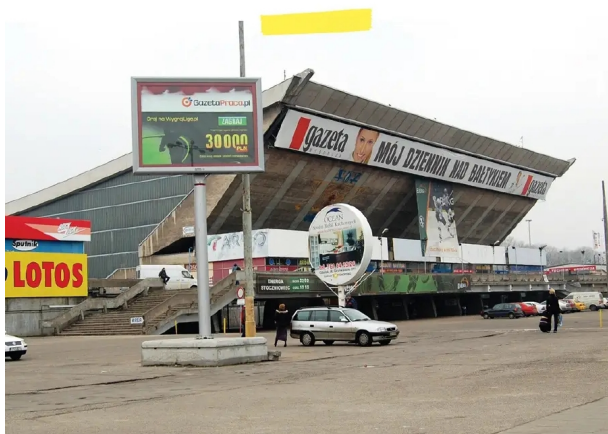
Elżbieta Dymna, Marcin Rutkiewicz, 2009

Tématem, které bylo v posledních dvou desetiletích obzvláště intenzivně zkoumáno, je vizuálně se zhoršující kvalita veřejných prostranství v polských městech. Ulice a budovy zaplavené reklamami jsou výrazem progresu neomezeného kapitalismu, jehož cílem je privatizovat a zpeněžit každý kousek města. Fotografie je samozřejmě nositelem diskurzů, které tento fenomén kritizují. Významnými subjekty tohoto diskurzu byly organizace a sociální hnutí z vizuálně nejznečištěnějšího města v Polsku – Varšavy. 1