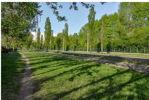
Ulica Bema, Toruń, Marek Wieczorek, 2011

Síly fotografie jako kauzální páky si všimla městská hnutí a aktivisté z mnoha koutů Polska. Fotografie zobrazující změny v městském prostoru jsou často hlavním referenčním rámcem ve veřejné diskusi.