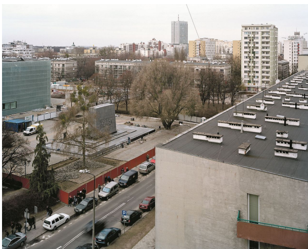
Z serií Inne Miasto , Elżbieta Janicka a Wojciech Wilczyk, 2011

ghettu. Na velkoformátových tiscích se opakují stejná místa a budovy - stejné fragmenty prostoru jsou zobrazeny v jiném řezu a z jiného úhlu. Slovy tvůrců výstavy: „tyto prvky umožňují divákovi rekonstruovat celek dokumentovaného území”. 1 Podrobné popisy, které jsou připojeny k fotografiím, umožňují vidět i ty nejmenší stopy po bývalých budovách ghetta - vysoké rozlišení velkoformátových fotografií umožňuje rozeznat i ty nejmenší detaily.