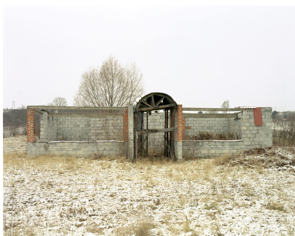
Z serii Niedokończone domy , Konrad Pustoła