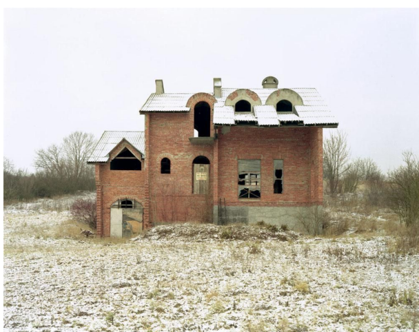
Z serii Niedokończone domy , Konrad Pustoła

Za každou z vyfotografovaných budov se skrývá nesplněný slib a životní neúspěch, který je důsledkem nějaké individuální finanční katastrofy, souhry náhod nebo makroekonomických podmínek vyplývajících z neoliberálních ekonomických vztahů v postkomunistickém Polsku. 1