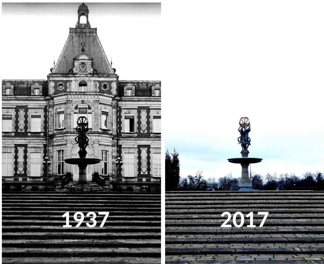
Hannibal Smoke, 2017

nevinně vypadající zarostlé kopce. V sociálních médiích však rozšiřuje perspektivu publikace knihy a staví do kontrastu stavby vizualizované na archivních fotografiích se současnými, precizně pořízenými fotografiemi stejných míst zachycujícími zbytky památek. 1