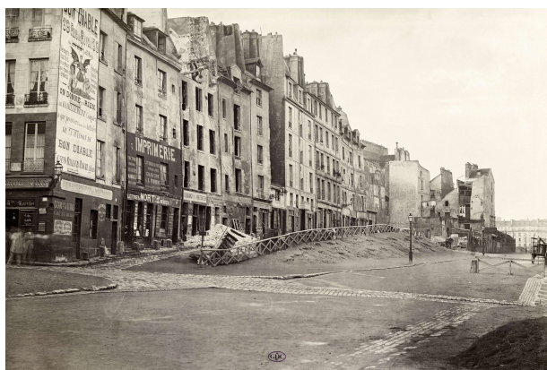
Rue du Clos Bruneau, Charles Marville, c. 1965

odstranit dříve výborné podmínky pro stavbu barikád ve městě a organizování ozbrojených povstání. 1