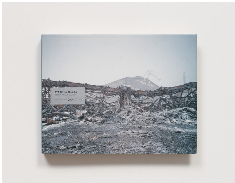
Stocznia, Michał Szlaga

proces ničení historické struktury loděnice, ale také postupné fáze zániku místa, které má pro nedávnou historii Polska symbolický význam. Výsledkem těchto prací jsou publikace v nejvýznamnějších polských tiskovinách a fotografická kniha „Stocznia”, která vyšla v roce 2013. 4