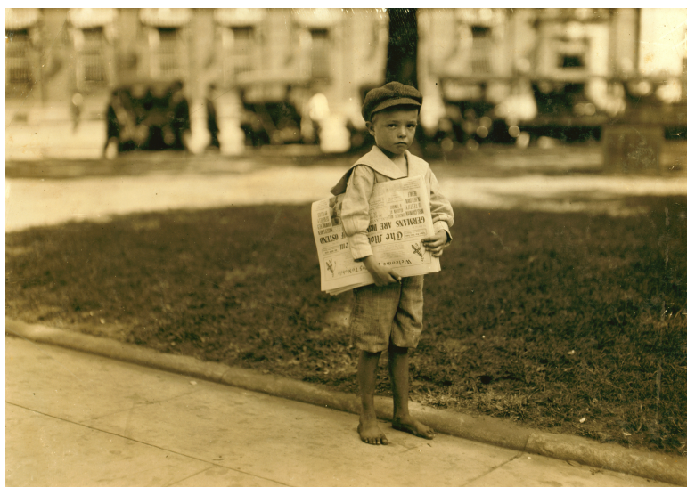
Ferris, 7 year old newsie, Mobile, Alabama, Lewis Hine, 1914

fotografie nepochybně zvýšily povědomí o skutečných sociálních nákladech na rozšiřování měst. 1