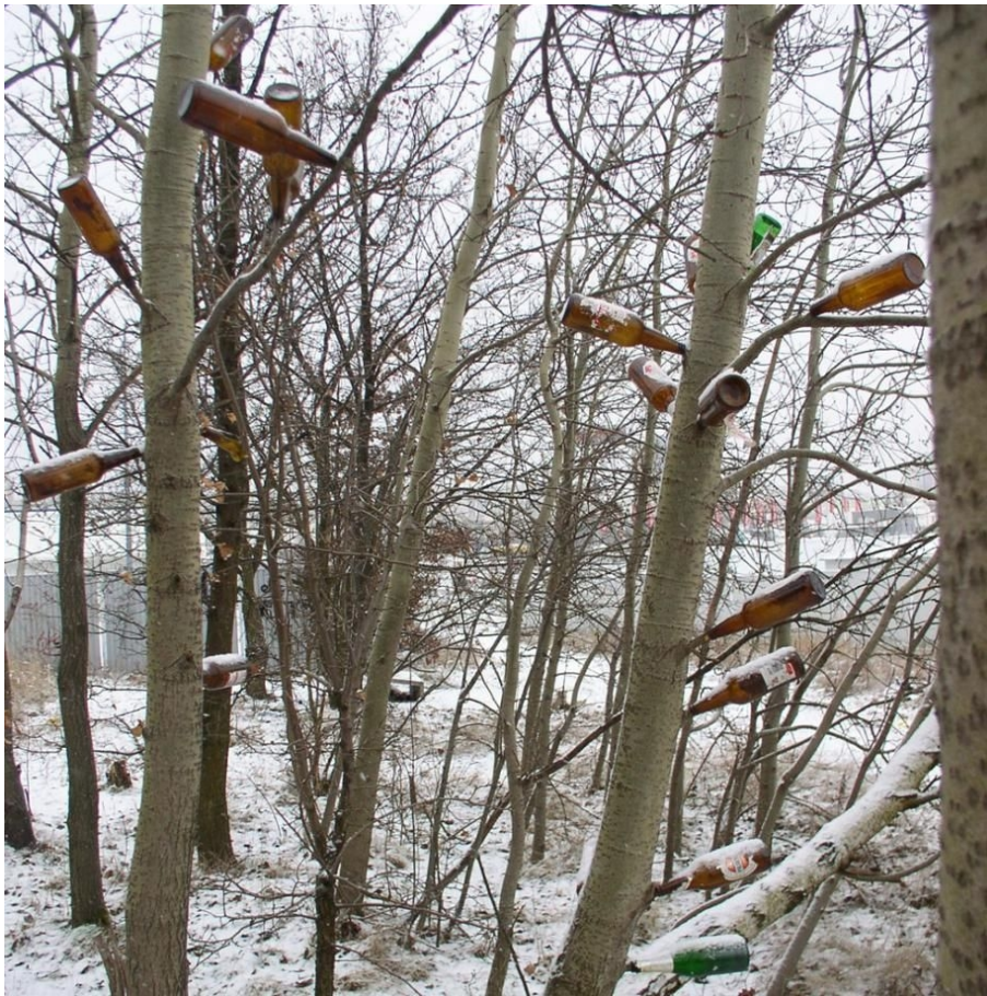
Niewidzialne miasto , edit. Marek Krajewski

usnadnění každodenního života, ale také poplašné systémy, poutače a zdi postavené na ochranu soukromí. Shromážděné fotografie měly dokázat, že město není abstraktní struktura, kterou lze libovolně měnit, ale spíše místo, kde žijí lidé, prostor plný rozporů, který je vytvářen každodenními, banálními postupy jeho obyvatel. Projekt Neviditelné město, v němž badatelé nacházejí dosud málo rozpoznané fenomény v neustále vytvářené sociální realitě, je proto také důležitým hlasem polské vizuální antropologie. 1