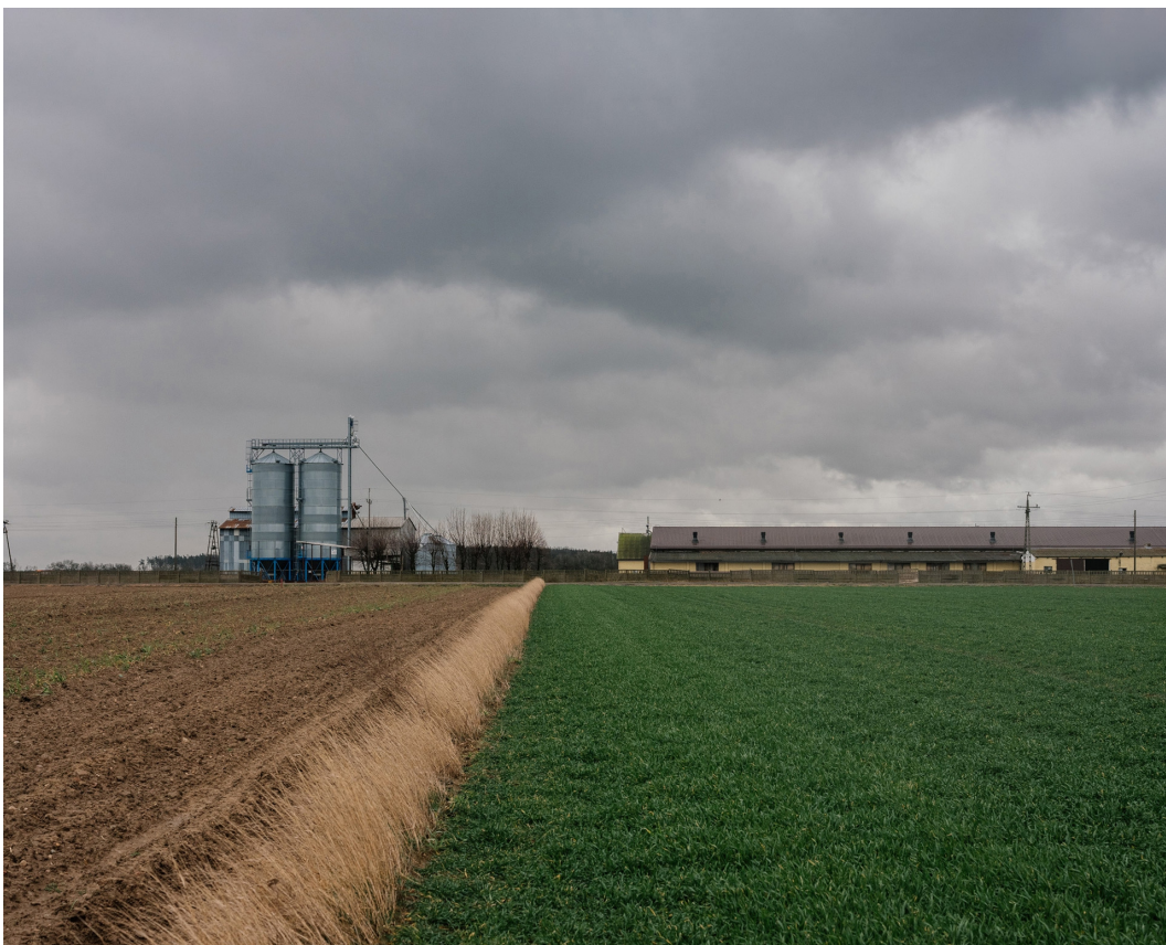
Trouble in Paradise, 2020