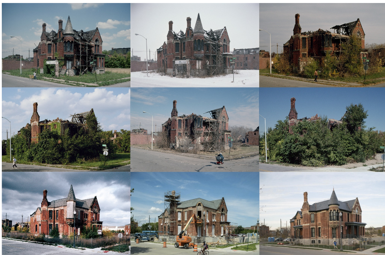
Ransom Gills House