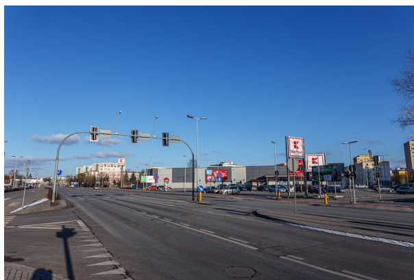
Ulica Bema, Toruń, 2021