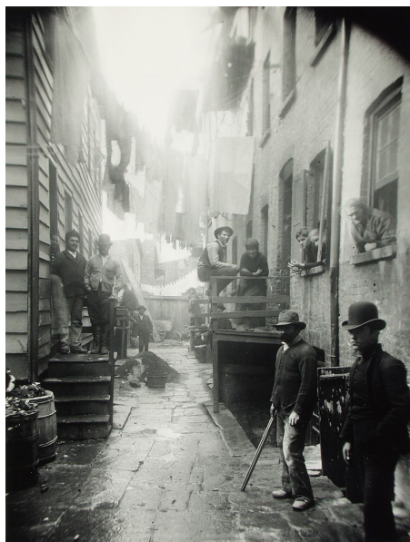
Bandit's Roost, Jacob Riis, 1888

Další významnou osobností byl Lewis Hine (1874-1940), který opustil místo učitele na School of Ethical Culture v New Yorku a stal se fotografem pracujícím pro National Child Labour Committee, organizaci, která se zabývala zlepšováním pracovních a životních podmínek dětí. Během následujících třinácti let pořídil Hine tisíce fotografií - často pracoval v utajení, bez jakéhokoli povolení - zachycujících děti pracující po celé zemi v továrnách, manufakturách a na ulicích. Jeho práce byla významným příspěvkem k diskurzu nejen o životních podmínkách městských dětí, ale také o celosvětových pracovních právech. Jeho