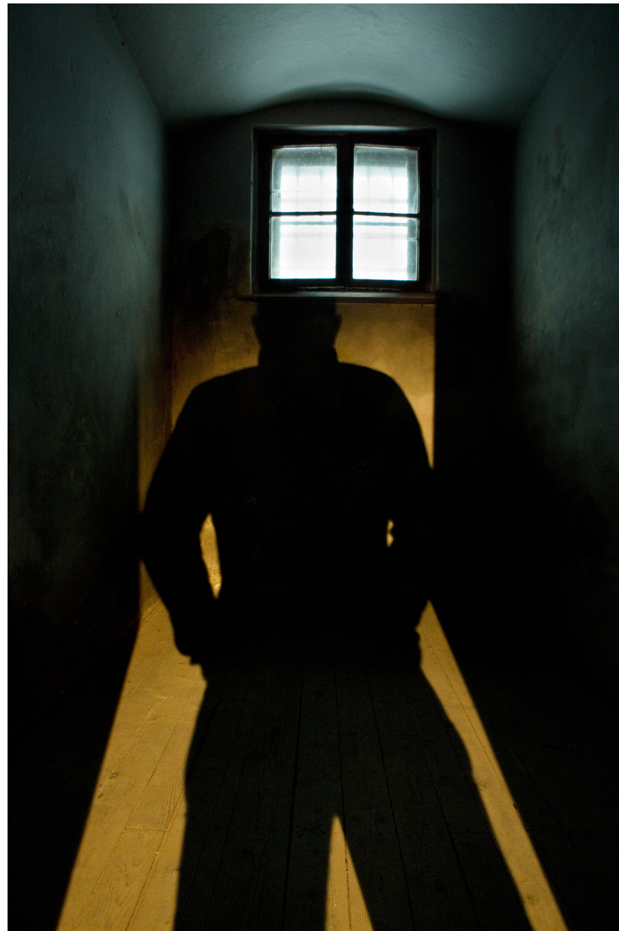
Malý velký strach I Autoportrét