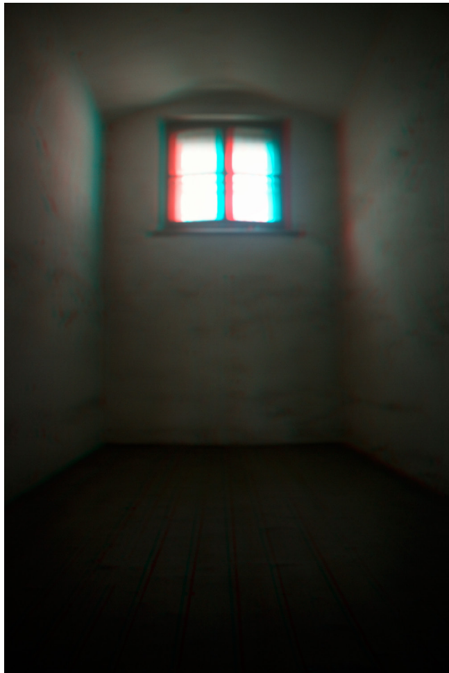
Camera obscura | Sluneční hodiny 01 | 3D cela