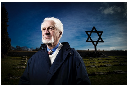
Obr. 30 - Toman Brod, z cyklu Přeživší , 2014