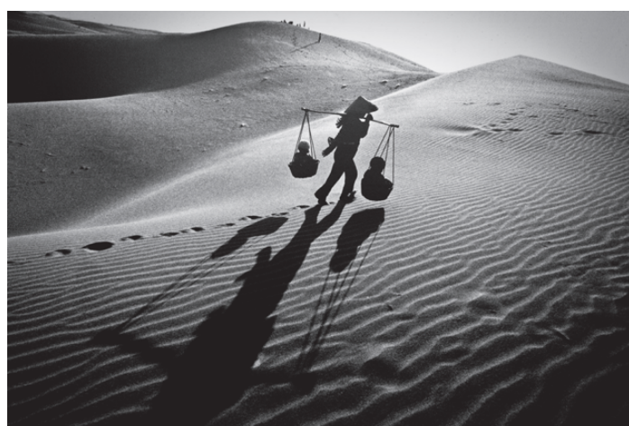
Obr. 43 - Nguyễn Phương Thảo, 2003 (Mot, Hai, Ba: fotografie z Vietnamu 1961–2011)