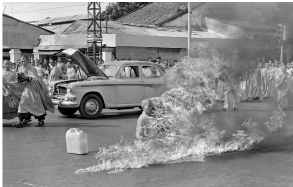
Obr. 14 -, sebeupálení Thích Quảng Đức, 1963