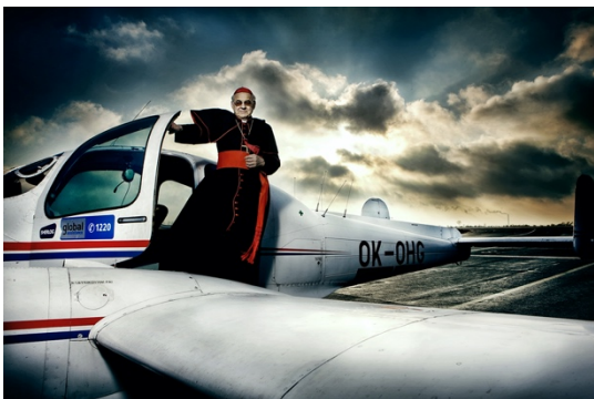
Obr. 31 - kardinál Miroslav Vlk, z cyklu Splněné přání , 2009