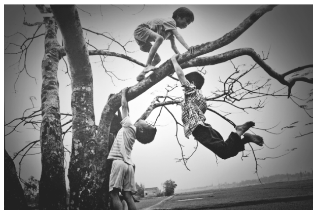
Obr. 29 - Nguyễn Phương Thảo, Děti na vietnamském venkově, 1998 (Mot, Hai, Ba: fotografie z Vietnamu 1961–2011)

2006 Czech Press Photo – Umění, Čestné uznání