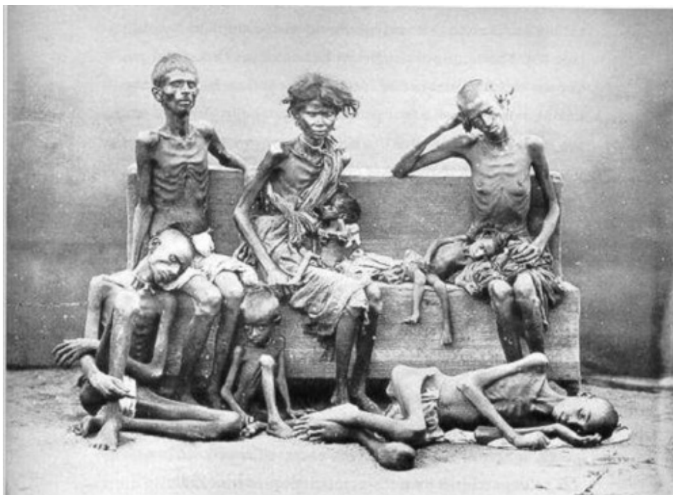
Obr. 3 - Vĩ An Ninh, Hladovějící děti na lavičce, 1945 (wikipedia.org)

případ, jde o celospolečenský jev, ovlivněný mnoha faktory, které stručně načrtnu v následující kapitole.