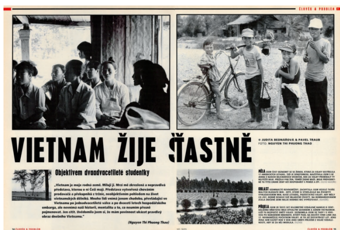
Obr. 14 – Mladý svět č. 18, 1995