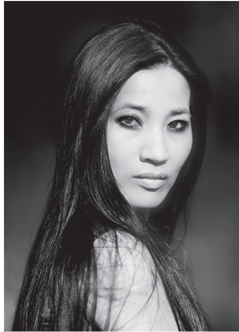
Obr. 1 – David Neff, portrét Nguyễn Phương Thảo, 2009 (wikipedia.org)