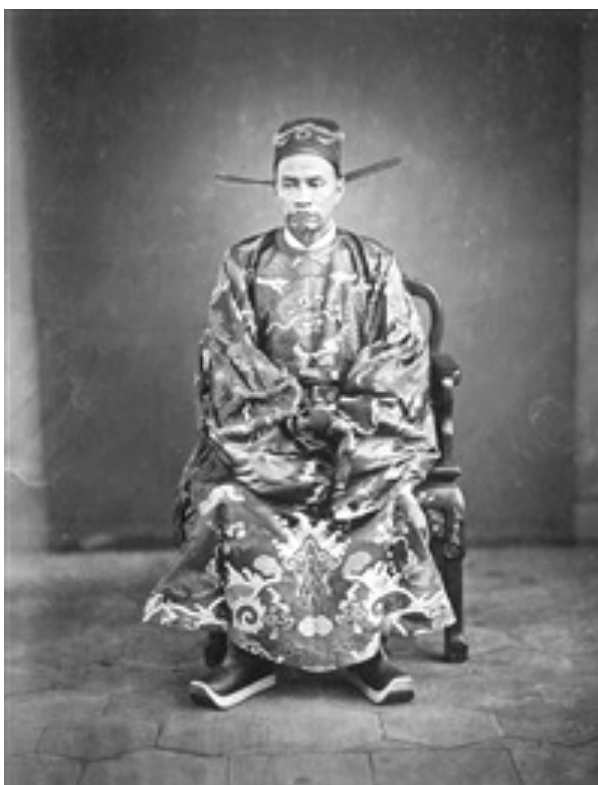
Obr. 4 - Émile Gsell, portrét velvslance Nguyễn Hữu Đệ, datace neznámá (artnet.com)

Můžeme si například také všimnout přehlížení čínských ateliérů v oficiálním výkladu, i když jedny z prvních v Saigonu pořízených fotografií pocházejí právě od čínských ateliérů, jakými byli například Tong Sing, Pun Lun a Yu Chong. Někteří z těchto fotografů se později při dekolonizaci rozhodli stát vietnamskými občany. V dřívější době se fotografie využívala hlavně k zachycení portrétů koloniálních správců a