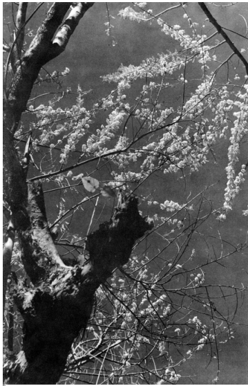
Obr. 9 - Võ An Ninh, datace neznámá