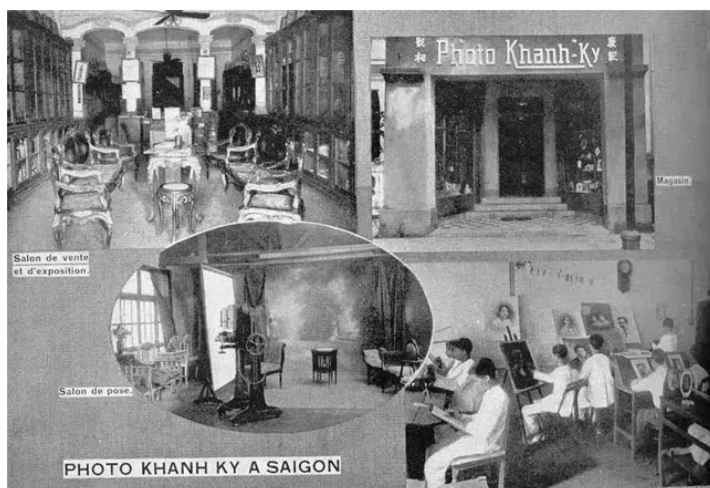
Obr 8 - pohlednice/reklama ateliéru Khánh Ký v Sài Gòn

Rychlý nárůst počtu ateliérů ve Vietnamu v 30. letech 20. století napomohl k založení Sdružení přátel fotografických pracovníků. Členové, kteří se ztotožňovali s osvobozeneckými tendencemi, byli většinou ateliéroví fotografové, bezproblémově přecházející z komerční tvorby k zpolitizované praxi. V této době se díky proliferaci média a technické šikovnosti objevují i umělečtí fotografové. Vedle toho se pomalu rodí fotožurnalistika, která slouží hlavně revoluci