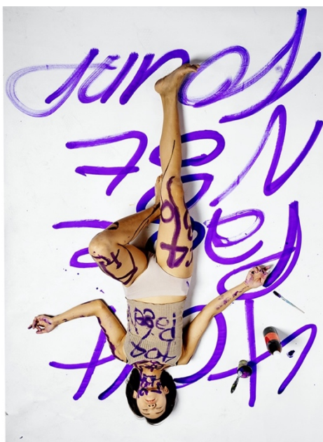
Obr. 26 - Nguyễn Phương Thảo, hongkongská politická umělkyně Loretta Lau, 2020