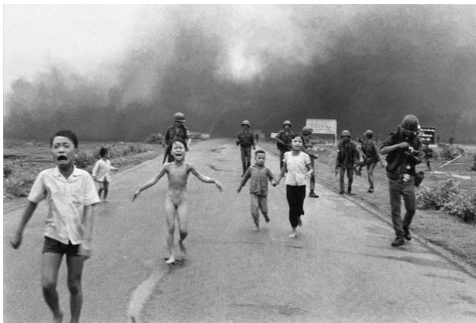
Obr. 13 - Nick Ut/AP, The Terror of War, 1972 (wikipedia.org)