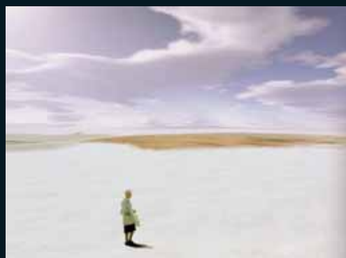
Obr. 122, Mathieu Bernard-Reymond, Ze souboru Vous êtes ici, 2002