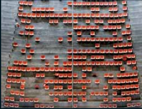
Obr. 143, Andreas Gefeller, Untitled (Stadium) Düsseldorf, 2002