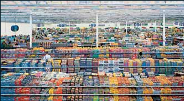
Obr. 83, Andreas Gursky, 99 Cent, 1999