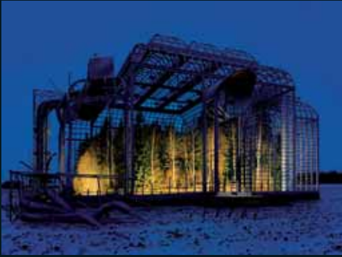
Obr. 127, Ilkka Halso, Museum I, 2004