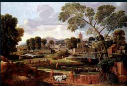
Obr. 162, Nicolas Poussin, The Funeral of Phocion , 1648