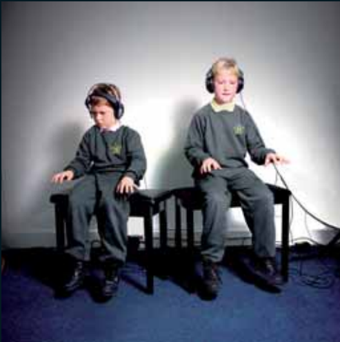
Obr. 27, Wendy McMurdo, The Sabin Brothers , 1998