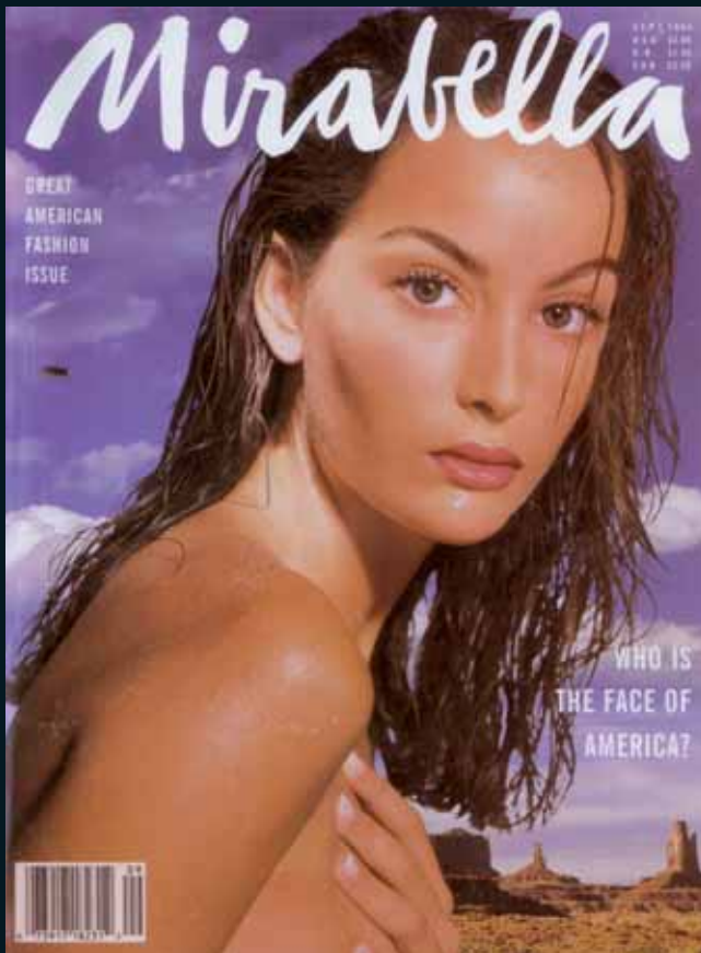
Obr. 3, Hiro, časopis Mirabella , září 1994