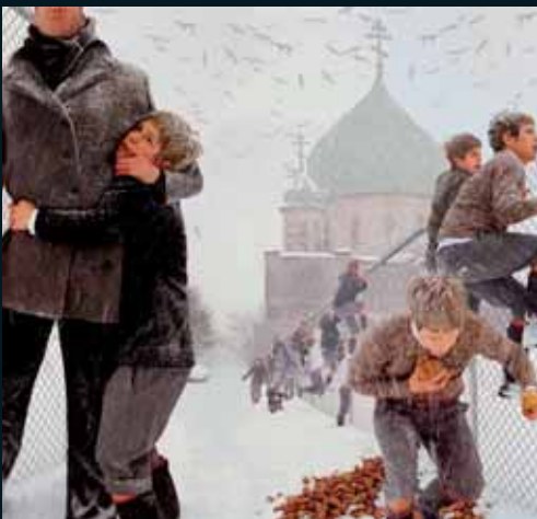
Obr. 110, Anthony Goicolea, Blizzard , 2001