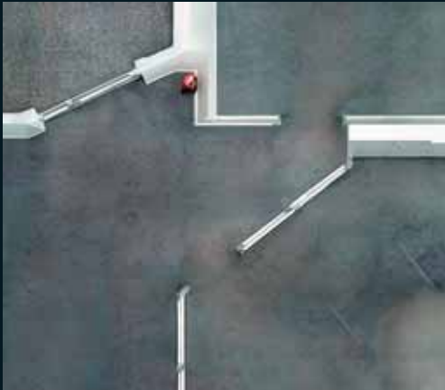
Obr. 142, Andreas Gefeller, Untitled (Office Floor) Düsseldorf, detail, 2003