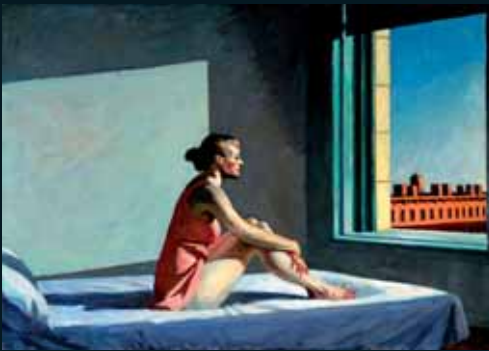
Obr. 46, Edward Hopper, Morning Sun , 1952