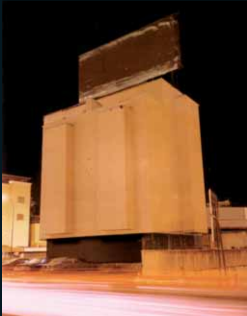
Obr. 181, Alexander Apostol, Sevres, 2001