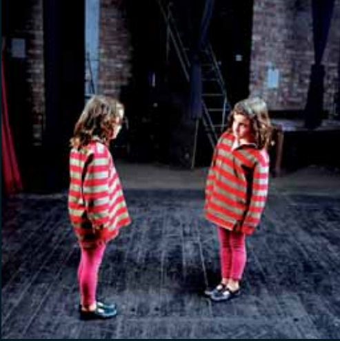
Obr. 25, Wendy McMurdo, The Glance , 1995