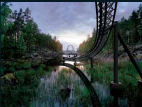
Obr. 130, Ilkka Halso, Roller coaster, 2004