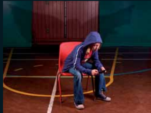
Obr. 30, Wendy McMurdo, The Games Hall , 2007