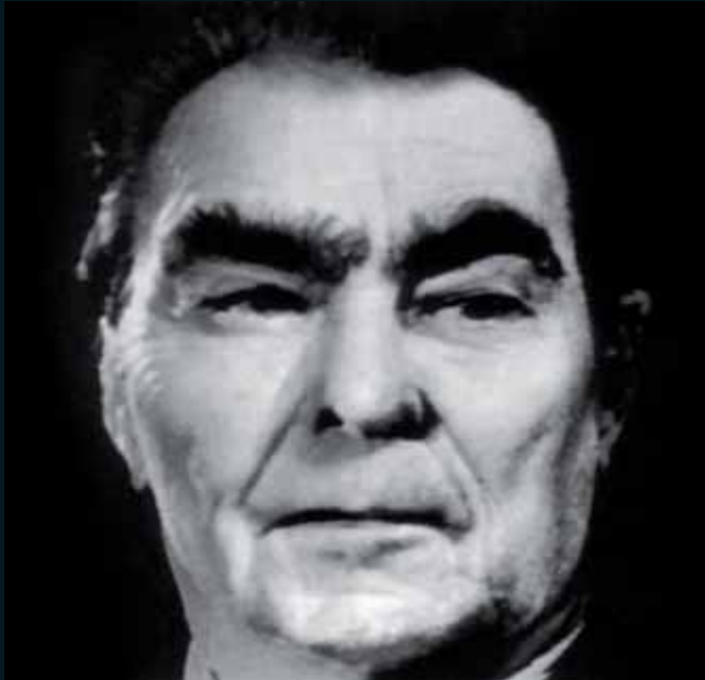
Obr. 2, Nancy Burson, Warhead 1 , 1982