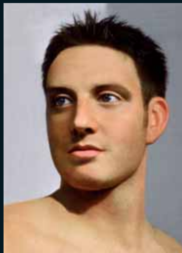
Obr. 9, LawickMüller, Apollo from Olympia, 1999