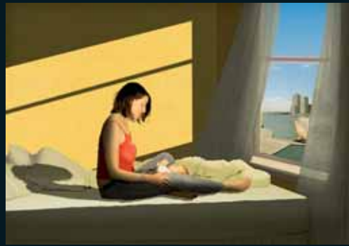
Obr. 47, Caroline Shepard, Avra , 2004