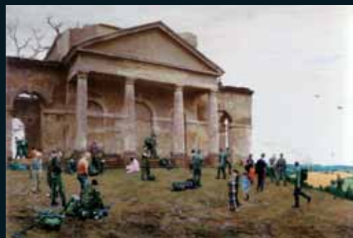
Obr. 163, John Goto, High Ground , 2000–2001