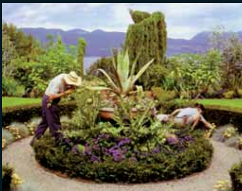
Obr. 133, Scott McFarland, Inspecting Allan O'connor Searches for Botrytis cinerea , 2003