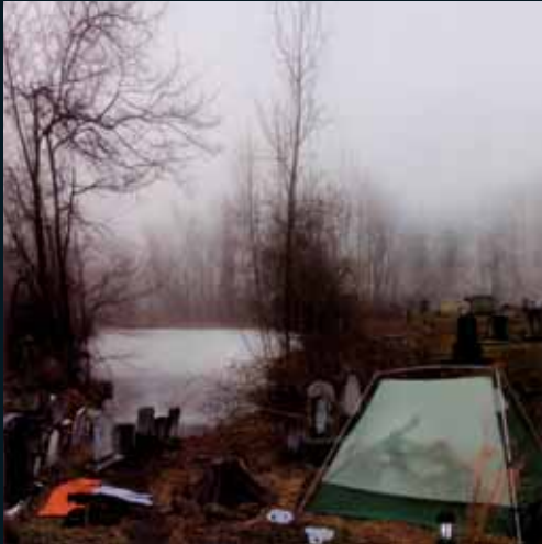
Obr. 117, Anthony Goicolea, Morning Sleep , 2004