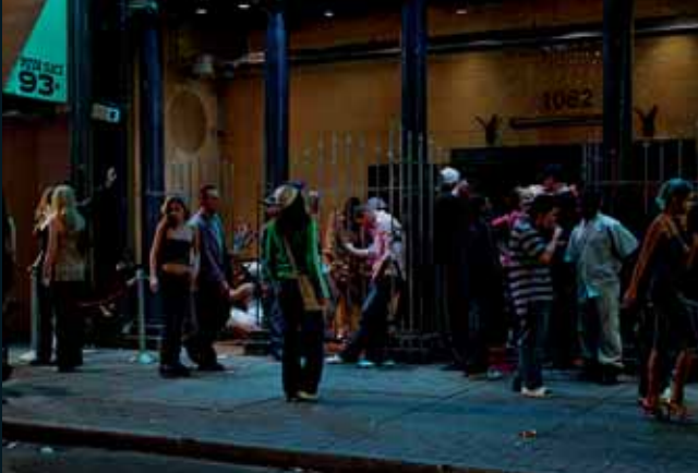
Obr. 75, Jeff Wall, In front of the Nightclub , 2007