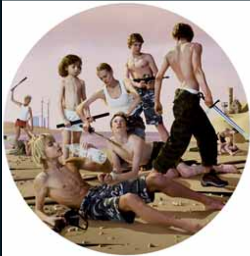
Obr. 22, AES+F, Ze souboru Last Riot, Tondo #3, 2005–2007