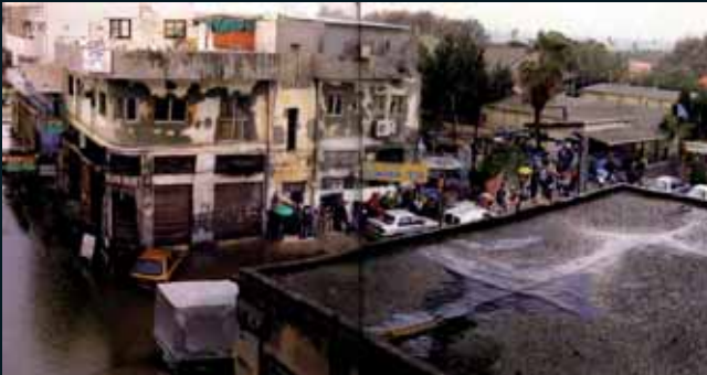
Obr. 76, Barry Frydlender, Flood , 2003