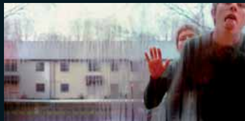
Obr. 112, Anthony Goicolea, Window washer , 2001