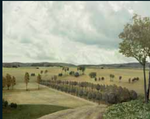
Obr. 159, Marc Baruth, The Avenue , 2005