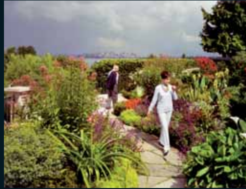
Obr. 132, Scott McFarland, On The Terrace Garden (Joe and Rosalee) , 2004