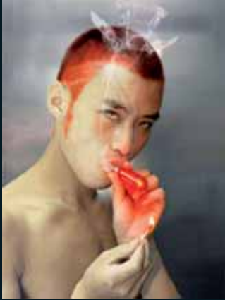
Obr. 51, Yang Guowei, Ze souboru Cartoon Generation, 2005