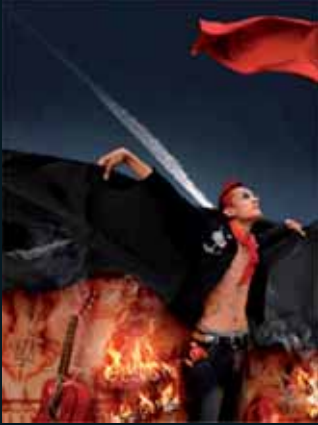
Obr. 50, Yang Guowei, Ze souboru Cartoon Generation, 2005