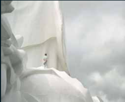
Obr. 120, Mathieu Bernard-Reymond, Disparitions #75, 2003