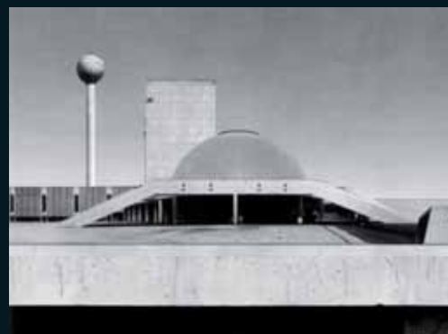
Obr. 154, Beate Gütschow, S #11, 2005