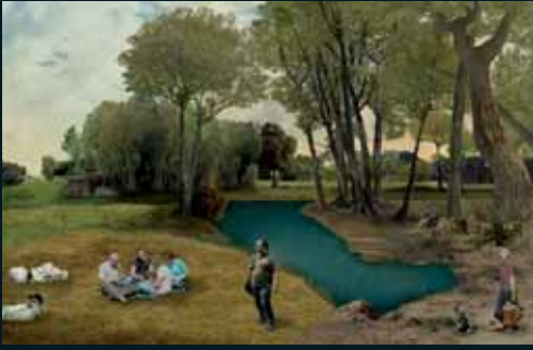
Obr. 156, Marc Baruth, Cows shepherds and duckhunters , 2007