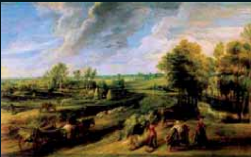
Obr. 160, Peter Paul Rubens, Return from the harvest , 1635