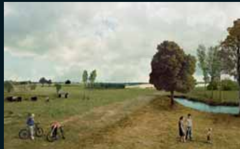
Obr. 161, Marc Baruth, Homecoming after the harvest , 2005