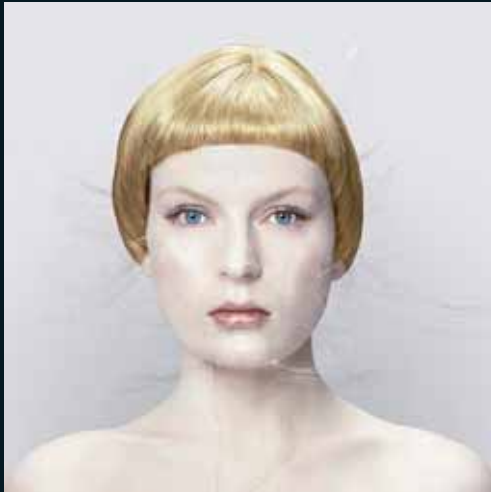
Obr. 63, Michael Najjar, Bionic Angel, 2006