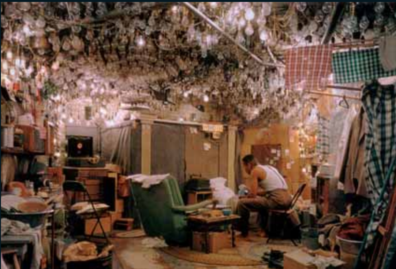
Obr. 73, Jeff Wall, After Invisible Man by Ralph Ellison the Prologue , 1999–2001