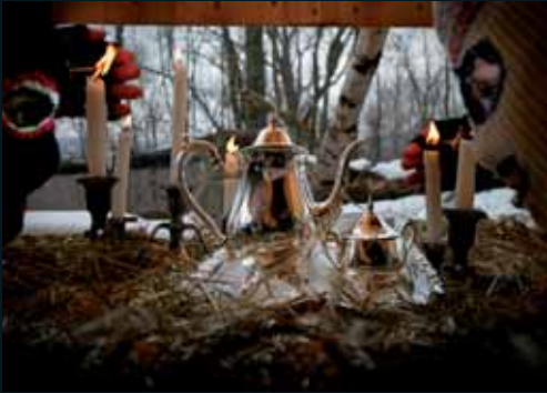
Obr. 116, Anthony Goicolea, Still Life with Tea , 2004