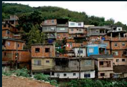
Obr. 182, Rodrigo Favera, Favela v Rio de Janeiro