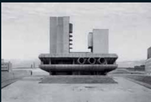
Obr. 153, Beate Gütschow, S #14, 2005