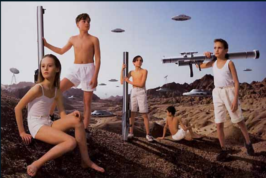
Obr. 21, AES+F, Ze souboru Action Half Life, Episode 1, #7 , 2003–2005