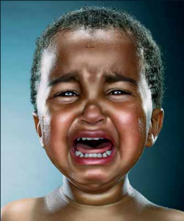
Obr. 43, Jill Greenberg, The Truth , 2006