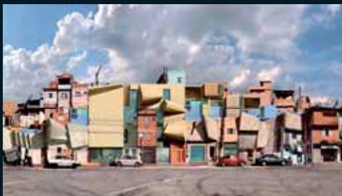
Obr. 183, Dionisio González, Nova Heliopolis II, 2007