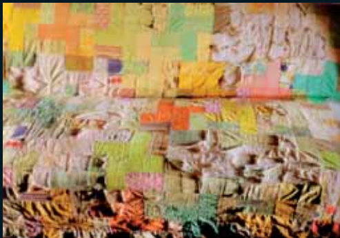
Obr. 136, Scott McFarland, Torn Quilt the Effects of Sunlight , 2003