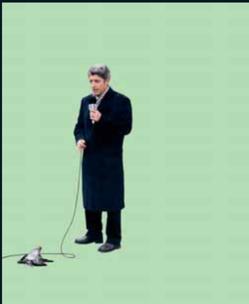
Obr. 57, Julia Peirone, Man with a microphone , 2002