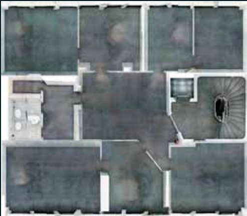
Obr. 141, Andreas Gefeller, Untitled (Office Floor) Düsseldorf, 2003