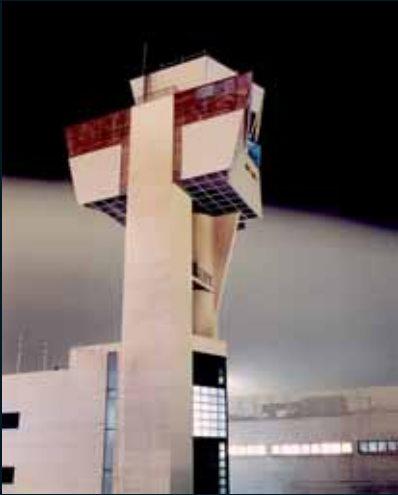
Obr. 139, Andreas Gefeller, Soma #020, 2000