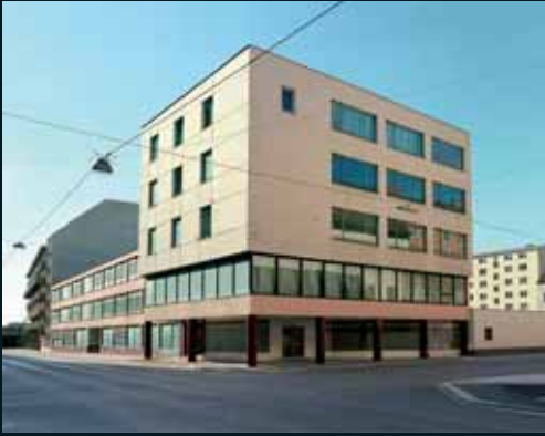
Obr. 175, Gregor Graf, Situation 1 (Linz), 2004