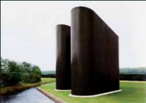
Obr. 171, Josef Schulz, Form #10, 2003