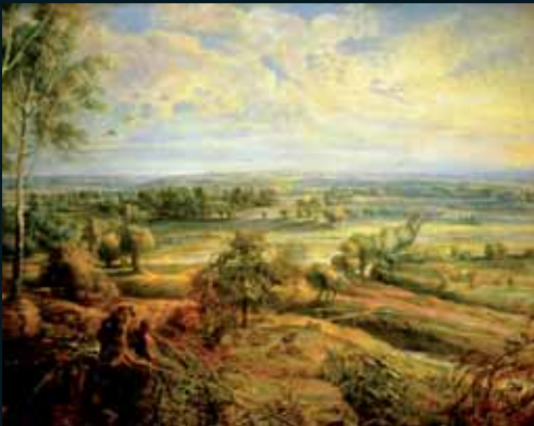
Obr. 158, Peter Paul Rubens, An Autumn Landscape with a view of Het Steen in the Early Morning , 1636