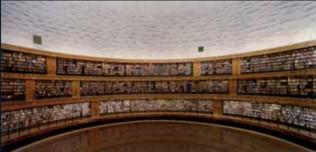
Obr. 82, Andreas Gursky, Stockholm Public Library, 1999