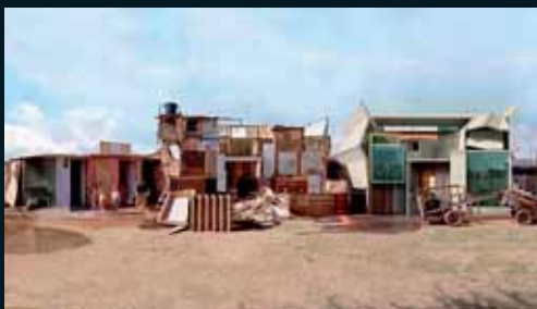
Obr. 185, Dionisio González, Marginal IV, 2006