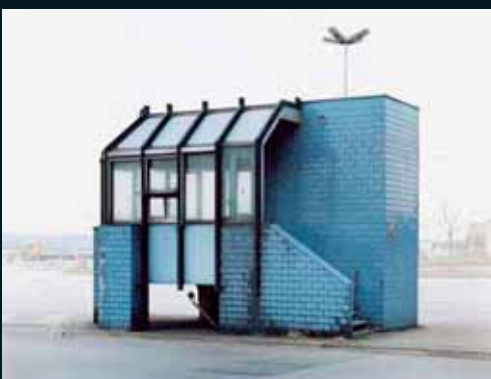
Obr. 173, Josef Schulz, Ze Souboru Übergang, 2005