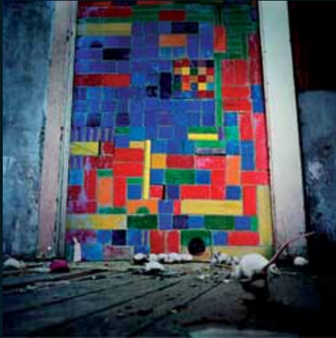
Obr. 36, Simen Johan, Ze souboru Evidence of Things Unseen , 2002–2003