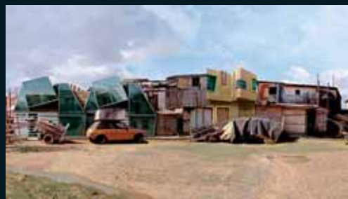
Obr. 186, Dionisio González, Marginal II, 2007