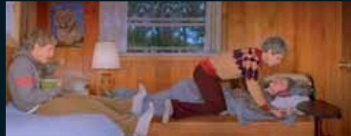
Obr. 108, Anthony Goicolea, Pit or Swallow , 1999