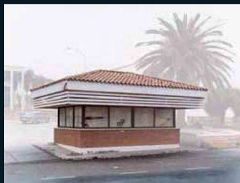
Obr. 174, Josef Schulz, Ze Souboru Übergang, 2005