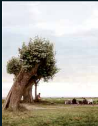
Obr. 152, Beate Gütschow, Untitled L.S.#13, 2001