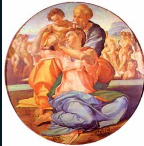
Obr. 23, Michelangelo, Tondo Doni, 1504