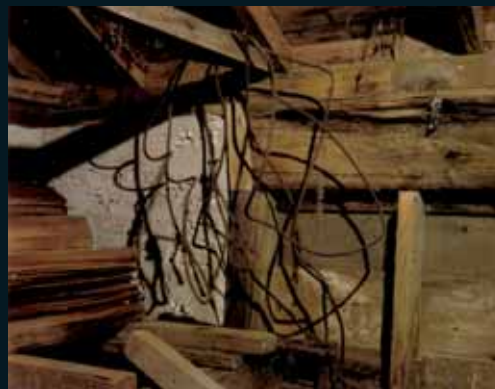
Obr. 135, Scott McFarland, Wrapped Wire , 2002