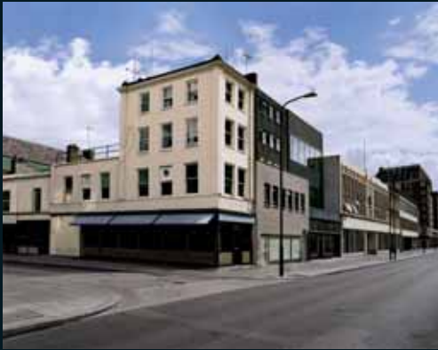
Obr. 178, Gregor Graf, Situation 10 (London), 2006