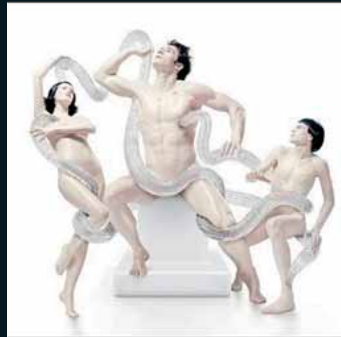
Obr. 64, Michael Najjar, Laokoon, 2006