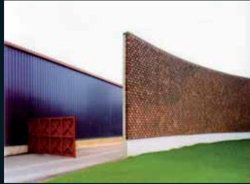
Obr. 170, Josef Schulz, Rot-blau, 2004