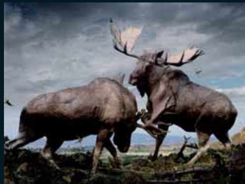
Obr. 39, Simen Johan, Ze souboru Until the Kingdom Comes , 2004–2006