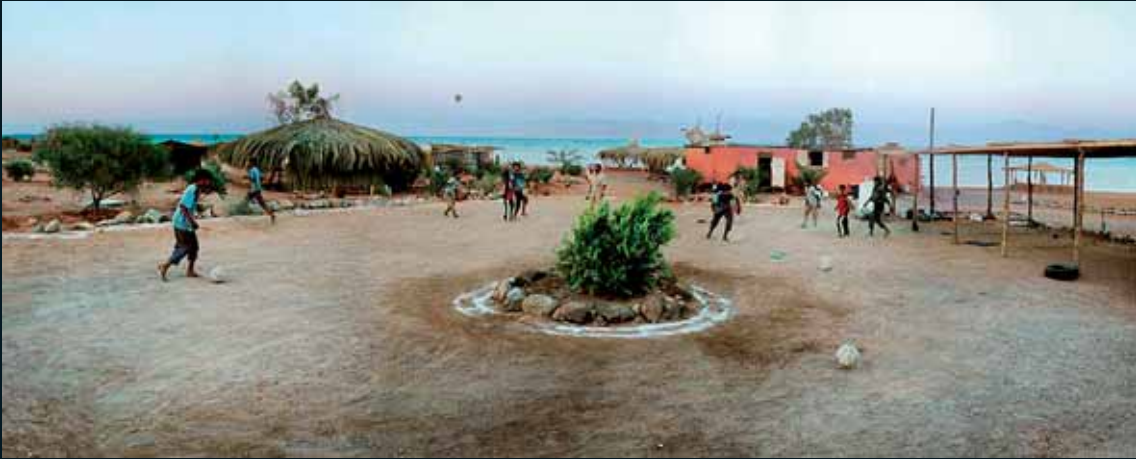
Obr. 77, Barry Frydlender, Moon, 2004