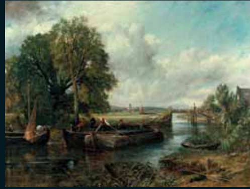
Obr. 150, John Constable, View on the Stour Near Dedham, 1822