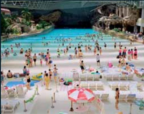
Obr. 89, Doug Hall, Wild Blue Yokohama, 2000