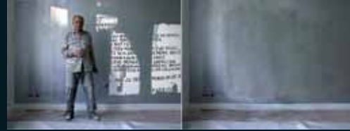
Obr. 62, Michael Najjar, Ze souboru No Memory Access, 2001