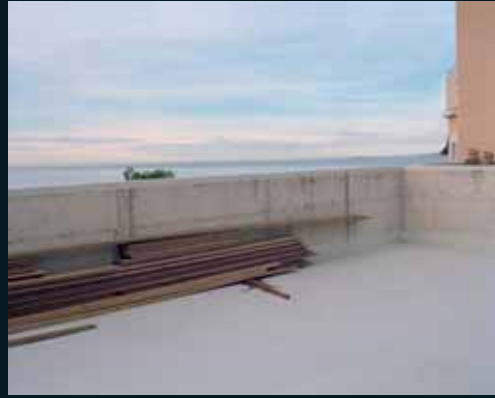
Obr. 119, Mathieu Bernard-Reymond, Disparitions #15, 2001