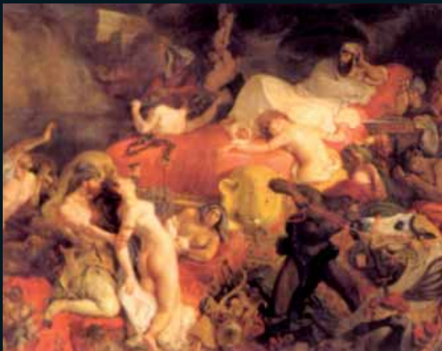
Obr. 68, Eugene Delacroix, La Mort de Sardanapale , 1827