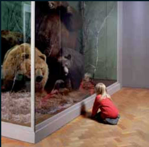
Obr. 29, Wendy McMurdo, Girl with Bears , 1999