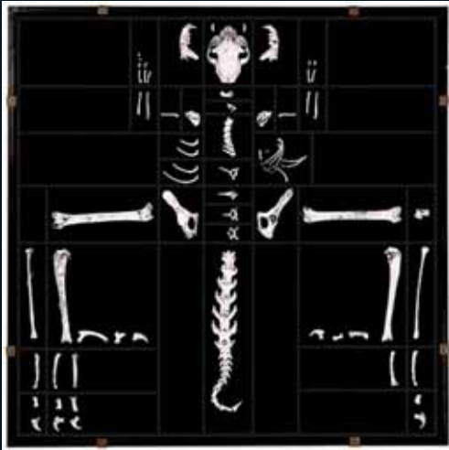
Obr. 123, Ilkka Halso, Evoldino, 1992