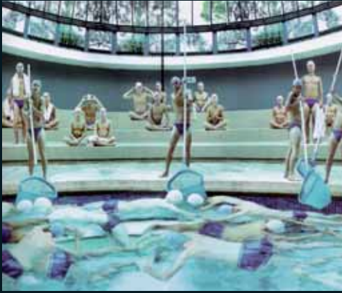
Obr. 115, Anthony Goicolea, Poolpushers , 2001