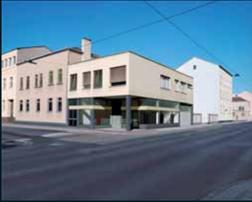
Obr. 176, Gregor Graf, Situation 3 (Linz), 2004