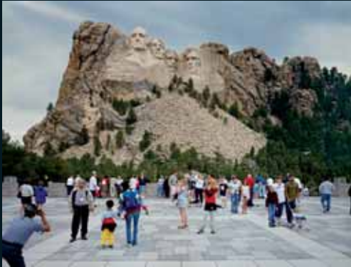
Obr. 87, Doug Hall, Mount Rushmore, 2004