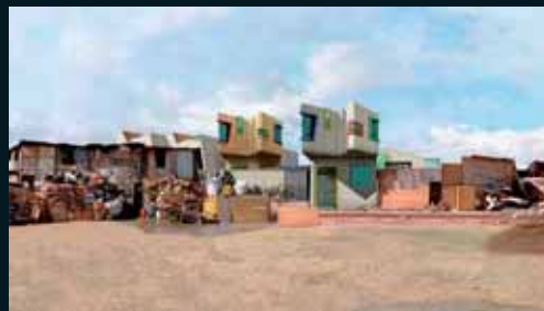
Obr. 184, Dionisio González, Marginal III, 2006