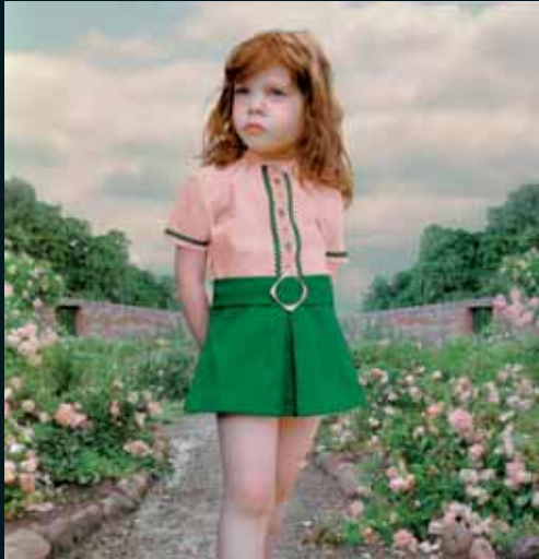
Obr. 16, Loretta Lux, The Rose Garden , 2001