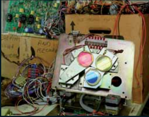
Obr. 131, Scott McFarland, Enlarger Parts with Light Source Reflected in Colour Filters , 2002