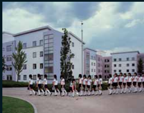
Obr. 105, Julia Fullerton-Batten, Ze souboru School play