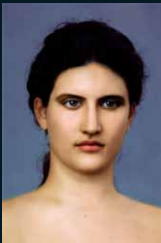
Obr. 8, LawickMüller, Athena Velletri (Nina), 1999