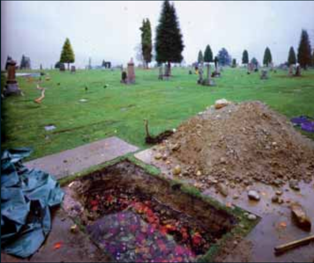
Obr. 74, Jeff Wall, The flooded grave , 1998–2000