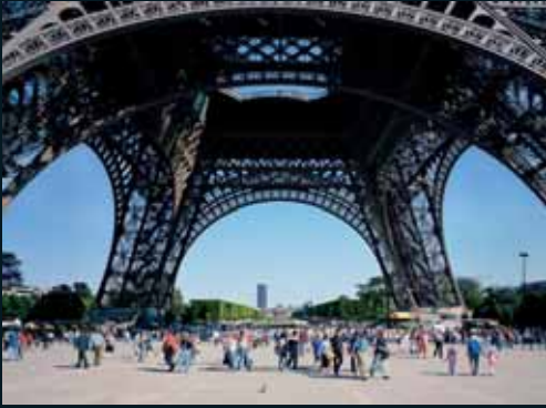
Obr. 84, Doug Hall, The Eiffel Tower, 2004