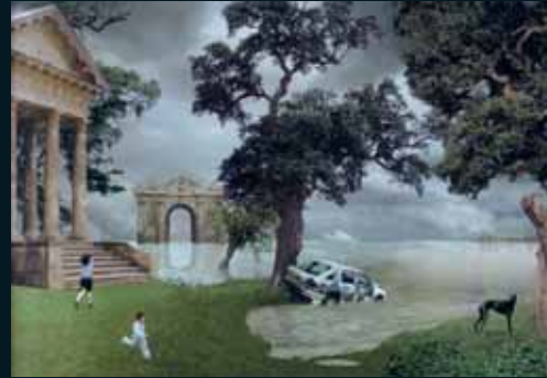
Obr. 165, John Goto, Deluge , 2000–2001