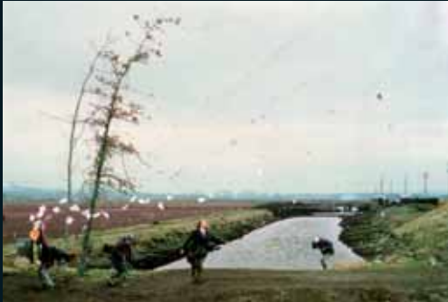
Obr. 72, Jeff Wall, A Sudden Gust of Wind (After Hokusai) , 1993