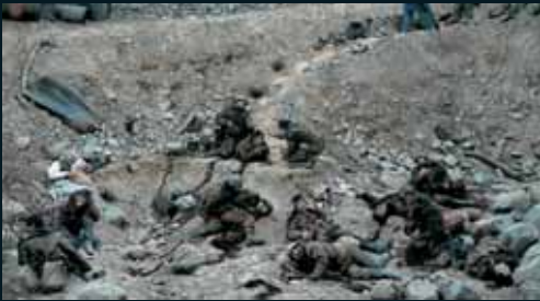
Obr. 69, Jeff Wall, Dead troops talk , 1992