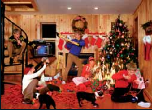
Obr. 107, Anthony Goicolea, Openfire , 1999