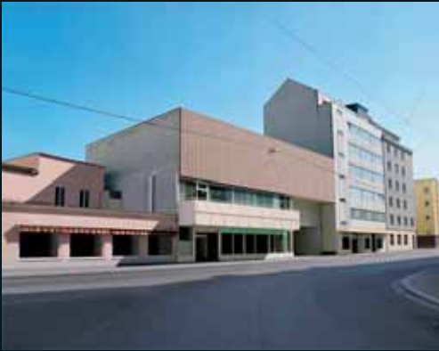
Obr. 177, Gregor Graf, Situation 4 (Linz), 2004