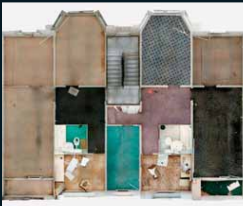
Obr. 145, Andreas Gefeller, Untitled (Panel Building 4) Berlin, 2004