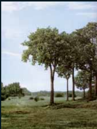
Obr. 151, Beate Gütschow, Untitled L.S.#16, 2002