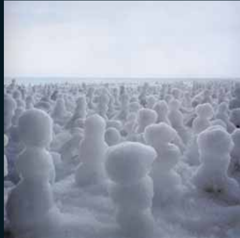
Obr. 37, Simen Johan, Ze souboru Evidence of Things Unseen , 2002–2003