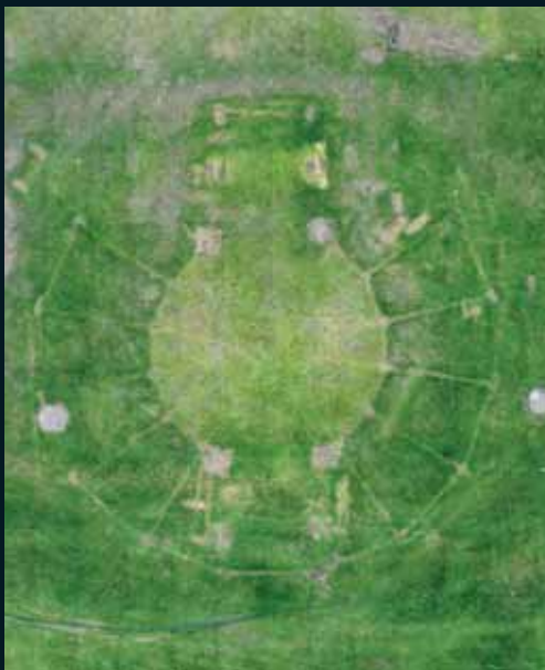
Obr. 147, Andreas Gefeller, Untitled (Meadow 1) Düsseldorf, 2002