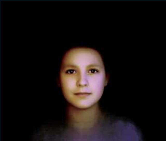
Obr. 5, Chris Dorley-Brown, Haverhill 2000, 2000