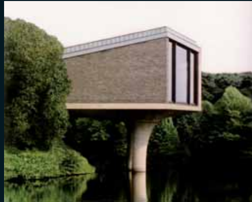
Obr. 172, Josef Schulz, Form #07, 2003