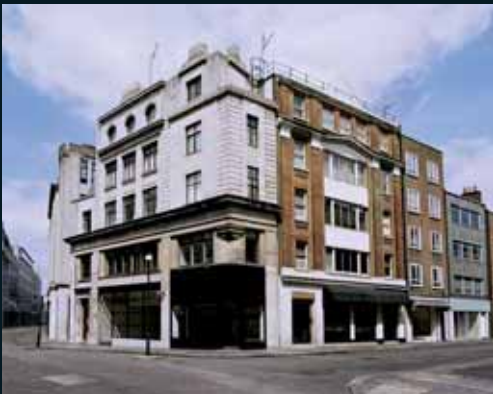
Obr. 179, Gregor Graf, Situation 12 (London), 2006