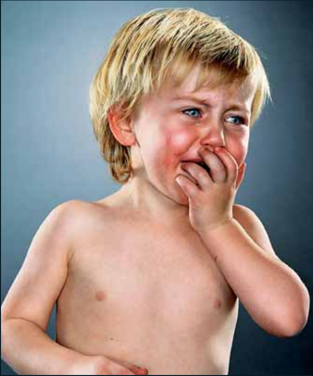
Obr. 42, Jill Greenberg, Four more years of Iraq , 2006