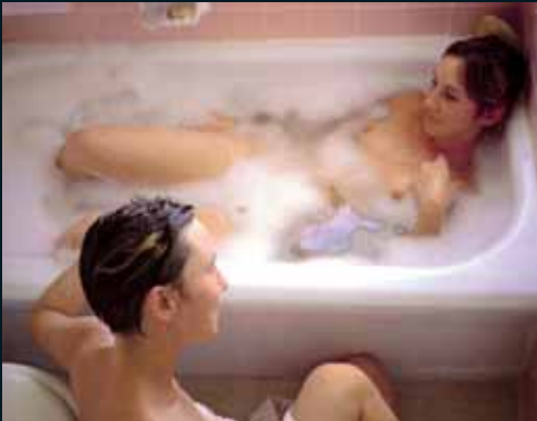
Obr. 94, Kelli Connell, Bubblebath , 2002