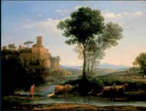
Obr. 149, Claude Lorrain, Landscape with the Voyage of Jacob, 1677