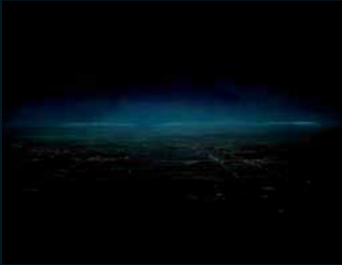
Obr. 138, Florian Maier-Aichen, Untitled, 2005