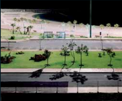
Obr. 140, Andreas Gefeller, Soma #006, 2000