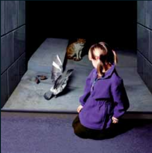
Obr. 28, Wendy McMurdo, Cat and Pigeon , 2000