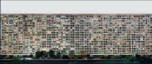
Obr. 80, Andreas Gursky, Montparnasse, 1993