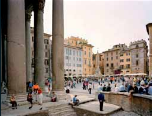
Obr. 86, Doug Hall, Piazza della Rotonda (Rome), 2002