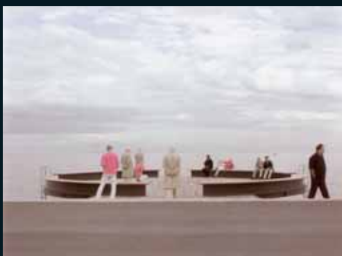
Obr. 121, Mathieu Bernard-Reymond, Intervalles #18, 2001