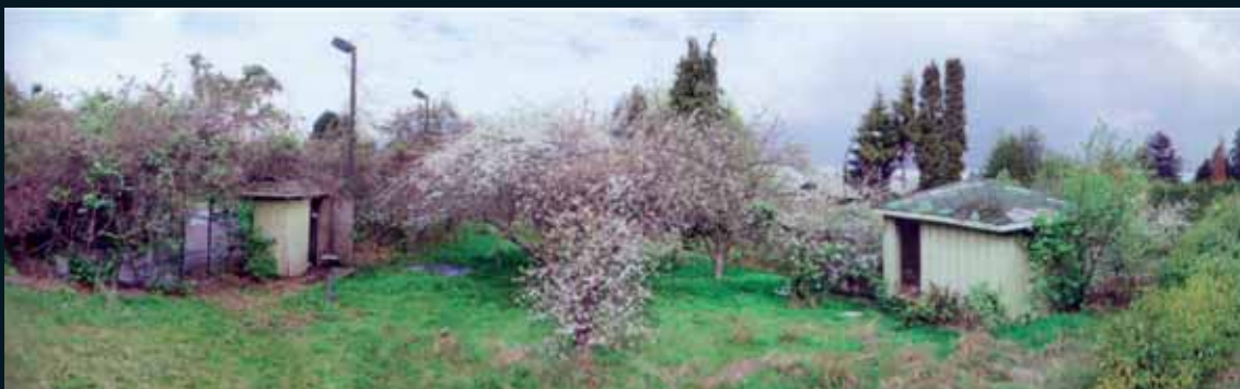
Obr. 134, Scott McFarland, Orchard View with the Effects of Seasons (Variation #2) , 2003–2006