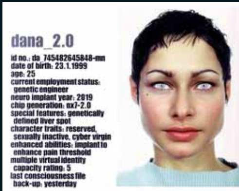
Obr. 61, Michael Najjar, Dana_2.0, 2000