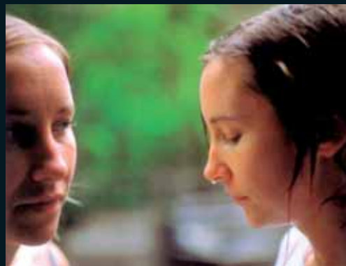
Obr. 97, Kelli Connell, The Space Between , 2002