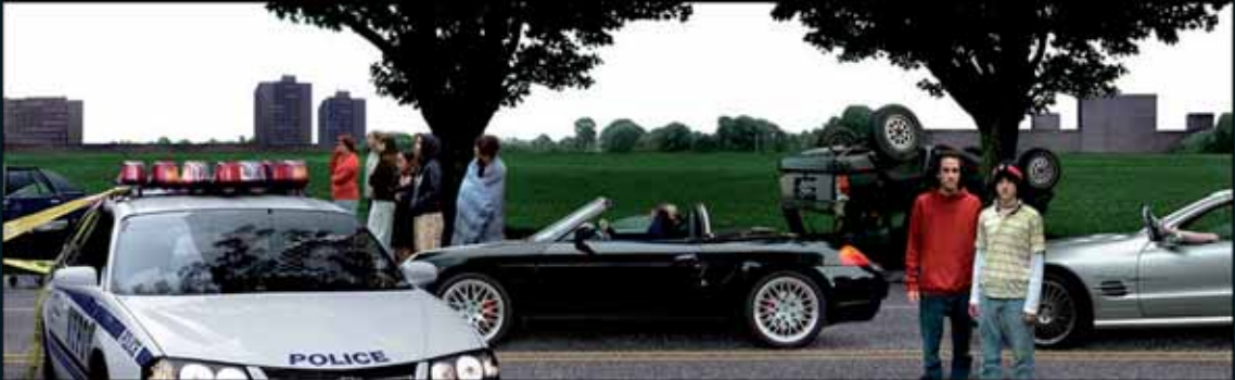
Obr. 54, Nancy Davenport, Stills from Weekend Campus DVD #1