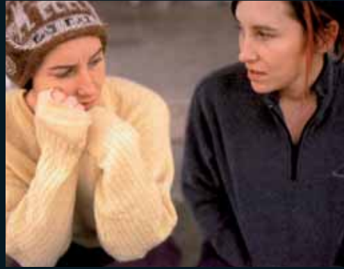
Obr. 93, Kelli Connell, The Conversation , 2002