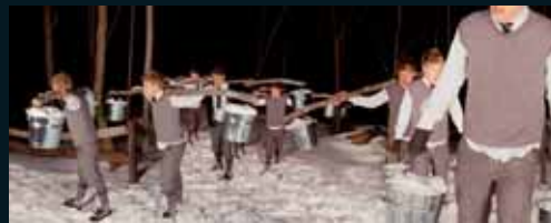
Obr. 111, Anthony Goicolea, After Dusk , 2001