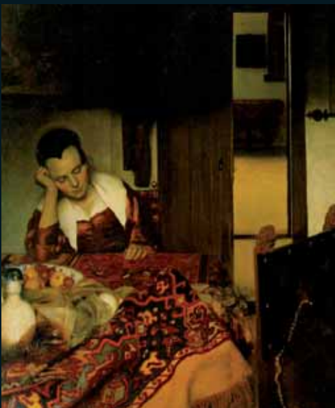
Obr. 48, Jan Vermeer van Delft, Girl Asleep at a Table , 1657