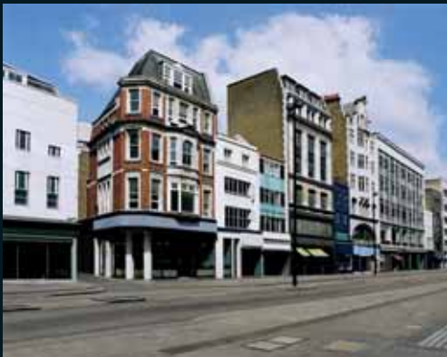
Obr. 180, Gregor Graf, Situation 9 (London), 2006