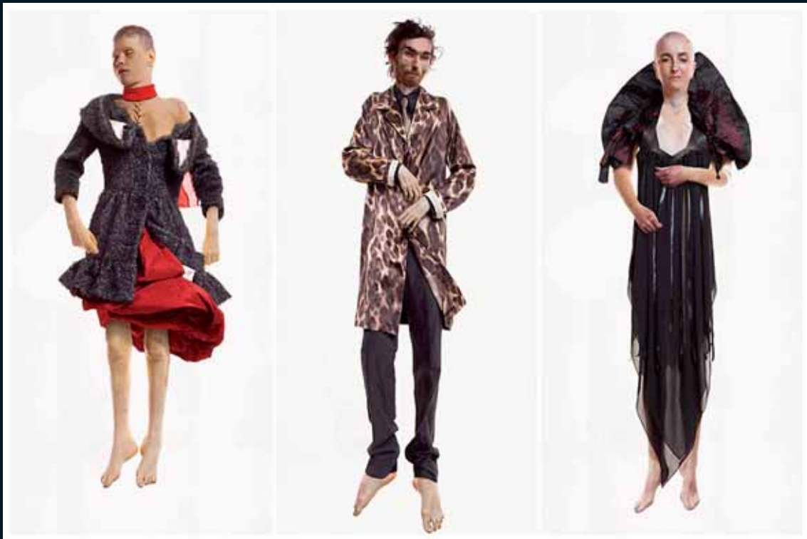
Obr. 24, AES+F, Ze souboru Defile, 2000–2007