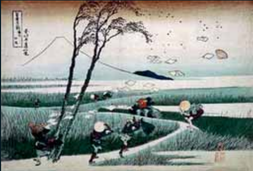
Obr. 71, Katsushika Hokusai, Caught by the Ejiri Wind , 1831–1833