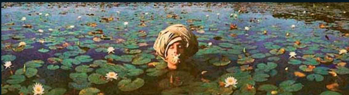
Obr. 168, Nicholas Kahn a Richard Selesnik, The Tale of the Sajikman and the Majasta Lily , 2001