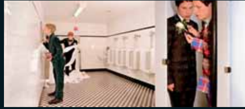
Obr. 106, Anthony Goicolea, Boy's Room , 2000