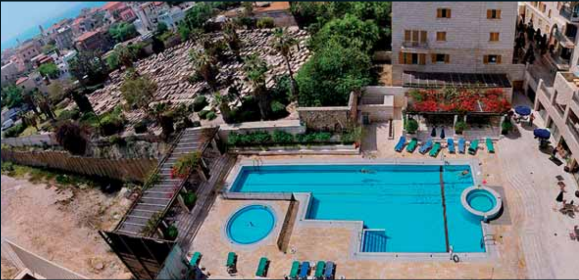
Obr. 79, Barry Frydlender, Estates, 2005