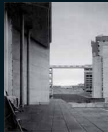
Obr. 155, Beate Gütschow, S #16, 2006