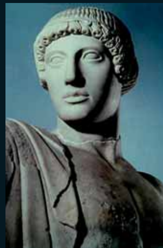
Obr. 10, Socha Apollona, Diáv Chrám v Olympii