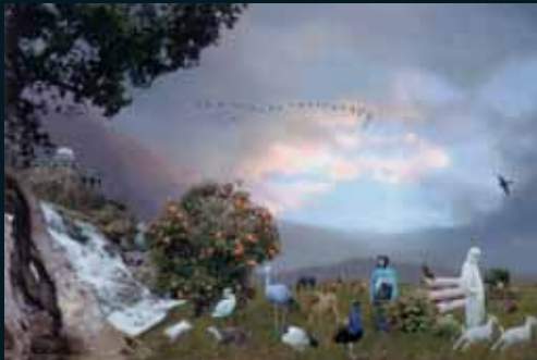
Obr. 166, John Goto, Pasturelands , 2000–2001