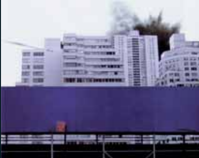
Obr. 52, Nancy Davenport, Bombardment, 2001