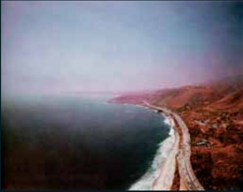
Obr. 137, Florian Maier-Aichen, Untitled, 2005