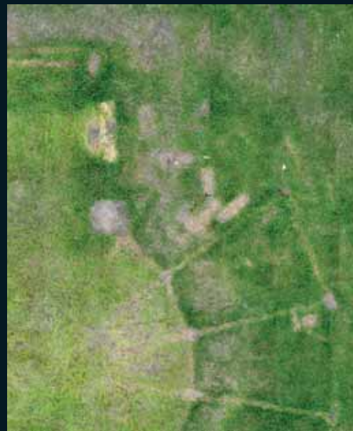
Obr. 148, Andreas Gefeller, Untitled (Meadow 1) Düsseldorf, detail, 2002