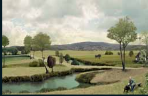
Obr. 157, Marc Baruth, Sunset , 2005