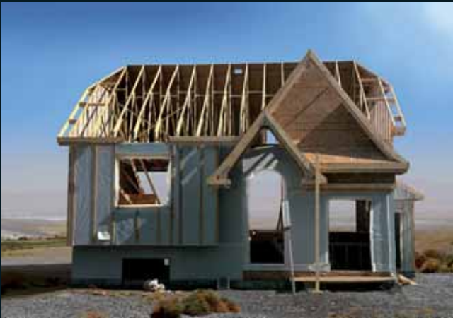
Obr. 189, Isabelle Hayeur, Ellen, 2005