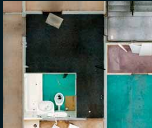
Obr. 146, Andreas Gefeller, Untitled (Panel Building 4) Berlin, detail, 2004