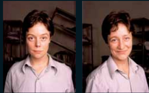
Obr. 7, Vibeke Tandberg, Faces #1 a #6, 1998