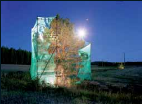
Obr. 126, Ilkka Halso, Ze souboru Restoration, 2000