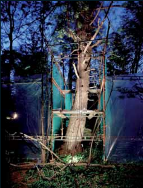
Obr. 125, Ilkka Halso, Ze souboru Restoration, 2000