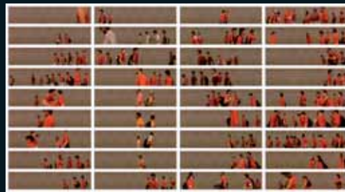
Obr. 58, Pablo Zuleta Zahr, Chilean Men in Red , 2004