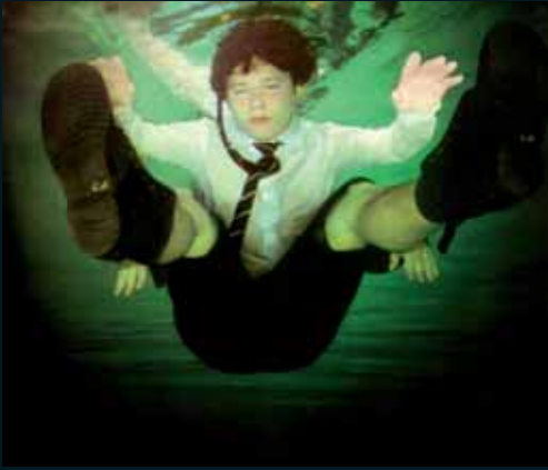
Obr. 114, Anthony Goicolea, Under 2 , 2001