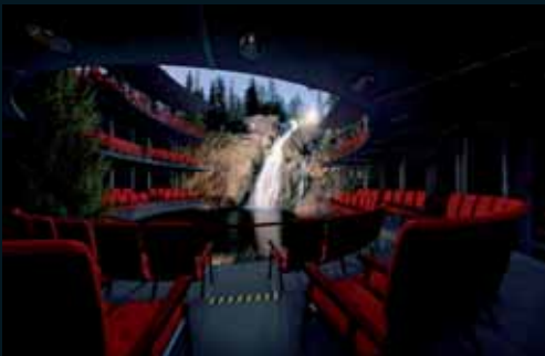
Obr. 129, Ilkka Halso, Theatre I, 2004