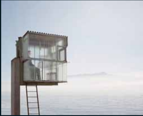
Obr. 118, Mathieu Bernard-Reymond, Disparitions #89, 2005