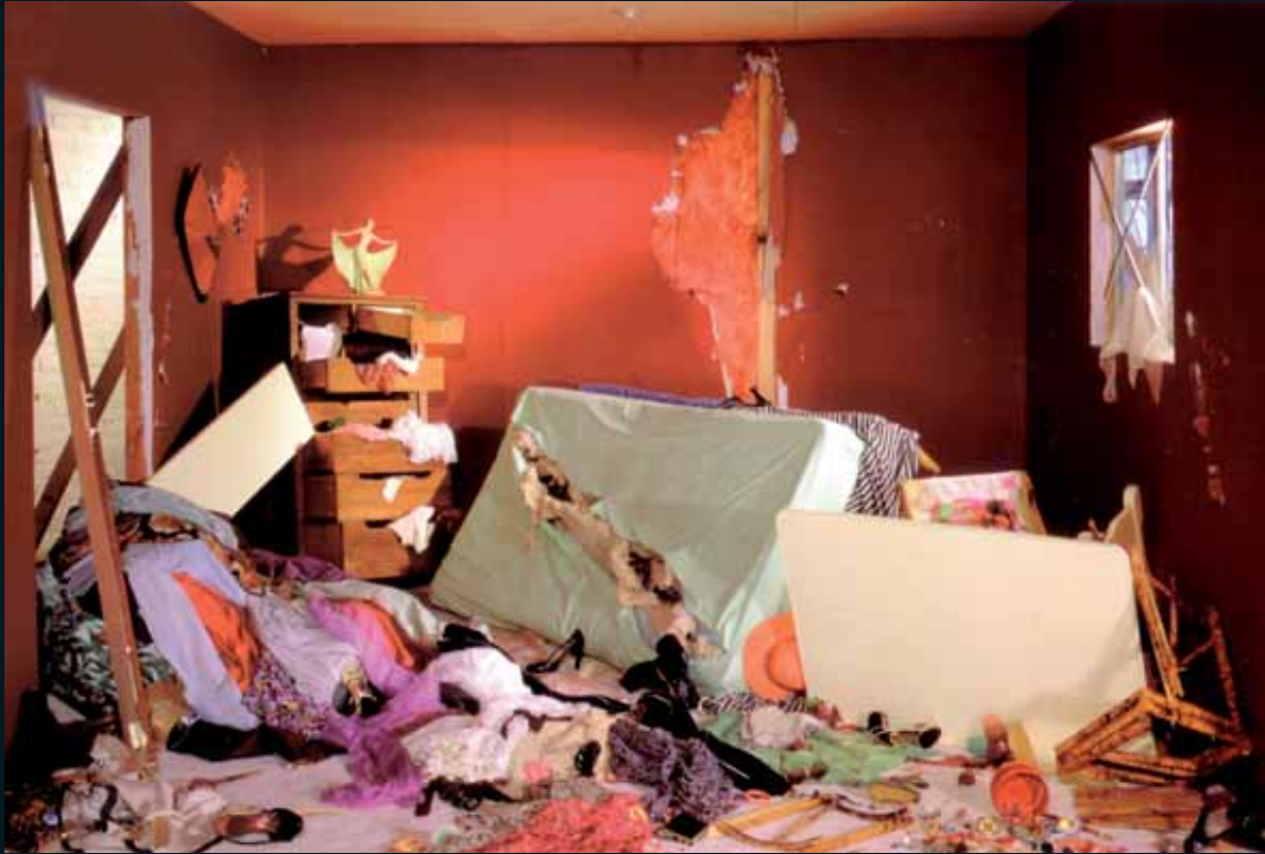
Obr. 67, Jeff Wall, The Destroyed Room , 1978