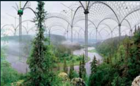
Obr. 128, Ilkka Halso, Kitka river, 2004