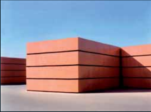
Obr. 169, Josef Schulz, Ziegel, 2003