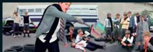
Obr. 113, Anthony Goicolea, Canibal , 2001