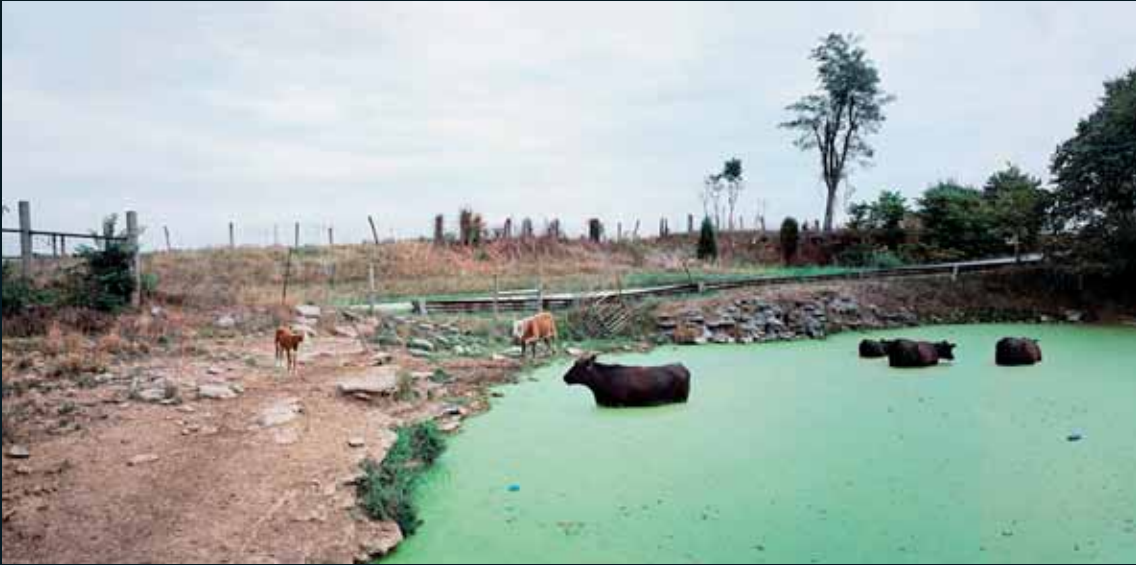
Obr. 190, Thomas Bangsted, Watering Place, 2005