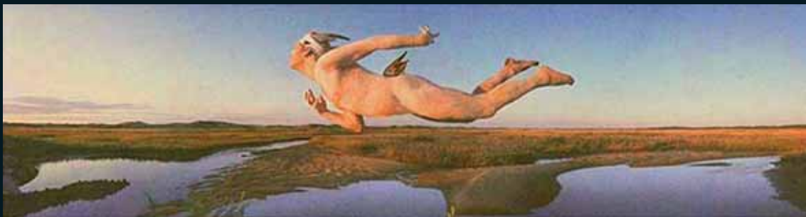
Obr. 167, Nicholas Kahn a Richard Selesnik, On the Edge of the Marshes , 2001