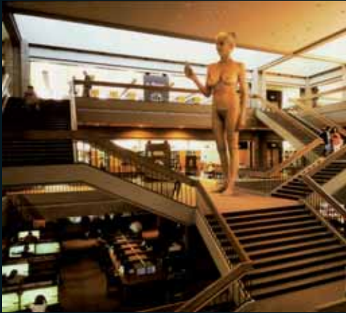
Obr. 70, Jeff Wall, The Giant , 1992