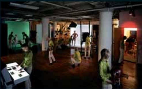
Obr. 100, Nathan Baker, Photo Studio, 2004