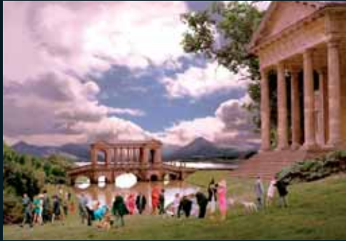
Obr. 164, John Goto, Society , 2000–2001