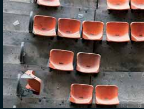
Obr. 144, Andreas Gefeller, Untitled (Stadium) Düsseldorf, detail, 2002