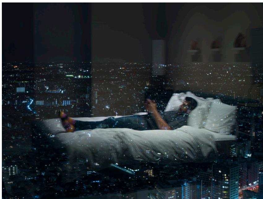
Alec Soth / autoportret

Americký fotograf narozený v roce 1969 v Minneapolisu ve státě Minnesota. Aktuálně žije tamtéž. Absolvoval Sarah Lawrence College v Bronxville ve státě New York. Je členem prestižní fotografické agentury Magnum. Doposud se zúčastnil více než 50 individuálních výstav, počínaje od roku 2003, např. Jeu de Paume (Paříž, Francie) 2008, Museum of Modern Art, Walker Art Center (Minneapolis, MN) 2010, Hayama (Hayama, Japonsko) 2022. Obdržel mnoho cen a stipendií, např. McKnight Photography Fellowship, 1999, DeutscheBörse Photography Prize, 2006 (finalista), Guggenheim Fellowship, 2013. 4