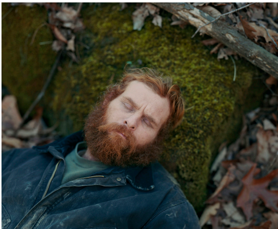
Alec Soth / Broken Manual

V projektu „Broken Manual“ Alec Soth prozkoumává provinční Ameriku a dává přitom hlas občanům žijícím na společenském okraji. Velice důkladně a promyšleně