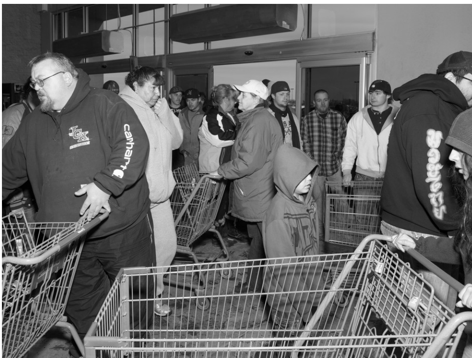
Alec Soth / Songbook

Eugène Ionesco v knize „Songbook“ napsal: „Nejpravdivější společnost, autentické lidské společenství, je nesociální – jde o širší, hlubší společenství, které odhaluje naše společné obavy, naše touhy, naše skryté nostalgie. Celou historii světa ovládaly nostalgie a neklid, které politické jednání odráží a interpretuje pouze velice nedokonale. [...]“ 8