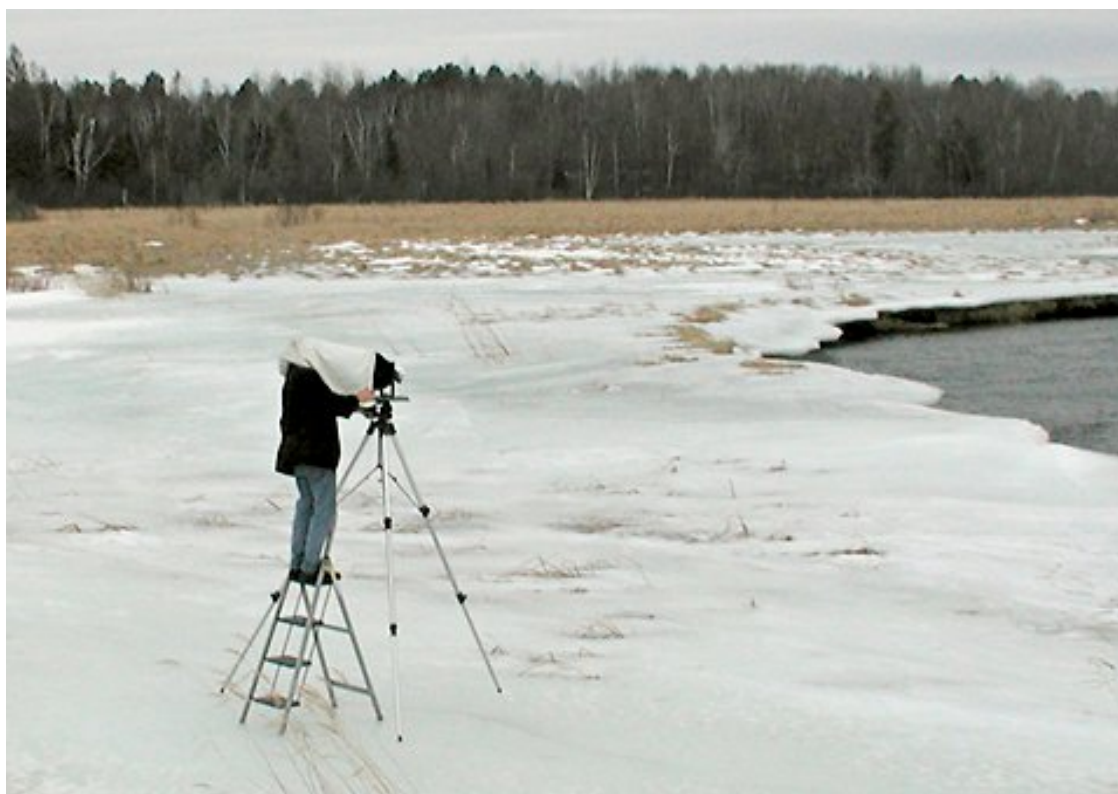
Alec Soth w trakcie wykonywania zdjęcia aparatem wielkoformatowym 8x10

s velkoformátovým analogovým fotoaparátem 8x10, což silně určuje způsob jeho práce. Není tu prostor pro spěch, rychlé snímky dělané někdy v mezičase. Každý záběr je důkladně promyšlený a připravený. Bez významu samozřejmě nezůstává ani vizuální efekt, který přináší velkoformátový fotoaparát: „V případě fotoaparátu 8x10 se vyskytuje jistý druh krémovitosti. Něco je také na dojmech ze sledování. Dívání se přes velkou matnici fotoaparátu 8x10 je velice smyslný akt. Obzvláště u portrétů je něco, co tvoří hloubku ostrosti. Je to jako sochání objektu z prostoru. Výzvou pro mě byla ambice spojit tok proudu vědomí s precizností a formálností velkoformátových fotografií.“ 11