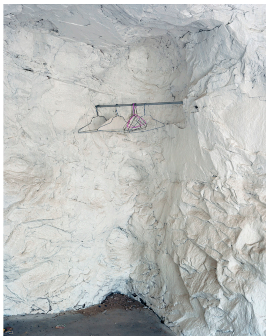
Alec Soth / Broken Manual