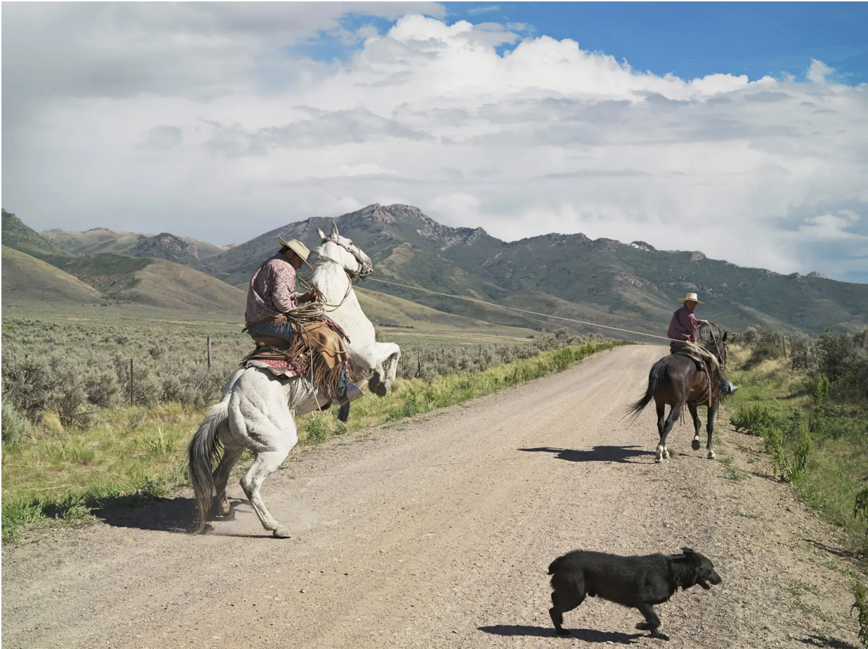
Lucas Foglia / Frontcountry

Ve svém zájmu o divoký životní styl pokračoval v následujícím projektu nazvaném „Frontcountry“. V něm změnil směr svých cest a cílovou skupinu, kterou fotografuje. Pustil se do tématu kovbojů z amerického západu. Prohlíží si oblast tváří tvář velkým ekonomickým změnám. Vypravil se do jedněch z nejméně osídlených oblastí ve Spojených státech. 16