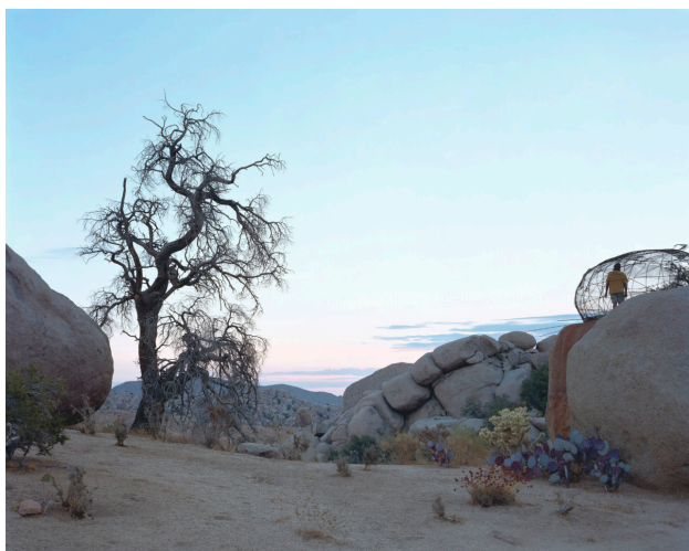
Alec Soth / Broken Manual

Práce působí dojmem „Manuálu pro zlomené lidi“ jak přežít v divočině, být nezávislý a soběstačný. Lidé na snímcích jsou duchovní, uprchlíci, bývalí vojáci, polopoustevníci. Představuje je v jejich přirozeném prostředí – v jeskyních, stanech, provizorních chatách a občas i ve zděných enklávách.