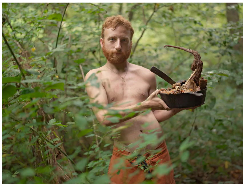
Lucas Foglia / A Natural Order

Jako člověk, který sám vyrůstal v podobných podmínkách, kráčí Foglia ve svém projektu po mu blízkých cestách. Na snímcích vidíme krásnou krajinu a mnoho o nic méně krásných portrétů. Obálku knihy zdobí fotografie muže s velkou mísou masa, které si nekoupil v supermarketu, ani mu nebylo naservírováno v restauraci. Sám ho ulovil.