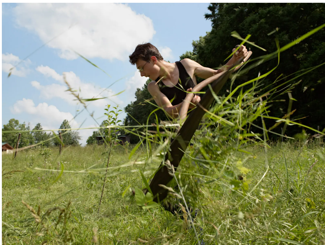
Lucas Foglia / A Natural Order

Toto zázemí inspirovalo Lucase Fogliu, aby se po 20 letech již z pozice pozorného pozorovatele podíval na to, jak ve Spojených státech vypadá vztah člověka se zemí, přírodou a co, v době práce na projektu, znamená divokost a soběstačnost. V letech