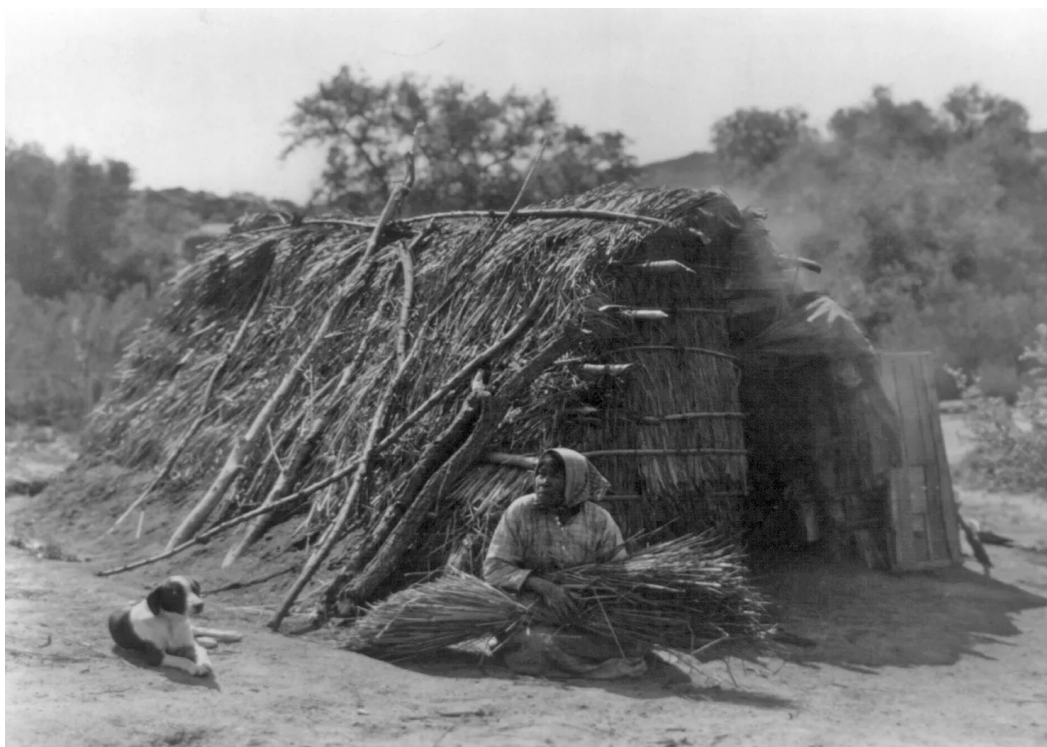
Edward S. Curtis / Kobieta Diegueño przed domem w Campo w Kalifornii, ok. 1924 r.

Ve 30. letech 20. století se americká dokumentární fotografka Dorothea Lange věnovala podávání zpráv o dopadech velké hospodářské krize ve Spojených státech.