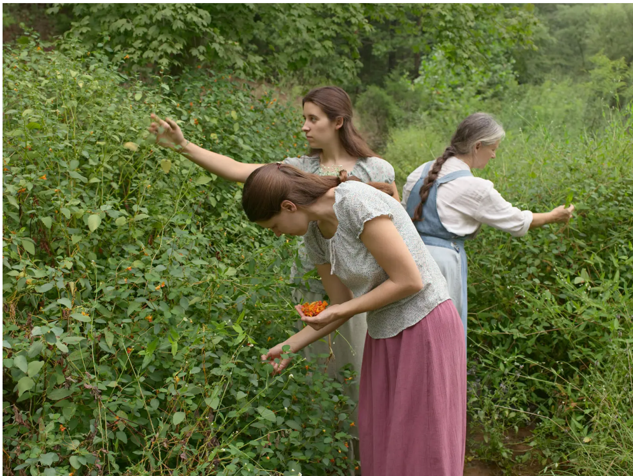
Lucas Foglia / A Natural Order

Kromě toho dospívám k závěru, že soběstačnost, o níž se Foglia často zmiňuje jako o cíli svých hrdinů, je stav vyžadující těžkou práci, vědomosti a obětování se.