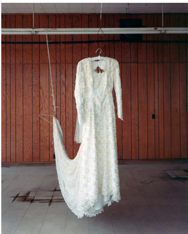
Alec Soth / Niagara

Dalším, po celém světě uznávaným projektem Aleca Sotha je „Niagara“. Tentokrát pokračuje ve vyprávění o lidských citech prostřednictvím jiné vodní plochy. Sám autor říká: „Jel jsem k Niagare ze stejného důvodu, jako novomanželé a skokani-sebevrazi“, „neustálý hřmot vodopádu prostě vyžaduje velkou vášeň“.