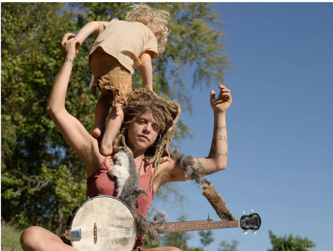
Lucas Foglia / A Natural Order

V „A Natural Order“ si také můžeme povšimnout velmi vysokého angažování a důkladného ponoření se do navštívené a fotografované komunity. Mnoho intimních snímků naznačuje navázání blízkého vztahu založeného na důvěře. Odnášíme si správný dojem, že Lucas Foglia už měl někdy co do činění se životem v malé komunitě, kde chybí ploty, odstup a nedůvěra.