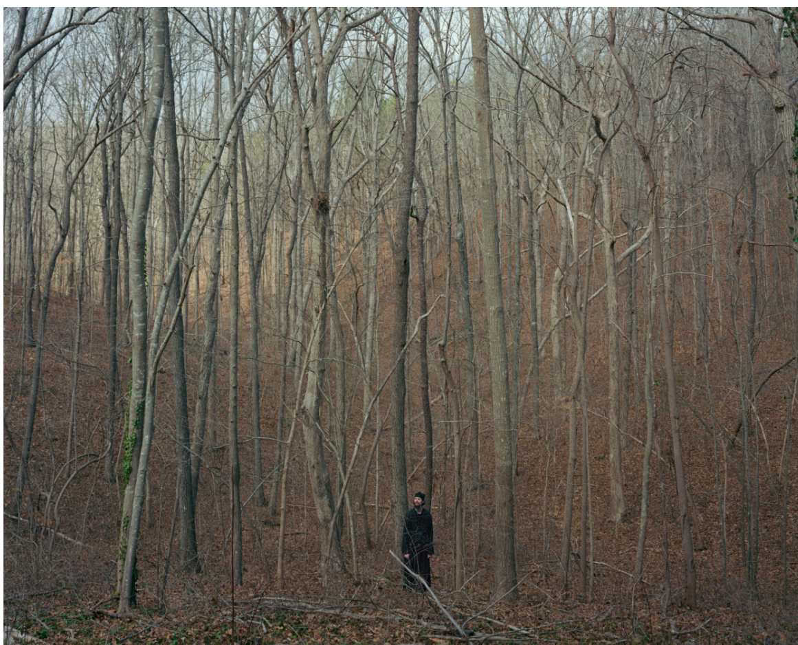
Alec Soth / Broken Manual

Aleca Sotha při tvorbě práce „Broken Manual“ inspirovaly především dvě osobnosti. První z nich je Thomas Merton (otec Ludvík), americký spisovatel, básník, katolický kněz a, což je nejdůležitější, trapista. Trapista je řeholník, člen řádu cisterciáků přísné observance. Tento řád předpokládá dodržování přísných pravidel – naprosté izolace od světa, klauzule mlčení, postů, oddání se modlitbě a tělesné práci. Thomas Merton v tomto řádu strávil téměř tři poslední desetiletí svého života. Druhou osobou, jejíž život Soth studoval při přípravě na „Broken Manual“, byl Eric Rudolph, konkrétně poslední období jeho života na svobodě. Rudolph je americký atentátník-terorista, který se po několik let skrýval před spravedlností v Appalačském pohoří v Severní Karolíně. Dopadení Erica Rudolpha ztěžovaly především jeho dobré znalosti umění survivalu. 9