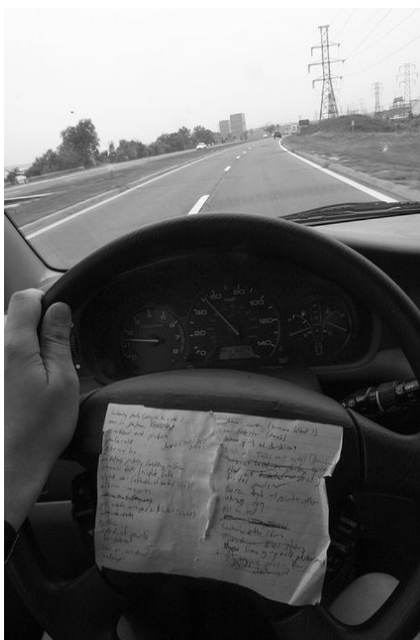
Alec Soth / Lista na kierownicy

státech při hledání těch, kdo nechtějí být nalezeni. Cestoval např. na místa v Severní Karolíně, kde se skrýval atentátník Eric Rudolph, a do kláštera, kde pobýval v ústraní Thomas Merton. Na začátku má určité adresy, body na mapě, jména, ale pak, což není ojedinělým případem, už je veden od jednoho hrdiny ke druhému. Na lístečku přilepeném na volantu svého auta má hesla, kterými se chce řídit a hledat je: „vousy, pozorovatelé ptáků, houbaři, pánské exercicie, po dešti, postavy zezadu, zavazadla, vysocí lidé (především hubení), štíty, stany, domky na stromě a stromořadí“. 10