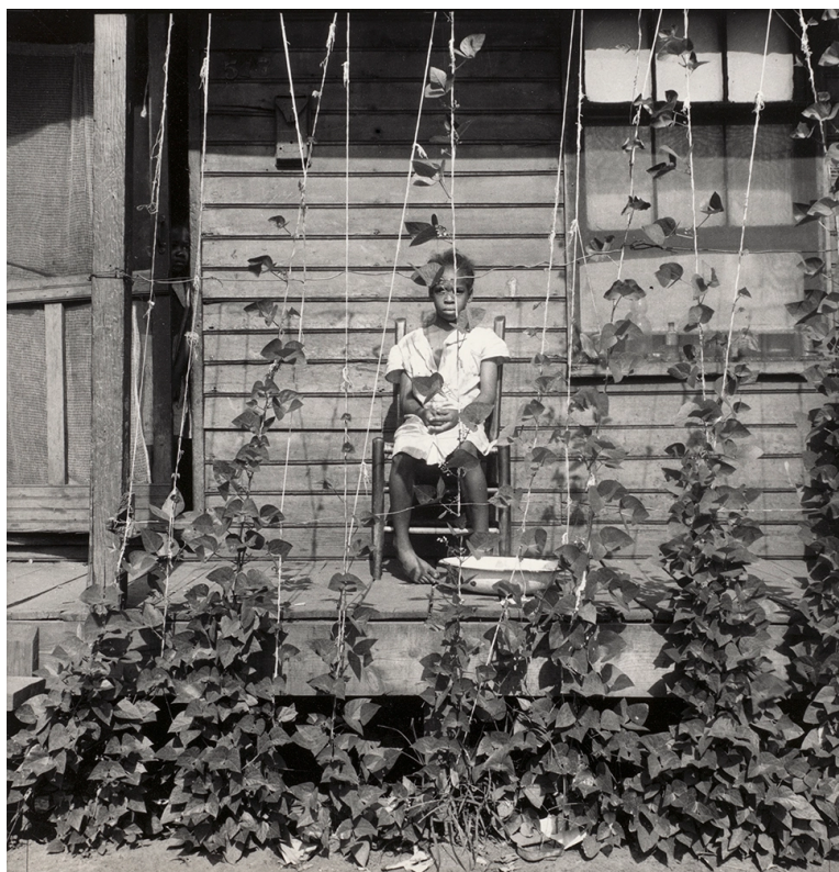
Dorothea Lange / Tennessee, 1938

Ve 30. letech 20. století se americká dokumentární fotografka Dorothea Lange věnovala podávání zpráv o dopadech velké hospodářské krize ve Spojených státech.