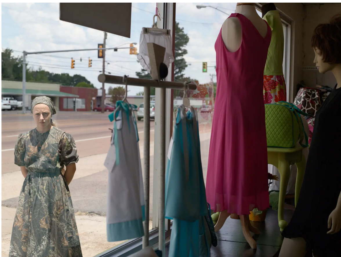
Lucas Foglia / A Natural Order

Projekty, na nichž pracoval Lucas Foglia, se soustředí na interakci lidí, přírody a kultury. V počátečních letech své tvorby se zaměřoval především na alternativně žijící komunity.