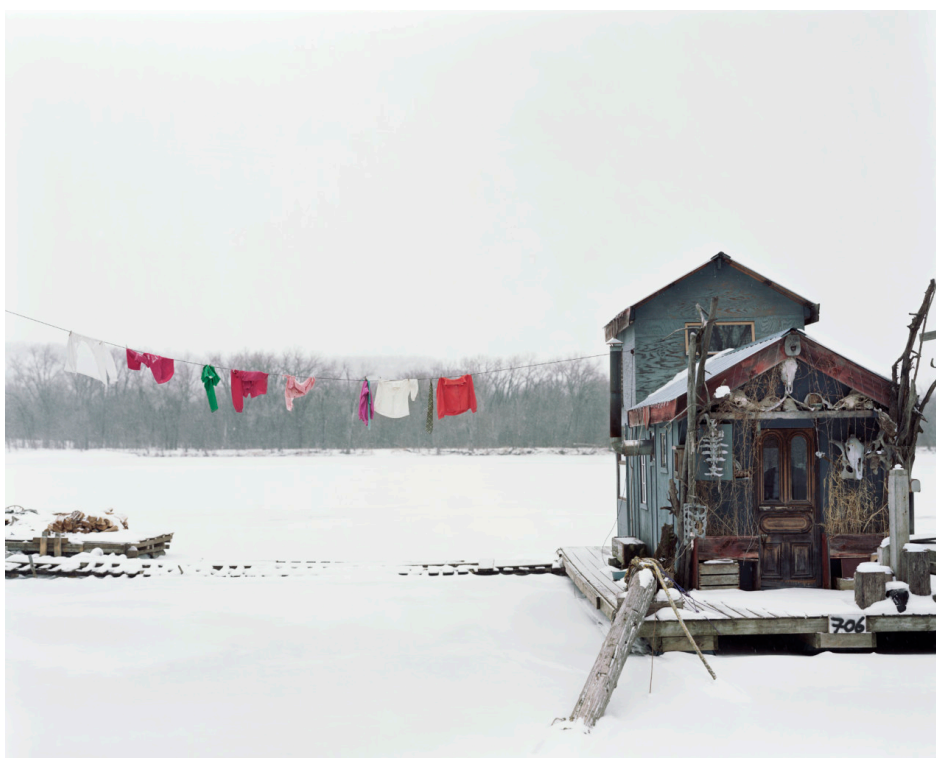
Alec Soth / Sleeping by the Mississippi

V „Sleeping by the Mississippi“ se Soth soustředil na lidi, s nimiž se setkal během své cesty podél druhé nejdelší řeky v Severní Americe.