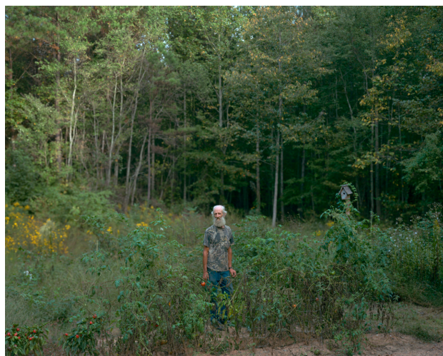
Alec Soth / Broken Manual

Někteří pózují na pozadí dominantní divoké přírody, ale neodnášíme si z toho dojem, že by tam žili odjakživa. Většina fotografií silně upozorňuje na civilizaci, z níž Sothovy hrdinové pocházejí.