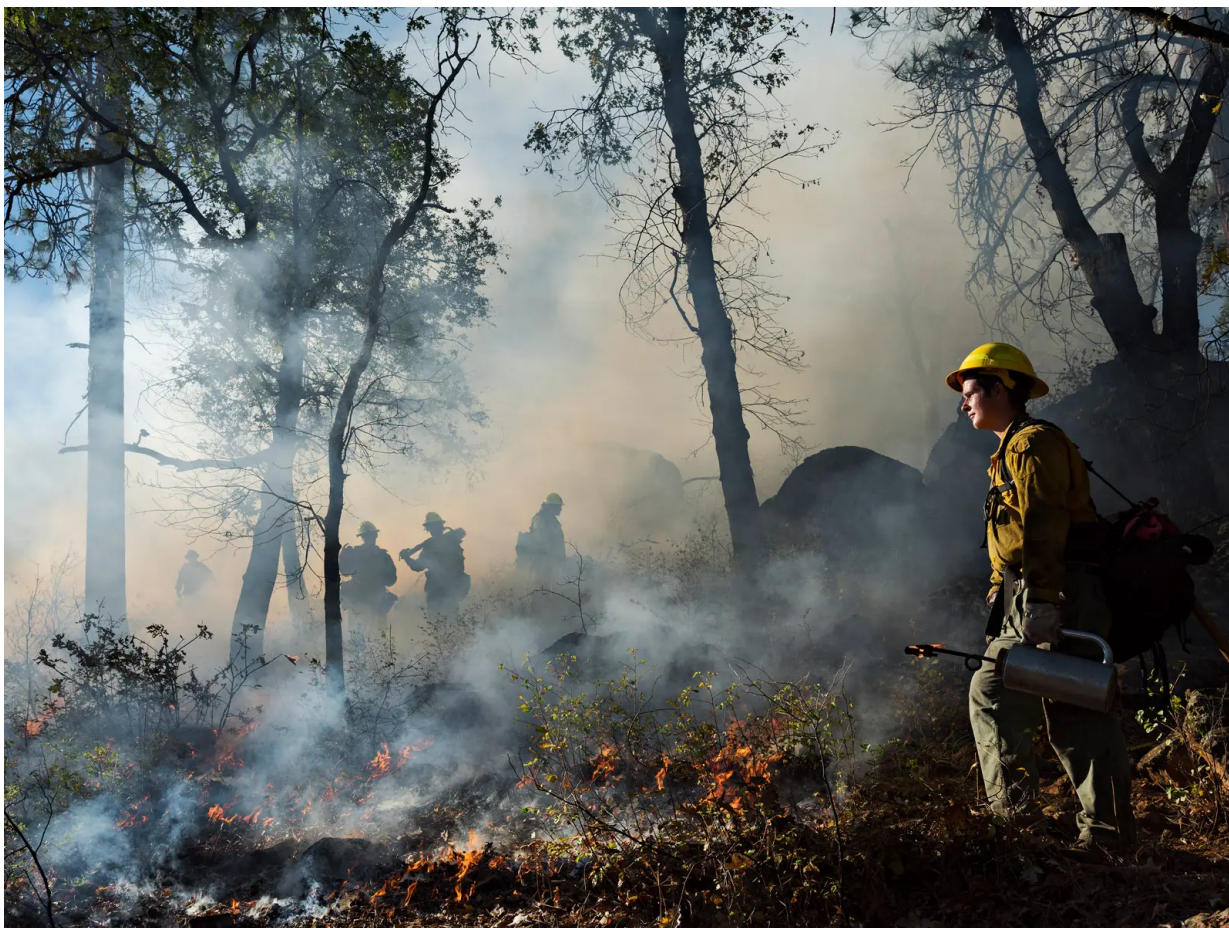
Lucas Foglia / Human Nature

Posledním projektem, který stejně jako ty předchozí vyšel ve formě fotografické knihy, je „Summer After“. Jde o cyklus monochromatických portrétů pořízených v New Yorku, kde autor evokuje své dojmy z města těsně po útocích z 11. září.