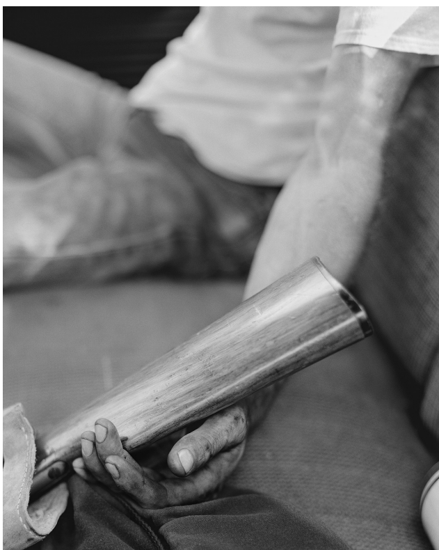
Matthew Genitempo / Jasper

Poetická úprava snímků dává tušit, že si z krajin, poloplánů nebo detailů můžeme pouze domýšlet skutečnosti ze života mužů, které vidíme na portrétech.