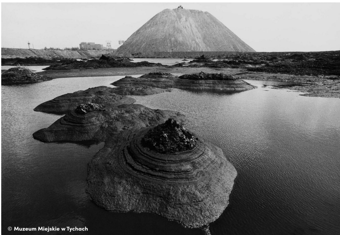
osada a halda uhelného dolu „1. máje“, Wodzisław Śląski

Jejich práce se staly dokladem života ve světě bez modré oblohy, bez čisté vody v řece, rybníku či jezerech. V sociologickém rozměru skupina KRON dokumentovala také společenský vývoj regionu. Jejich cílem nebylo ukazovat pro tu dobu typické „vzory práce“, ale autentický každodenní život společnosti Horního Slezska. Činnost skupiny byla přerušena výjimečným stavem a internací vůdců (mj. Wielomského a Klubyho).