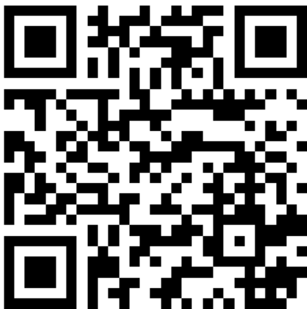
QR kód, který přesměruje na profil Tomáše Liboski na Instagramu

Z pohledu Tomáše Libosky se jeho Instagram stal především náčrtem. Místem, kde může experimentovat s formou fotografií. Stojí za zmínku, že začátek publikování cyklu „Odwrót“ se odehrál přesně v tom samém roce, v němž autor zahájil sérii příspěvků na Instagramu, tedy v roce 2016. V prvních letech byly publikované fotografie výhradně ve formátu čtverce, avšak s postupem let a vývojem Instagramu 25 začaly příspěvky na této sociální platformě měnit své proporce.