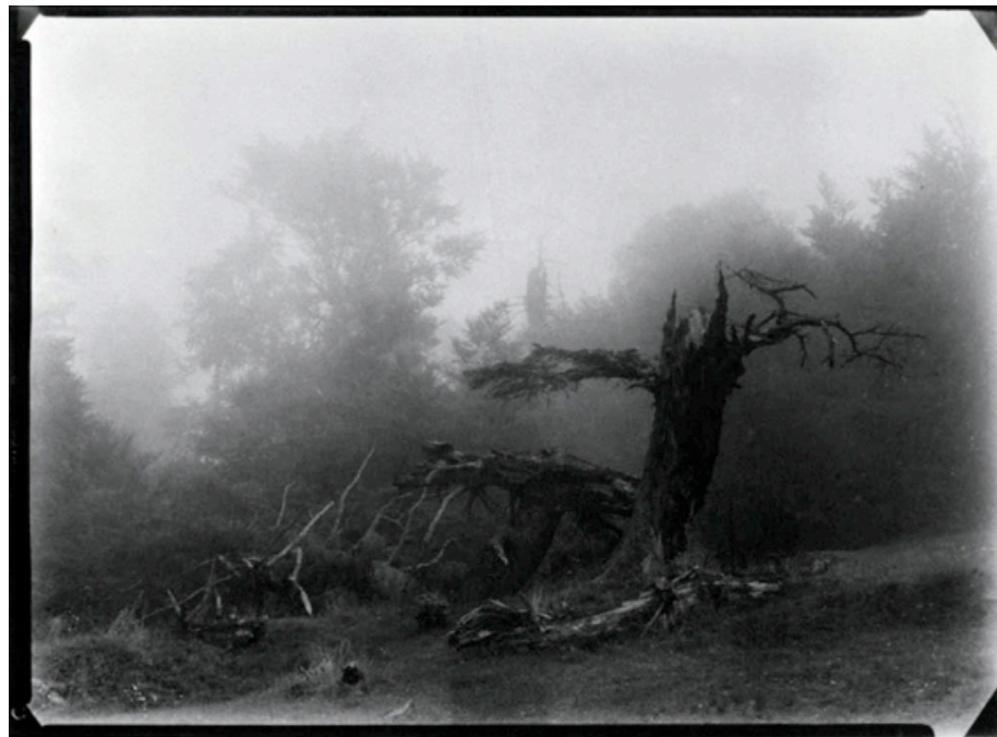
Josef Sudek: Zmizelé sochy

Sudkovu práci na tomto souboru z pralesa v Mionší přibližuje i básník Jaroslav Seifert. „Byli jsme se Sudkem v Beskydech... Sudek se náhle zastavil a povídá: ‚Halt, hudba hraje!‘ Zavolal na mě, abych mu podal stativ. Aparát si nosil sám a nedal jej z ruky. Zabodl stativ do mechu a pozorně si prohlížel ramenatý načervenalý kořen borovice, který jsem já minul bez povšimnutí. Stál nad ním, pak poodstoupil a opět se vrátil k aparátu. Kořeny svíraly rozdrčený balvan jako v náruči. Když jsem později v Praze spatřil u Sudků tento obrázek, nevěřil jsem očím. Kořen byl na snímku krásný jako socha Michelangelova! A pak že není fotografie uměním.“ 26