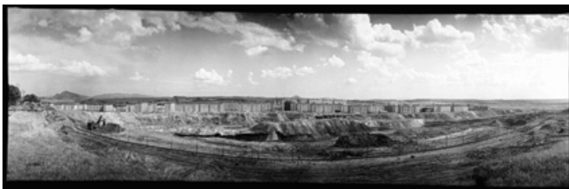
Josef Sudek: Nový Most (Smutná krajina)