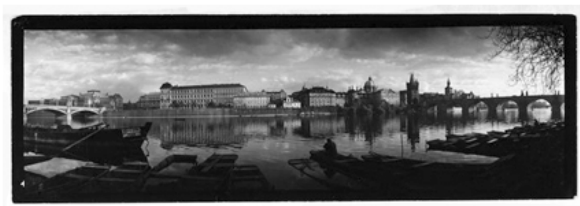
Josef Sudek: z cyklu Praha panoramatická

Tento svůj záměr podtrhl také způsobem tisku publikace Praha panoramatická, na který autor prý osobně dohlížel. Využíval hlubotiskovou techniku, jako podklady pro leptání měděných válců sloužily přímo negativy. Pozitivy byly k ruce pouze pro potřebné náhledy redaktorům. Počátkem 90. let bylo 284 náhledových pozitivů z archivu nakladatelství Odeon věnováno Uměleckoprůmyslovému museu v Praze. Později byly představeny na výstavě v pražské Galerii Rudolfinum a v novém vydání knihy Praha panoramatická.