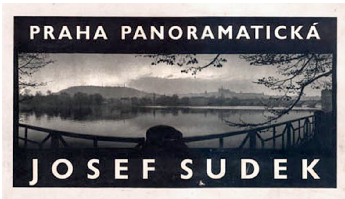
Josef Sudek: přebal knihy Praha panoramatická