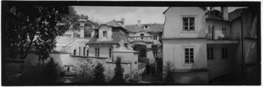
Josef Sudek: z cyklu Praha panoramatická