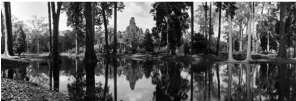
Jaroslav Poncar: Bayon (1997)

V těch asijských zemích se ale Jaroslavovi Poncarovi naskytla také příležitost, jak využít svou vášeň na poli vědy – začal s fotografickou dokumentací buddhistických chrámů a jejich detailů, když pořizuje snímky nástěnných maleb. V letech 1977 až 1987 pro německou televizi procestoval další kouty – Jemen, Mali, Indii, Pakistán a vrátil se i do Tibetu. V roce 1981 začal právě s fotografickou dokumentací historických uměleckých děl, nástěnných maleb v chrámech západního Himálaje, v Tibetu, Nepálu, Barmě. Tady všude provádí jako vědecký pracovník oceňovaný výzkum. Právě díky jeho obrázkům jsou mapována pro veřejnost jinak nepřístupná místa. Velký kus práce odvádí také v Kambodže, kde pracuje v rámci programu UNESCO, fotografuje velkolepý komplex Angkor Wat. Odtud pochází například i stovka panoramatických fotek.