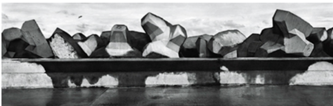
Josef Koudelka: z cyklu Černý trojúhelník

A tak vzniká další subjektivní dokument krajiny tematicky navazující na práci Josefa Sudka, který se týmiž zákoutími toulal tři desetiletí před Koudelkou. Oba si s sebou nesli panoramatickou kameru, i když jiného rozměru, a oba se nechali spoutat trochu nahořklou chutí fotogeničnosti tohoto zmaru i místním duchem místa. „ Genius loci je něco podobného jako ‚krajinný ráz‘, ale je ještě méně uchopitelný. Asi nejlepší definice ‚ducha místa‘ je to, že je důvodem, který neumíme pojmenovat, ale kvůli kterému se vracíme. Pojem genius loci může působit magicky a prchavě, ale ve skutečnosti je jednou z nejsilnějších esencí celé krajiny... Genius loci se nevznáší na nějakém obláčku, ale je pevně vepsán do tvarů, struktur a barev kraje. “ 48