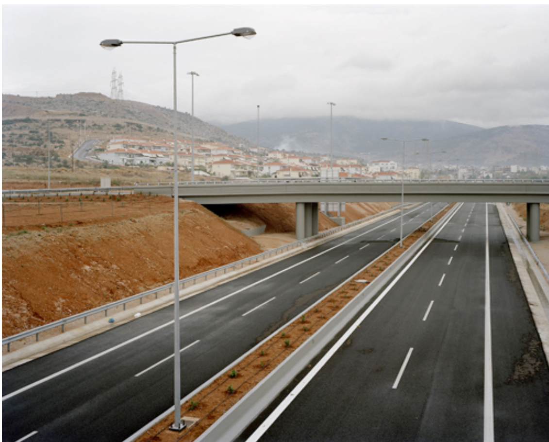
Fotografie č. 8 Mark Power, Athens (Attiki Odos ring road) , ze série Periplus , 2003