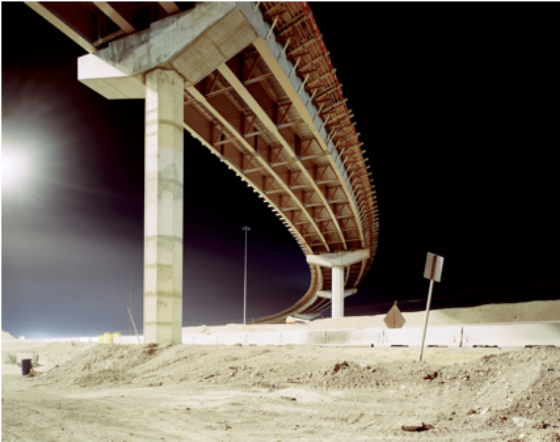
Fotografie č. 13 Nadav Kander, I wish I were near you - Highway Development II, Los Angeles, USA