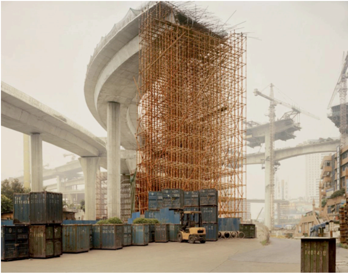
Fotografie č. 12 Nadav Kander, Yangtze, The Long River - Chongqing I, Chongqing Municipality