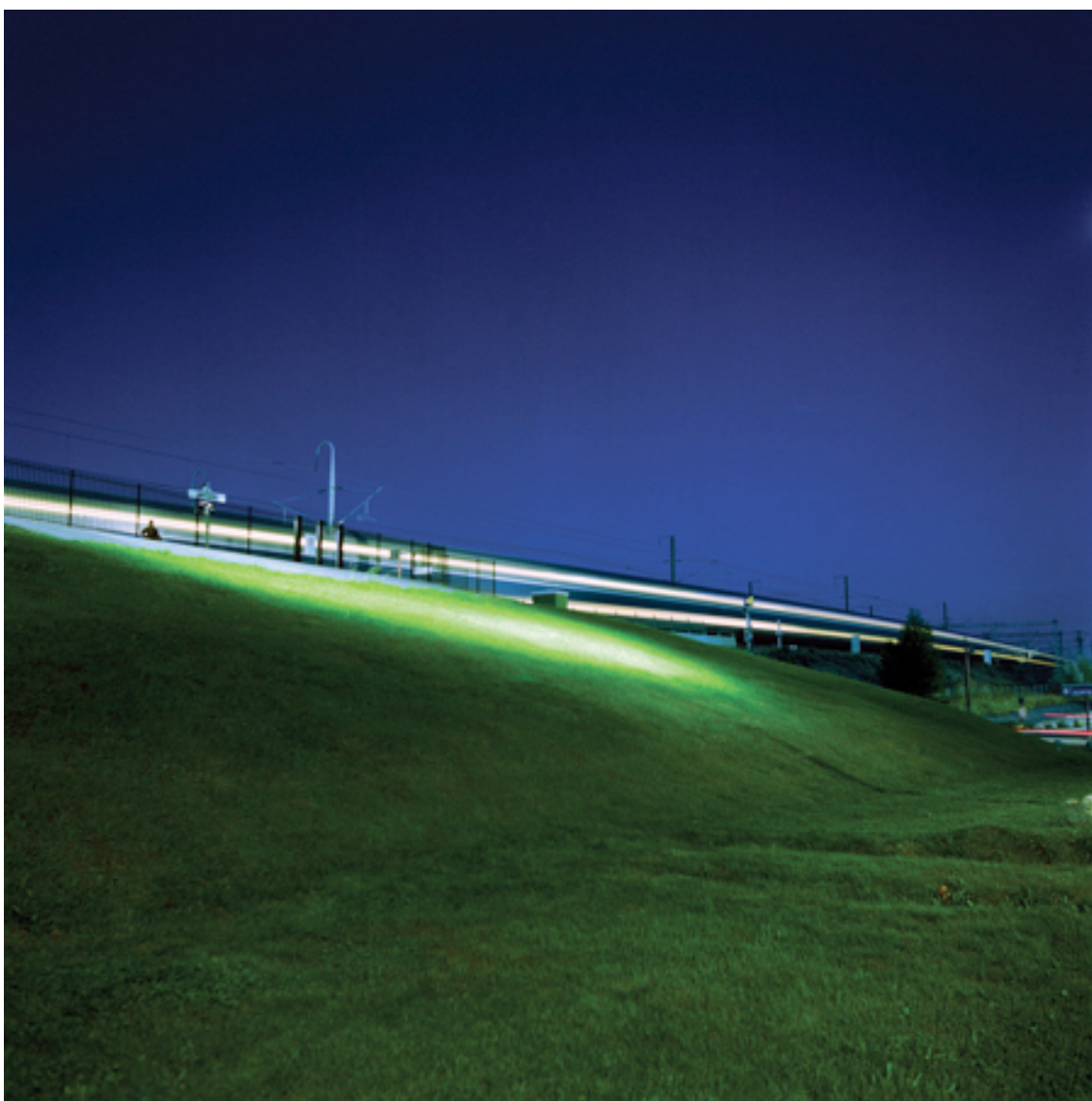
Fotografie č. 29 Maciej Stępiński, ze série Sans Titre , 2007