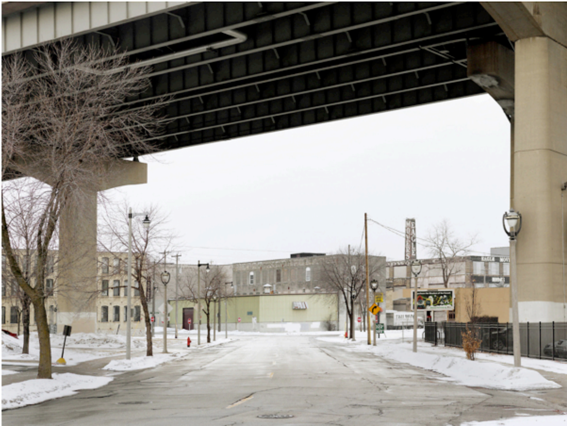
Fotografie č. 10 Donovan Wylie, West Virginia Street. Milwaukee, Wisconsin, 2014