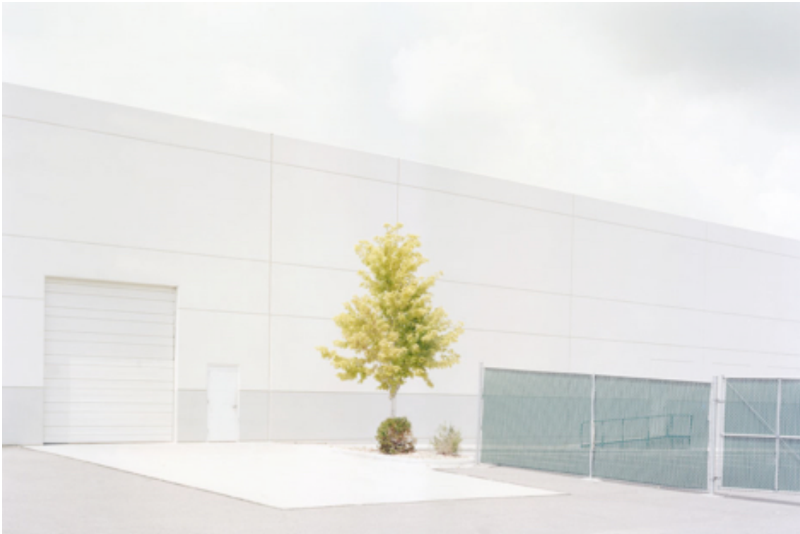
Fotografie č. 22 J Bennett Fitts, Yellow Tree , ze série Industrial Landscape [ing]