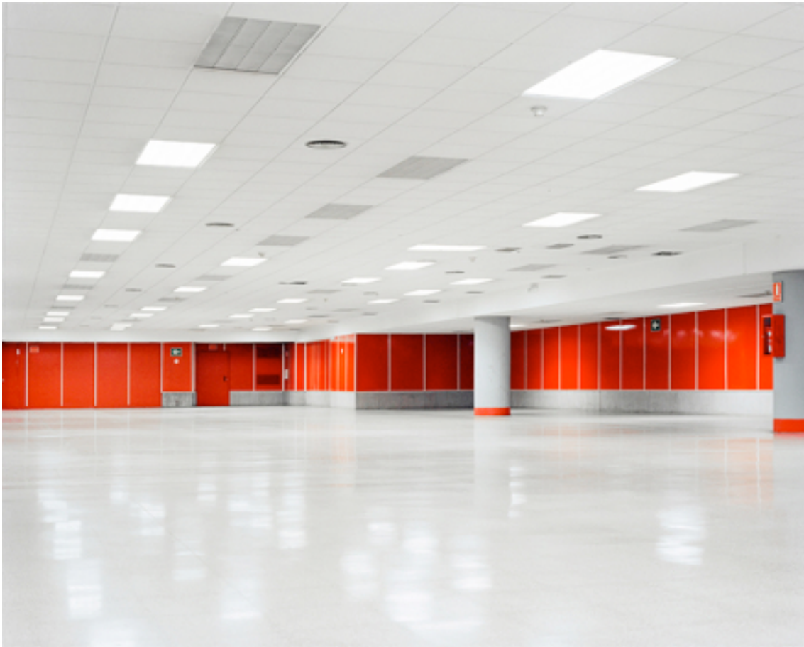
Fotografie č. 20 Daniel Everett, ze série Departure