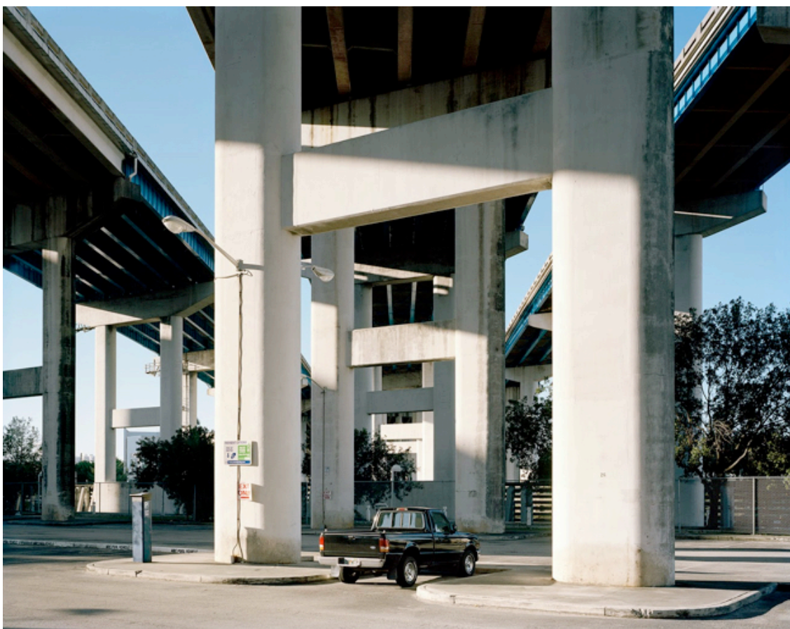
Fotografie č. 6 Mark Power, Miami (Thanksgiving) , ze série Postcards from America IV: Florida , 2012