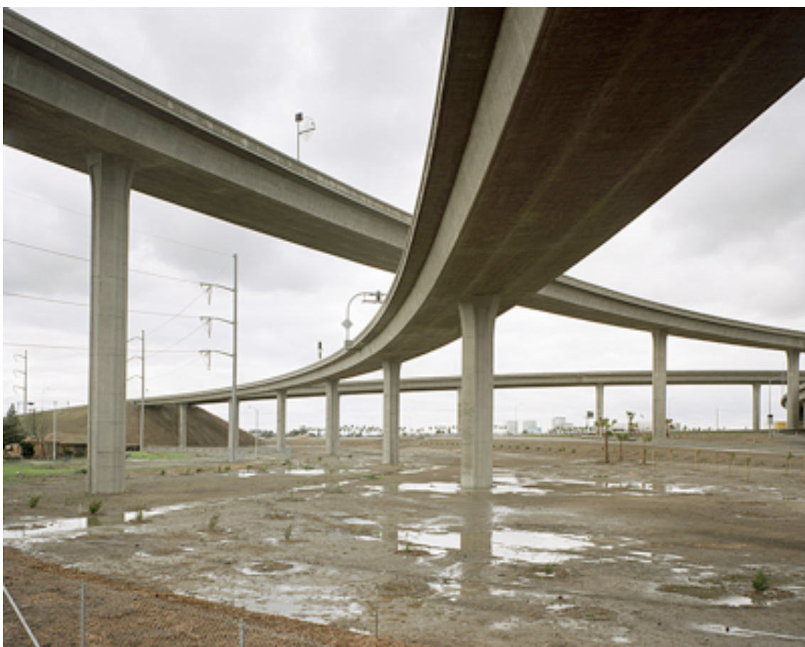
Fotografie č. 17 John Humble, New Construction, I-105 at I-110, Los Angeles , ze série The Freeways , 1991