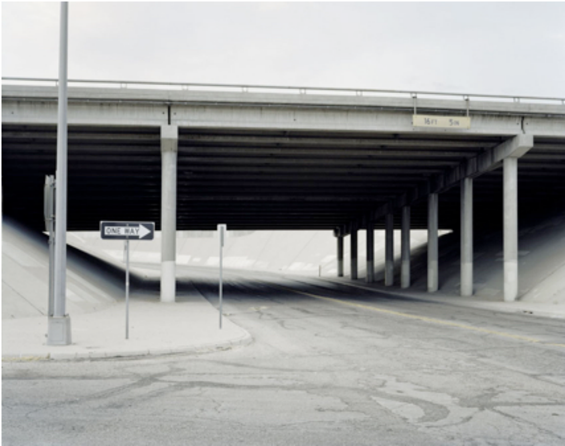
Fotografie č. 14 Nadav Kander, God's Country - Highway, Grey Day, Texas, USA