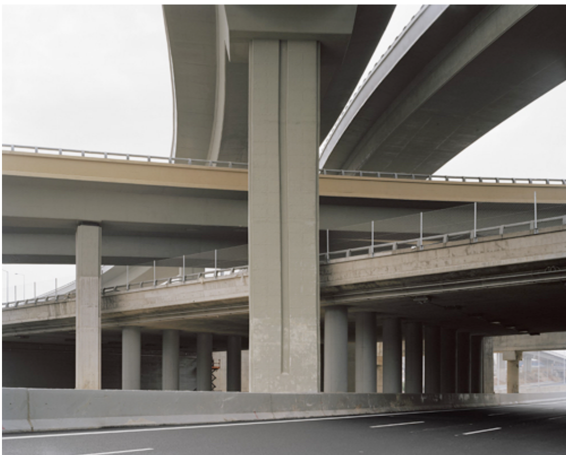
Fotografie č. 7 Mark Power, Athens (Attiki Odos ring road) , ze série Periplus , 2003