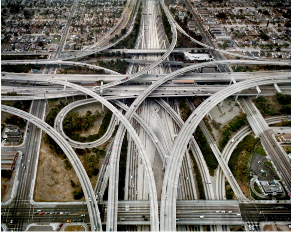
Fotografie č. 1 Edward Burtynsky, Highway #1, Los Angeles, California, USA, 2003