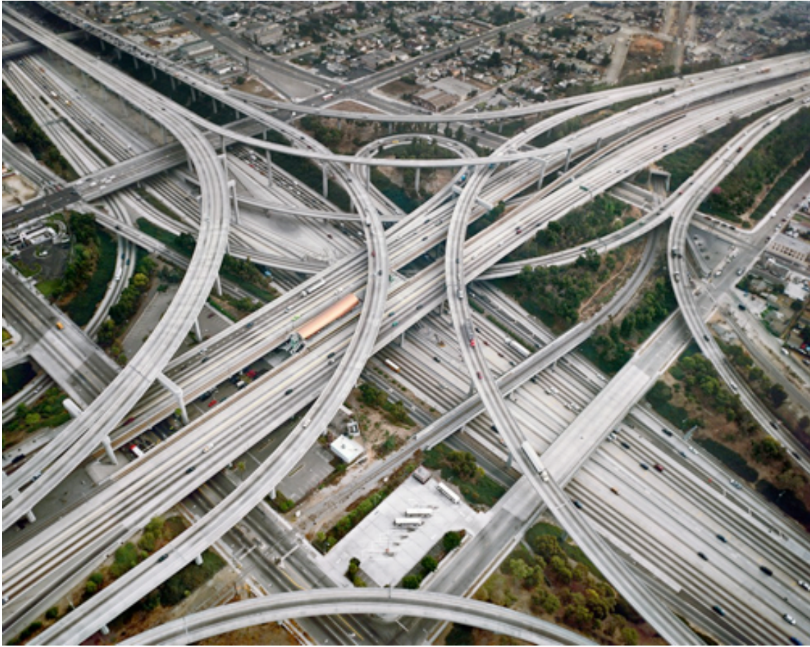
Fotografie č. 2 Edward Burtynsky, Highway #2, Los Angeles, California, USA, 2003