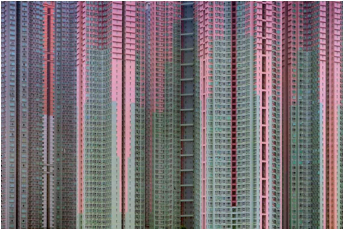
Fotografie č. 27 Michael Wolf, ze série Architecture of Density