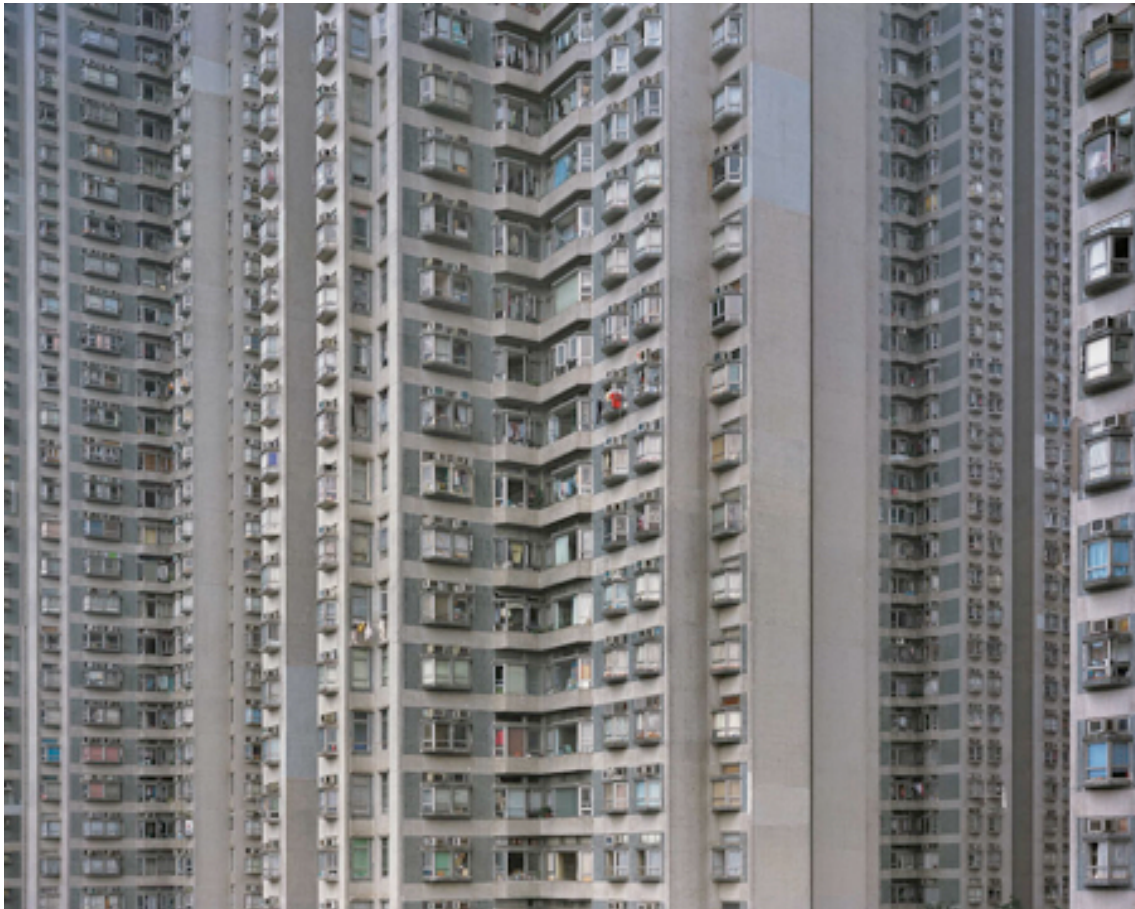
Fotografie č. 26 Michael Wolf, ze série Architecture of Density