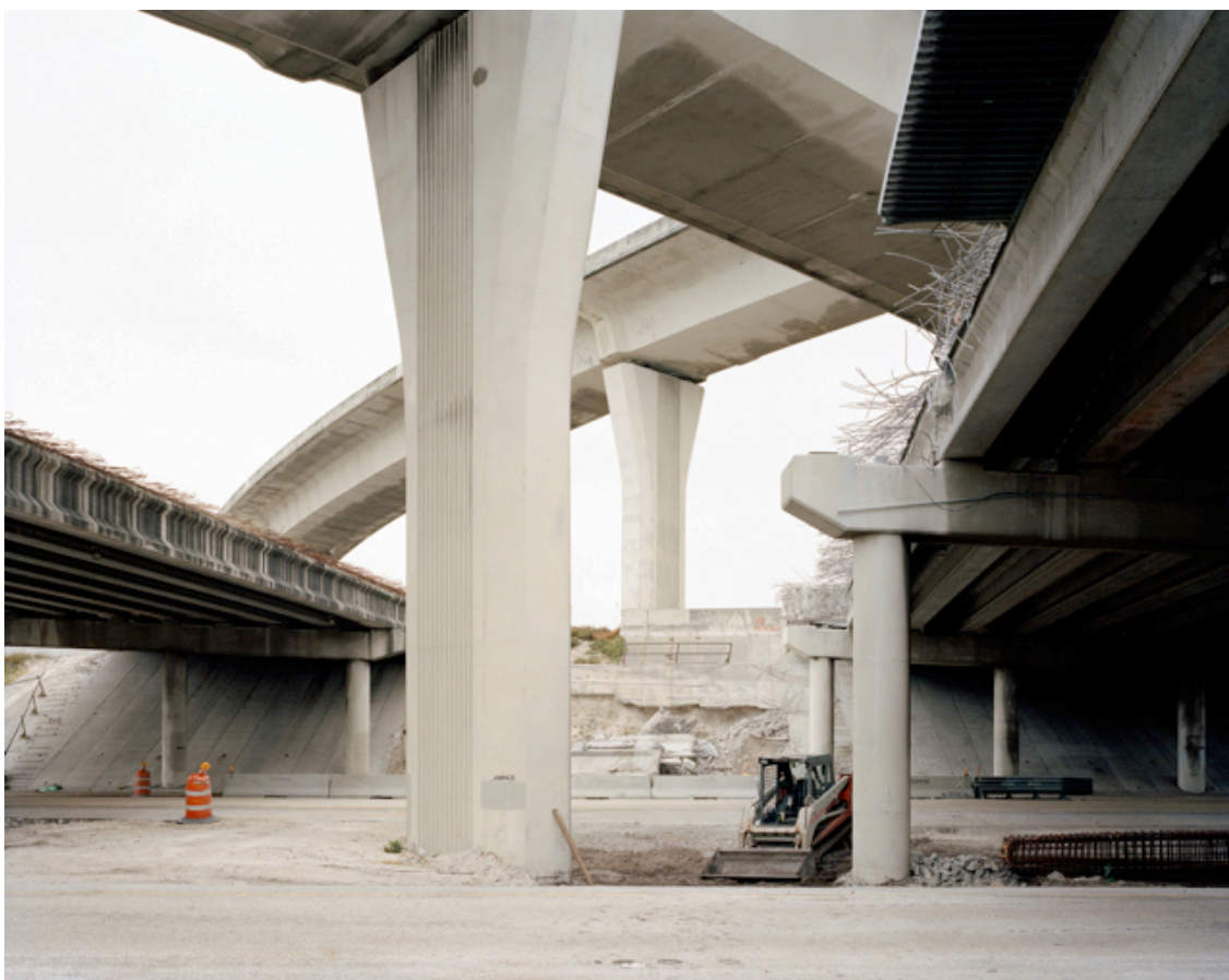
Fotografie č. 5 Mark Power, Broward County (State Highway 441) , ze série Postcards from America IV: Florida , 2012