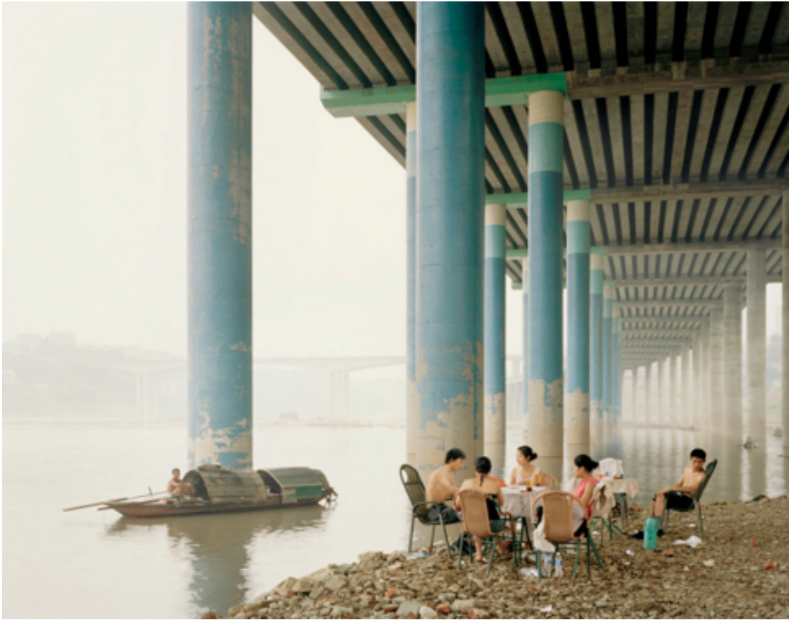
Fotografie č. 15 Nadav Kander, Chongqing IV (Sunday picnic) . Chongqing municipality