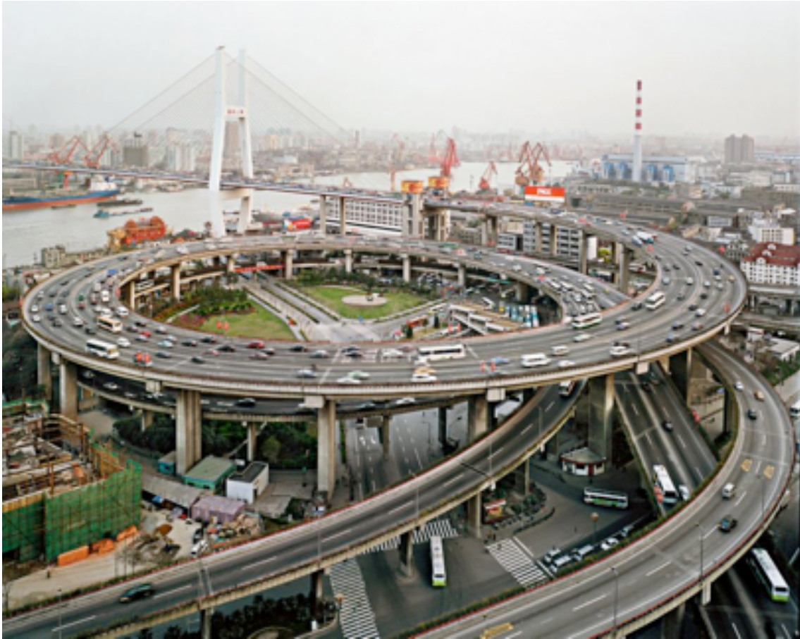
Fotografie č. 4 Edward Burtynsky, Nanpu Bridge Interchange, Shanghai, China, 2004