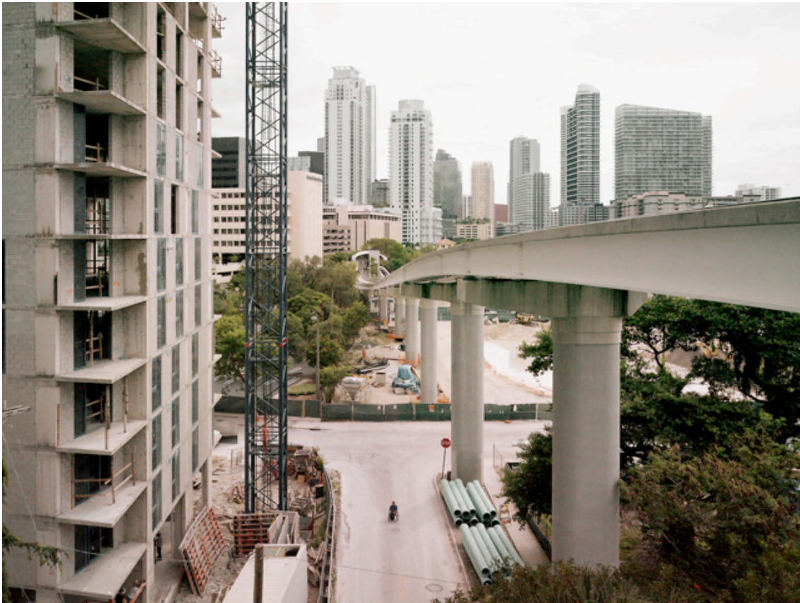
Fotografie č. 11 Donovan Wylie, Citizen . Miami, Florida, 2014