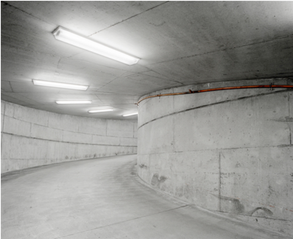
Fotografie č. 21 Daniel Everett, ze série Departure