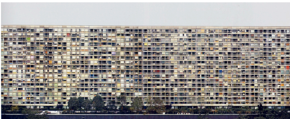
Fotografie č. 31 Andreas Gursky, Paris Montparnasse , 1993