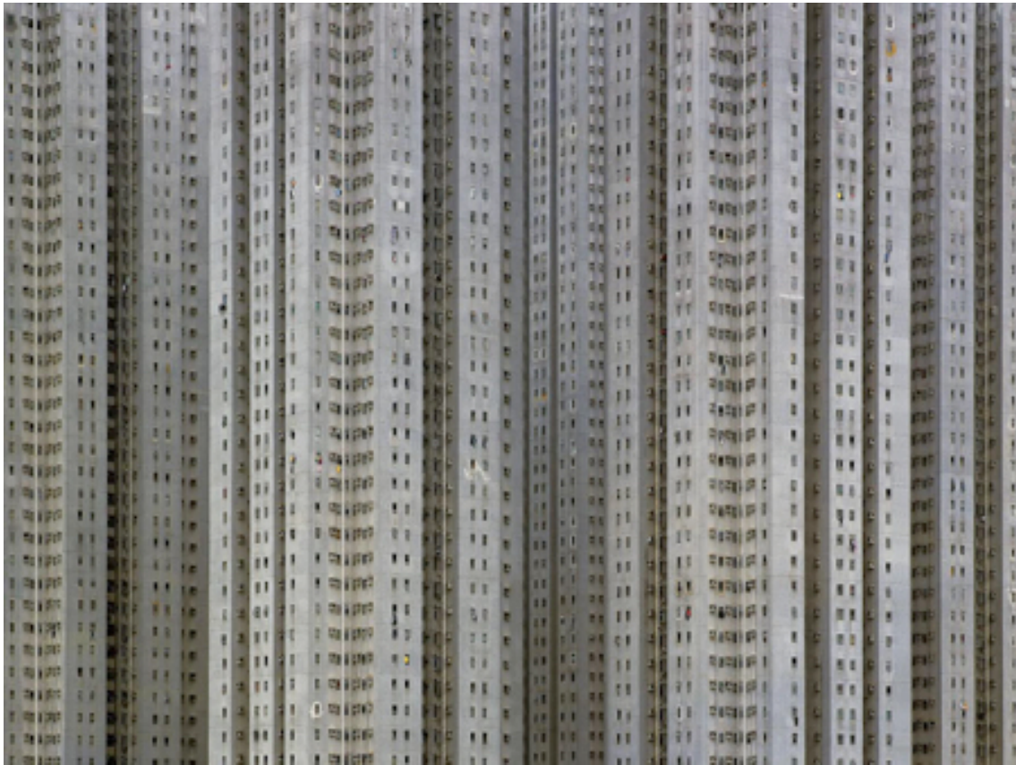
Fotografie č. 25 Michael Wolf, ze série Architecture of Density