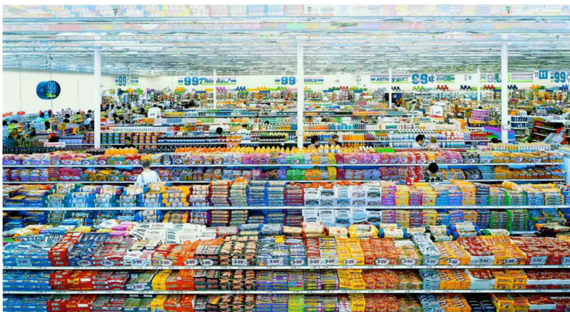
Fotografie č. 30 Andreas Gursky, 99 cents, 1999