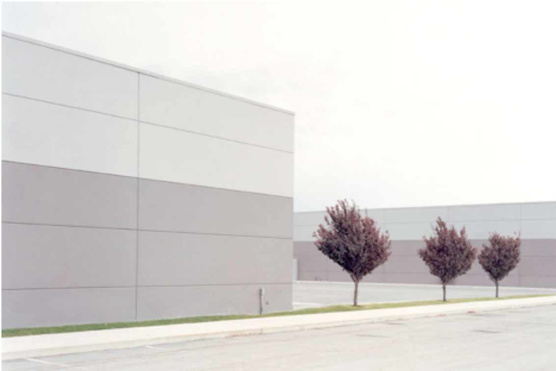
Fotografie č. 23 J Bennett Fitts, Three Trees , ze série Industrial Landscape [ing]