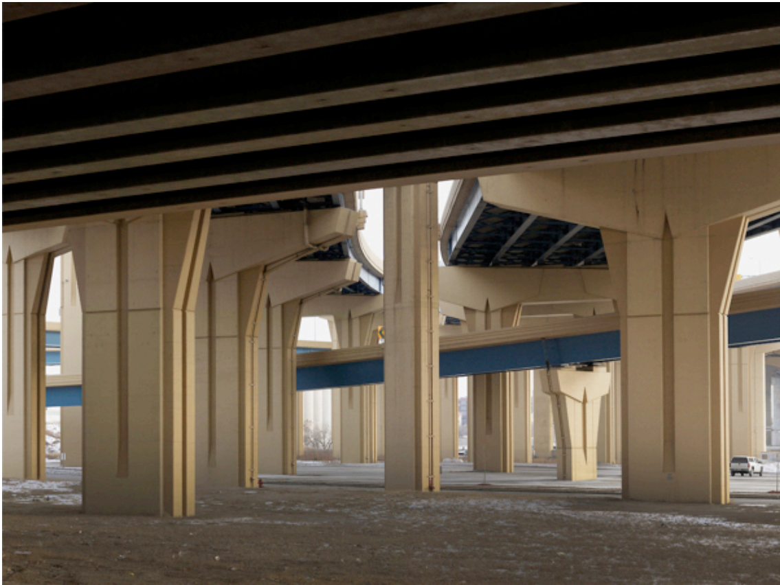
Fotografie č. 9 Donovan Wylie, The Preparatory City. Marquette Interchange. Milwaukee, Wisconsin, 2014