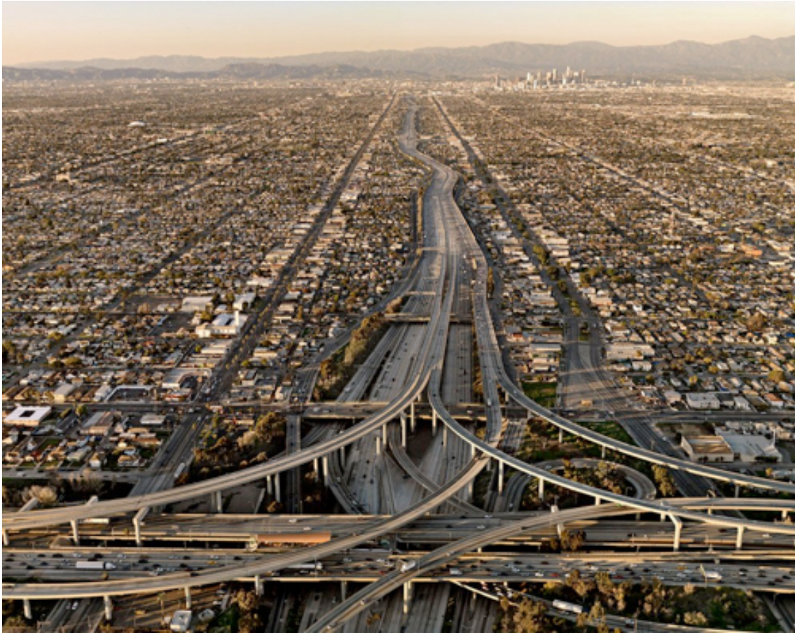
Fotografie č. 3 Edward Burtynsky, Highway #5, Los Angeles, California, USA, 2009