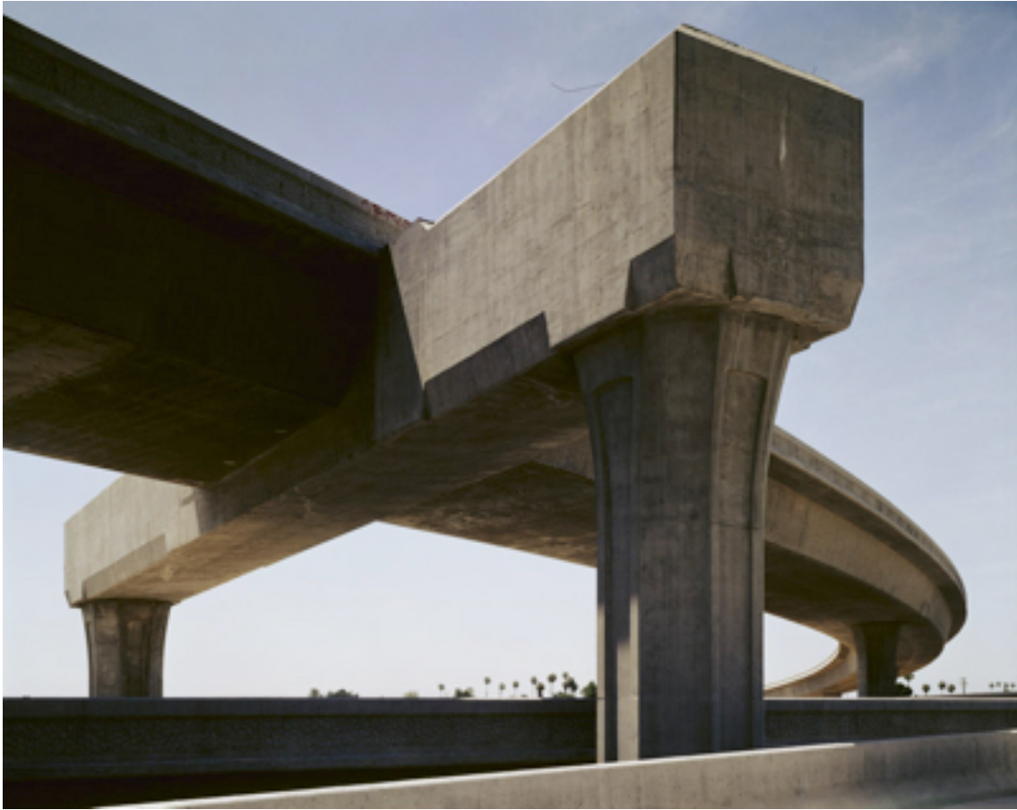
Fotografie č. 18 John Humble, View West, I-105 at I-110, Los Angeles , ze série The Freeways , 1993