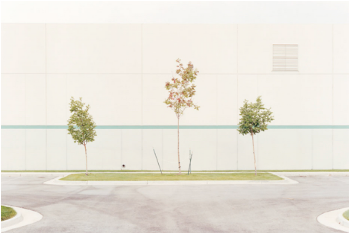
Fotografie č. 24 J Bennett Fitts, Symmetrical Saplings , ze série Industrial Landscape[ing]