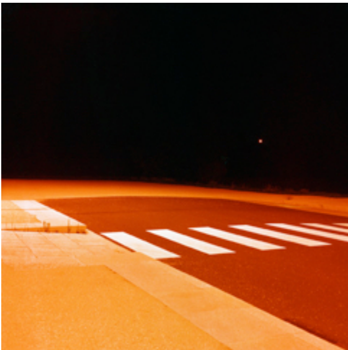
Fotografie č. 28 Maciej Stępiński, ze série Sans Titre , 2007