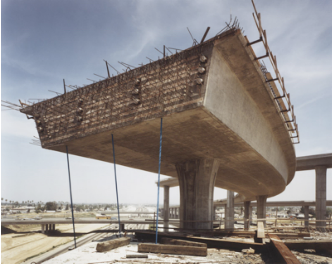
Fotografie č. 16 John Humble, New Overpass, I-105 at I-110, Los Angeles , ze série The Freeways 1991