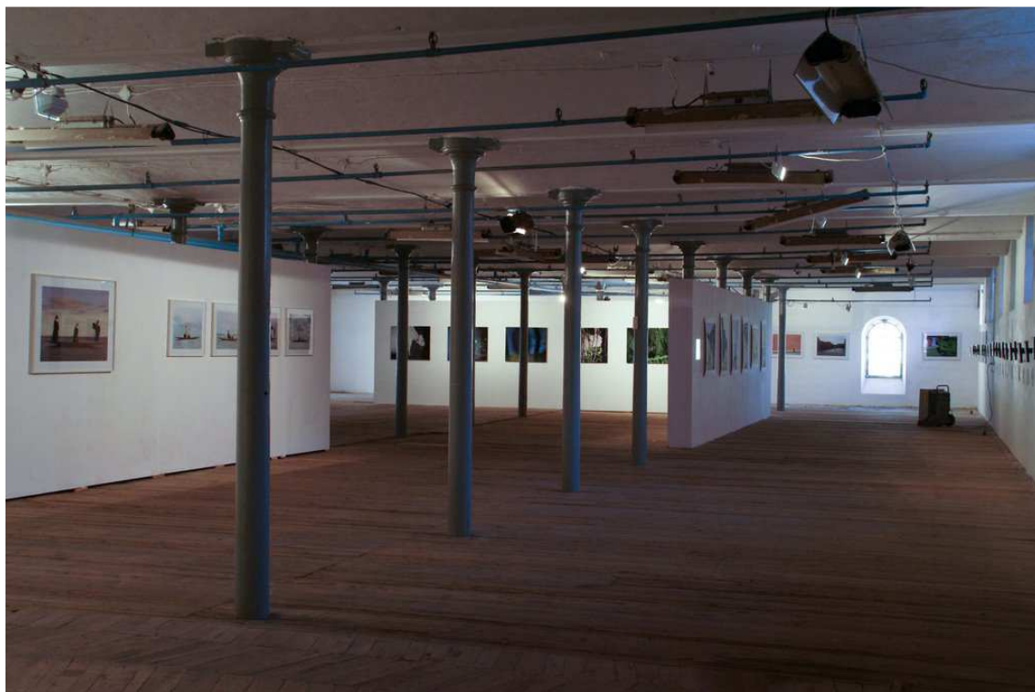
Atak Łaskotek , Fotofestival, Lodž – fotografie výstavního prostoru

Dobrým příkladem rozvinuté mezinárodní spolupráce v rámci realizace projektu spolufinancovaného z evropských zdrojů může být trienále fotografie Backlight. Jde o dnes již tradiční událost, kterou od roku 1987 organizuje The Photographic Centre Nykyaiika ve finském Tampere. V roce 2008 umožnily prostředky poskytované v rámci evropského programu Kultura rozšíření festivalového programu Atak łaskotek (Lechtivý útok) do velikosti mezinárodní prezentace, do které se zapojily různorodé galerie a výstavní prostory, které se pro veřejnost ve Finsku, Itálii, Rakousku a Polsku otevřely současně. Výstav se zúčastnilo 56 umělců. Hlavním organizátorem bylo Photographic Centre Nykyaiika z Finska a spoluorganizátory pak Nadace Studio Marangoni z Itálie, FLUSS – Society for the Promotion of Photo and Media Art z Rakouska, WRO Art Center z Polska a Northern Photographic Centre z Finska.