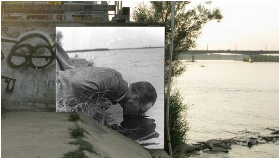
Karolina Breguła, ze souboru Fotografie korekcyjne , 2011

každou autorskou část vznikla i doprovodná publikace. Celkově vznikly dvě série kapesních alb obsahující reprodukce prací a krátké eseje. 14