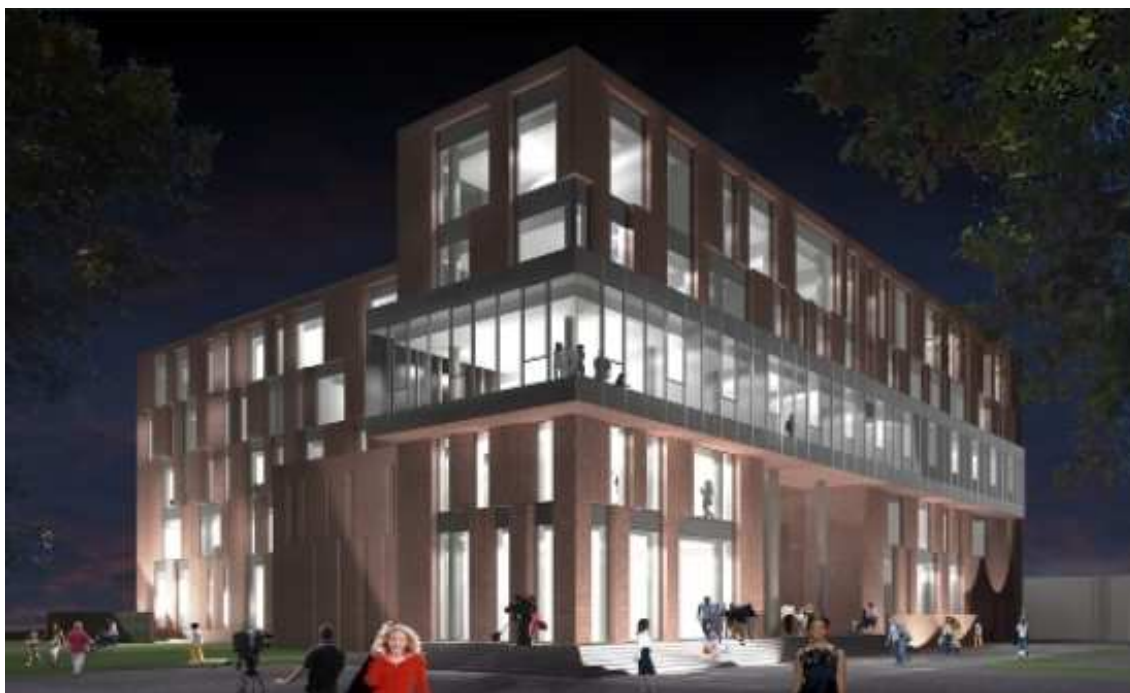
Projekt vzdělávacího centra didaktiky nových médií – PWSF TViT

Hlavním cílem 11. priority operačního programu Infrastruktura a prostředí – Kultura a kulturní dědictví byla „aktivní podpora rozvoje a modernizace infrastruktury kultury a uměleckého vzdělávání a ochrana kulturního dědictví v evropském a světovém významu“. Tento program umožnil také financování řady velkých investic podporujících vzdělávání v oboru fotografie. Jako příklad můžeme uvést projekt nazvaný „Budova didaktiky – PWSF TViT 10 . Vzdělávací centrum výuky nových médií“. Příjemcem projektu byla Státní vysoká filmová škola, fakulta filmu a divadelního umění L. Schillera v Lodži. Hodnota projektu byla odhadnuta na 30,1 mil.