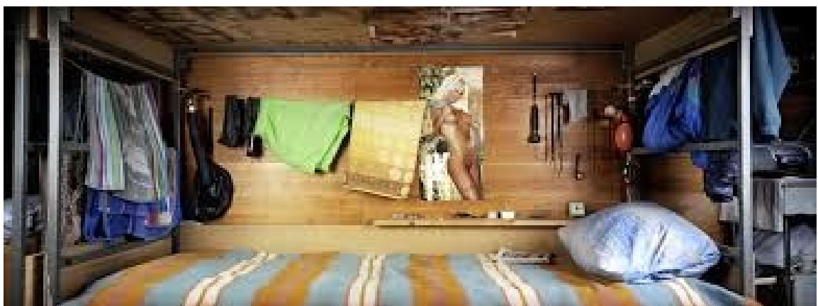
Ilustracje 24: Andrzej Kramarz, Weronika Łodzińska, cyklus 1,6 m kw , 2004