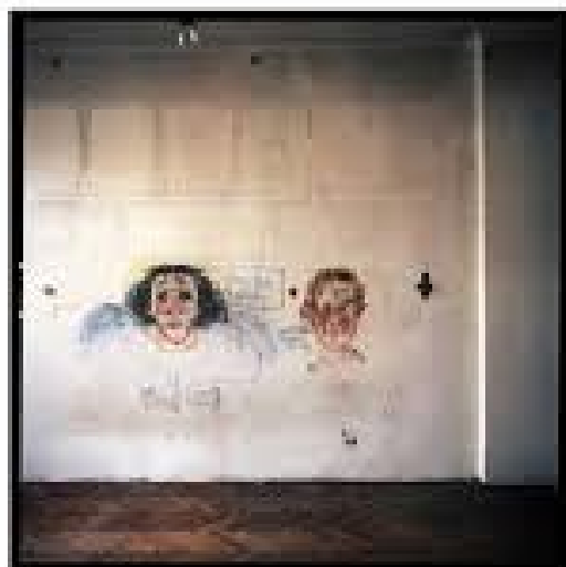
Ilustrace 26: Mateusz Torbus, cyklus Apokope , 2010