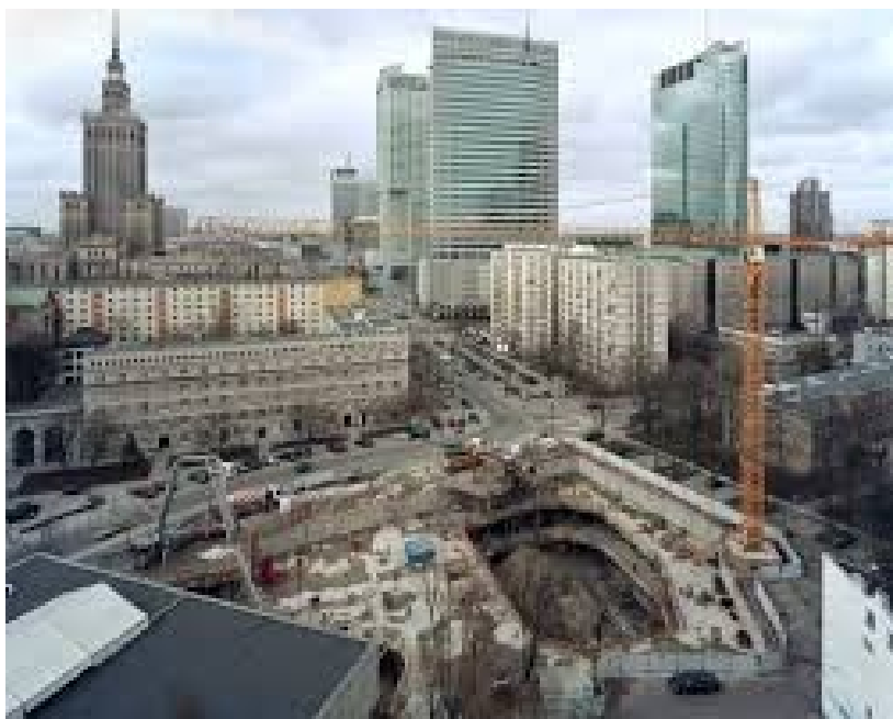
Ilustrace 21: Wojciech Wiczak, Elżbieta Janicka, cyklus Jiné město , 2013