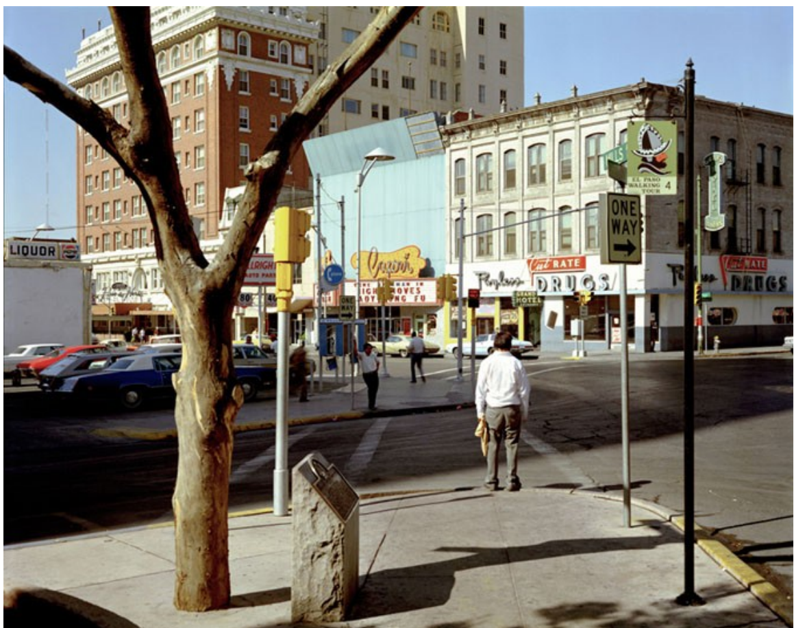
Ilustrace 4: Steven Shore, cyklus Uncommon Places , 1982