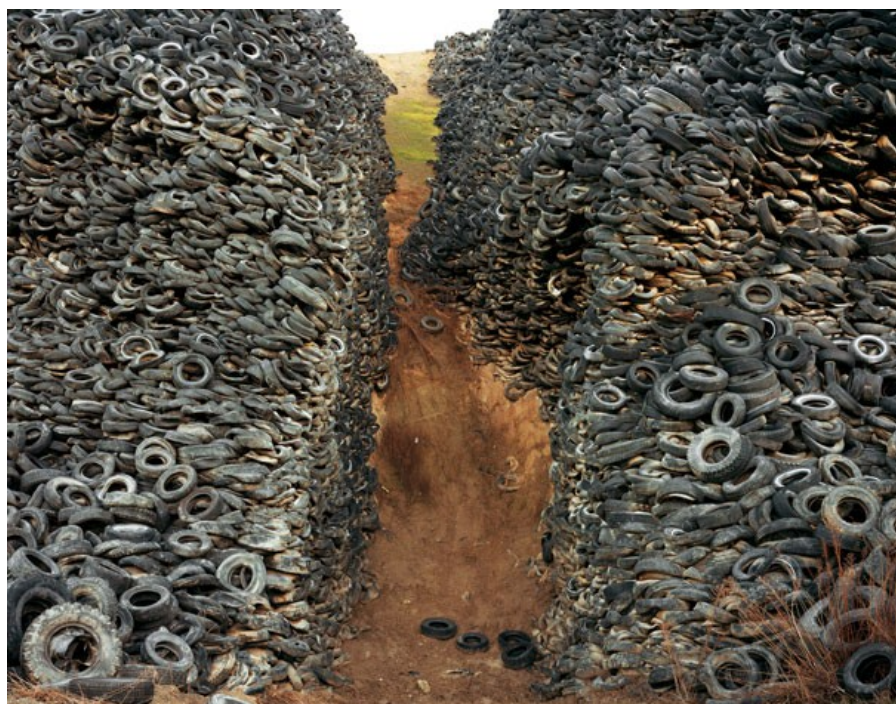
Ilustrace 7: Edward Burtynsky, Urban Mines , 1997