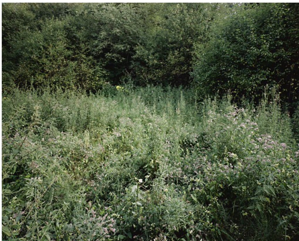
Ilustrace 22: Andrzej Kramarz, cyklus Kousek Země , 2009