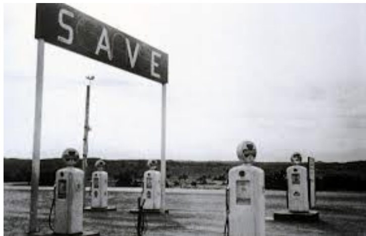
Ilustrace 3: Robert Frank, cyklus Americans , 1955-1966