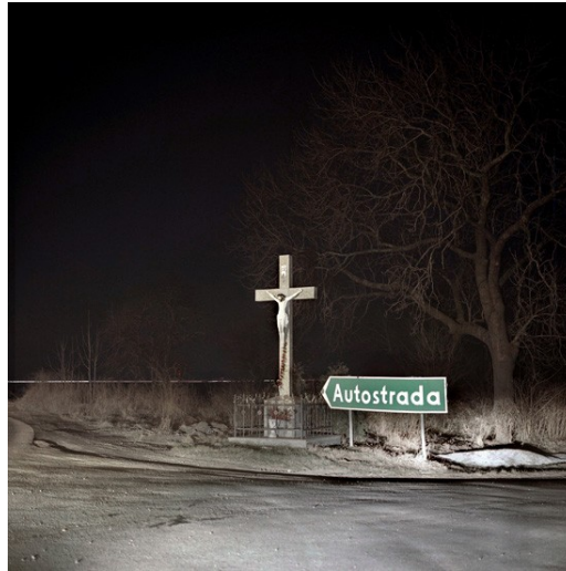
Ilustrace 12: Łukasz Biedermann, cyklus The City Sleeps , 2009