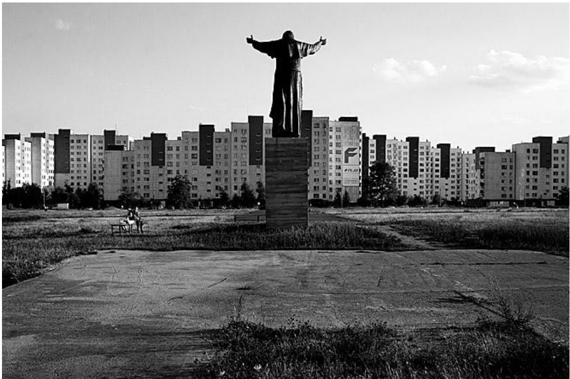
Ilustrace 14: Krzysztof Szewczyk, cyklus Santo subito , 2006