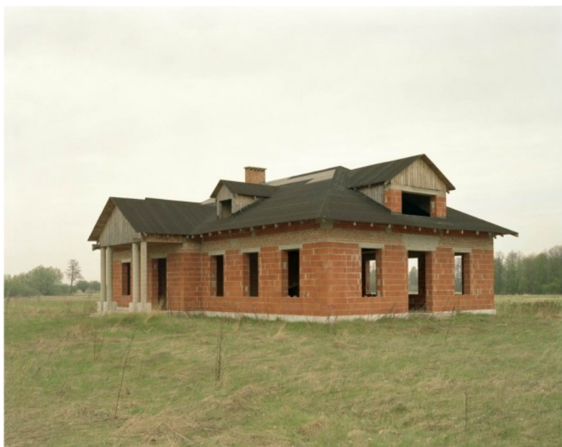
Ilustracje 12: Konrad Pustoła, cykl Nedokončené domy , 2005