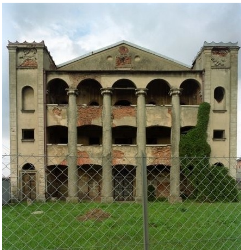
Ilustracja 17: Wojciech Wilczyk, cyklus Nevinné oko neexistuje , 2009