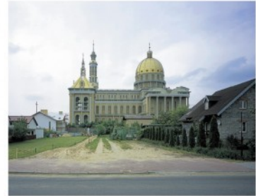
Ilustrace 15: Nicolas Gropierre, cyklus The Afterlife of Buildings , 2008