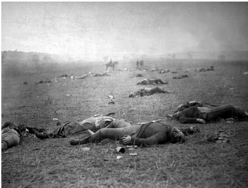
Ilustrace 1: Timothy O'Sullivan, Žně smrti u Gettysburgu, Pensylvánie