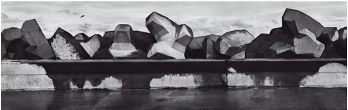
Ilustrace 6: Josef Koudelka, cyklus Chaos , 1999