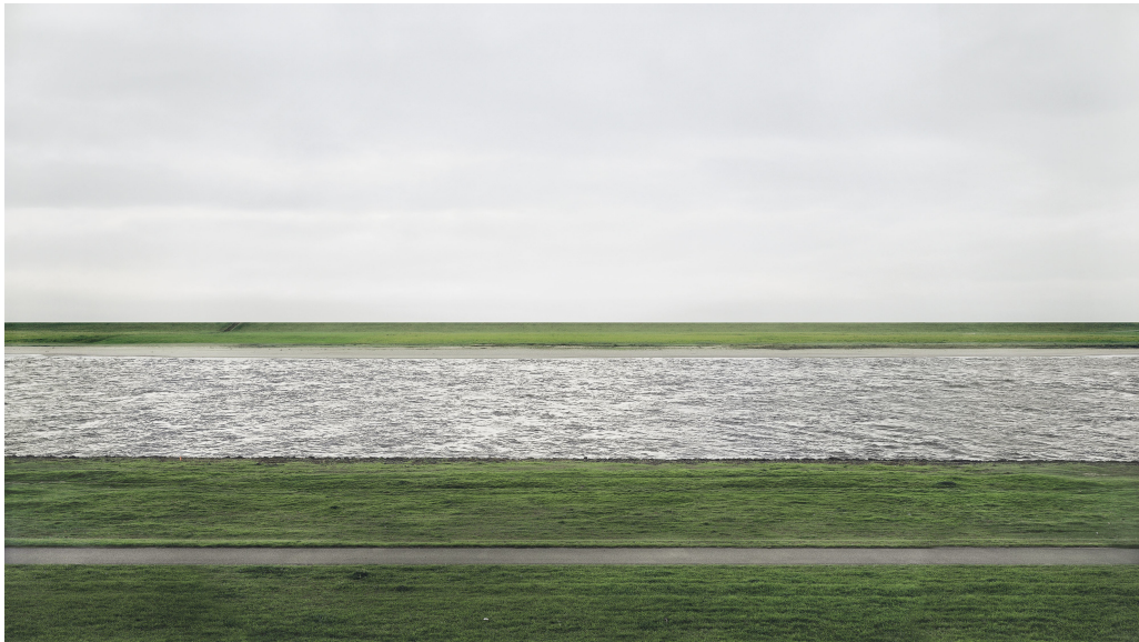
Ilustrace 5: Andreas Gursky, Ren II , 1999