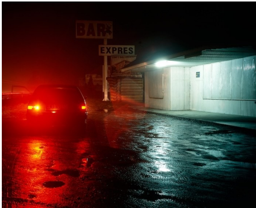
Ilustrace 9: Szymon Rogiński, cyklus Poland Synthesis , 2004