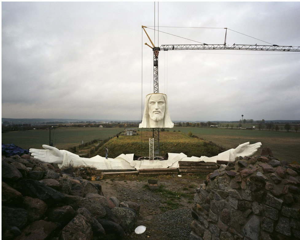
Ilustrace 16: Michał Łuczak, cyklus The Monument , 2010