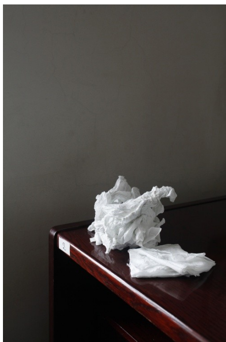
Ilustrace 28: Aneta Wójcik, 1900 hodin za rok , 2012