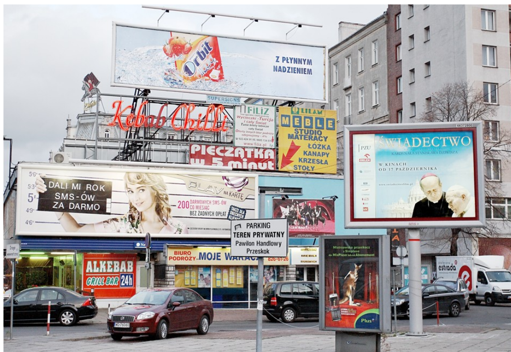
Ilustracje 11: Aleksander Prugar, cykl Reklamiasto , 2008