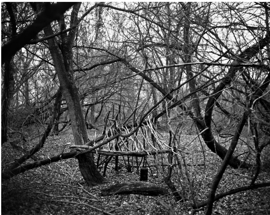
Ilustrace 25: Michał Łuczak, cyklus Ekosystém , 2012