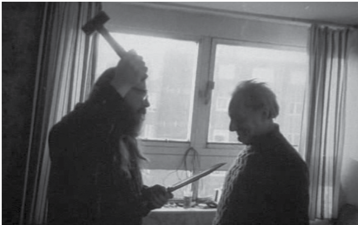
Photography: Richard Billingham, from „Ray's a Laugh“ Series

Ve filmu ukazuje první černobílé fotografie: „Tomuto chlapovi jsem říkal »psychedelický Sid«, přicházel každý den skoro jako mlékař, načerno páčil alkohol [...], díky tomu si otec mohl dovolit alkoholismus. Každý den dostával novou porci samohonky.“ I na druhém Billinghamem představeném snímku se objevuje Sid, drží v jedné ruce kladivo, v druhé nůž. Naproti stojí otec. Komentuje to: „[...] otec se nestaral o to, jestli nůž míří na něj, jestli mu na hlavu dopadne kladivo. Vyzařovala z něj slabost“. Pokračuje: „Fascinovala mě otcova samota, to, že neustále seděl v pokoji, vytvářel přitom kolem sebe psychický prostor, v němž mohl nepřetržitě pít. Chodil jen na záchod“.