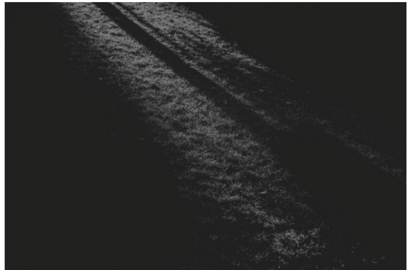
z cyklu „Nowy początek”

K.O. : Děkuji za hovor. Přeji hodně štěstí!