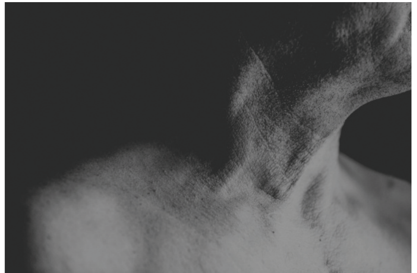
z cyklu „Nowy początek”