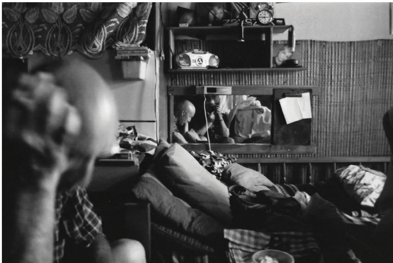
Photography: Krzysztof Orłowski, from „Province” Series

Ted' už vím, že jsem tehdy měl právo postavit se otci, který mě zklamal. Je otec-kat, který byl jako dítě také oběť a „nepřekročil toto dědictví?”. Kumuluji i já v sobě agresi a hněv? Rozhodl jsem se, že nebudu takový jako otec, ale jak jsem se dozvěděl z knihy Wojciecha Eichelbergera, čeká na mě past: „Odstřihujeme se od své agresivity, protože agresivita ve všech podobách je spojována s hněvem. Ve výsledku nedokážeme vytyčit hranice, když je to zapotřebí, ani se adekvátně chovat v situacích vyžadujících rychlou, rozhodnou, někdy agresivní reakci”.