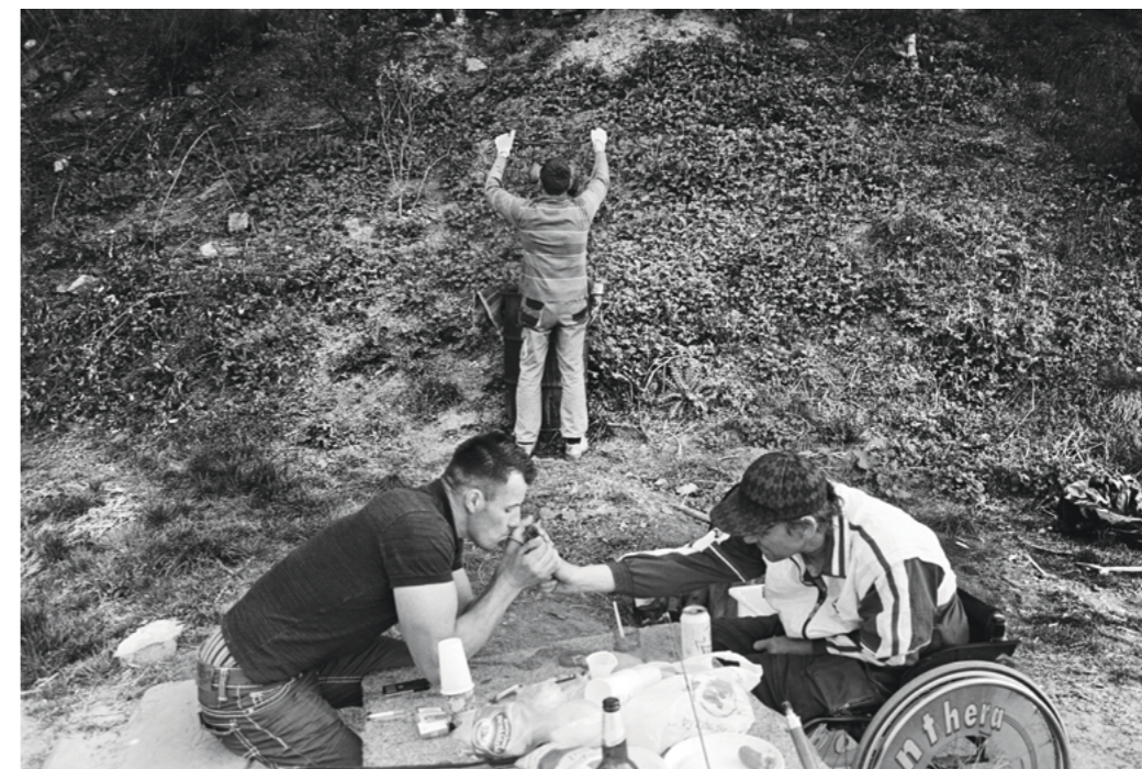
Photography: Krzysztof Orłowski, from „Province” Series

Během dalších let se jeho alkoholické onemocnění prohloubilo. Separoval se. Pil na několikátýdenních tazích. Neměl jsem odvahu se s ním setkat, když se nacházel v takovémto stavu. Čas od času jsme se potkali, když střízlivěl, a vždy na neutrální půdě. Jako u klasického alkoholika se v našich rozhovorech vyhýbal tématu své závislosti. V té době jsem pracoval na dalším cyklu o provincii, z níž pocházím, a samozřejmě o své rodině. Až tehdy, při shromažďování materiálu k práci, mě napadlo, proč jsem neudělal přímý, čistý otcův portrét. O čem to může vypovídat?