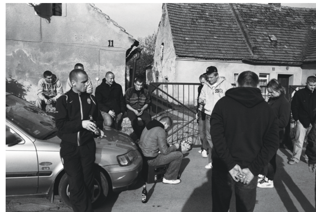
Photography: Krzysztof Orłowski, from „Province” Series