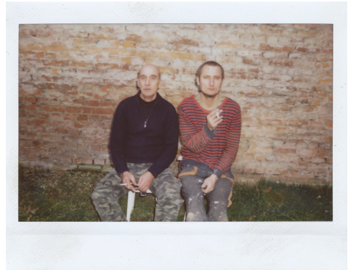
„Me and my father”

Tento komplikovaný vztah mezi námi mě zformoval takového, jakým se cítím být. Skrytého, uzavřeného v sobě, ale citlivého. Během psaní této práce jsem si položil mnoho otázek. Rád bych vážně přistupoval k poselství, že je možné, abych bezpodmínečně pochopil, že za sebe, za můj vztah k jiným a k celému světu zodpovídám pouze já. Za to, co cítím, myslím a za to, co dělám - a mimo to nic není. Mohl bych přestat pěstovat si v sobě tento smutek k otci. Tento přístup mě odděluje od úplné radosti ze života, síly a pocitu důstojnosti.