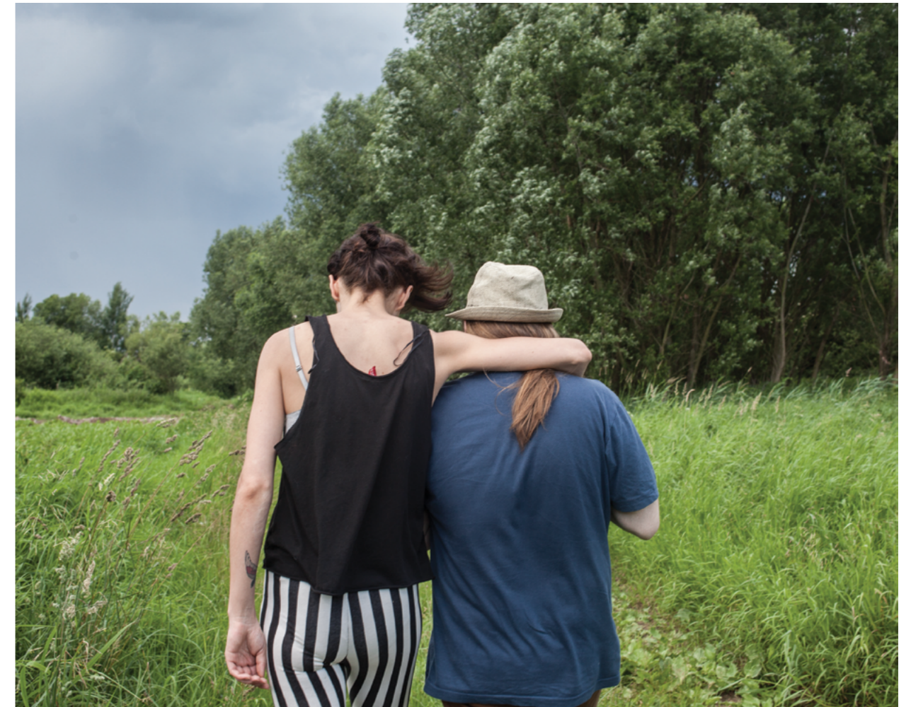
from „Returns“ Series