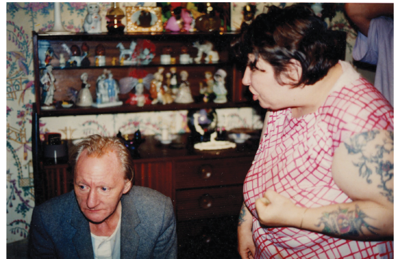
Photography: Richard Billingham, from „Ray's a Laugh“ Series

Fotografie Richarda Billinghama jsou působivé, ovlivňují nás svou upřímností a načrtávají problémy, které měl s otcem a matkou. Vypravěč filmu to komentuje: „Billinghamovy fotografie vytvářejí zvláštní rodinné album, jaké by žádná rodina nechtěla mít a už vůbec by ho nechtěla ukazovat. Chybí v něm vynucené úsměvy a rodinné oslavy. Připomíná spíš pohled na chaotickou zkoušku zpoza kulisy. Tato perspektiva proměnila nedostudovaného malíře ve známého fotografa“.