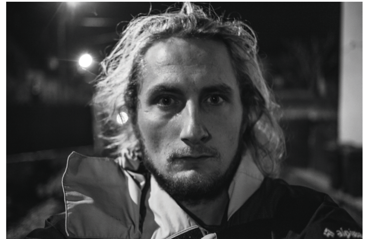
from „Mam, I came back home for a couple of days” Series