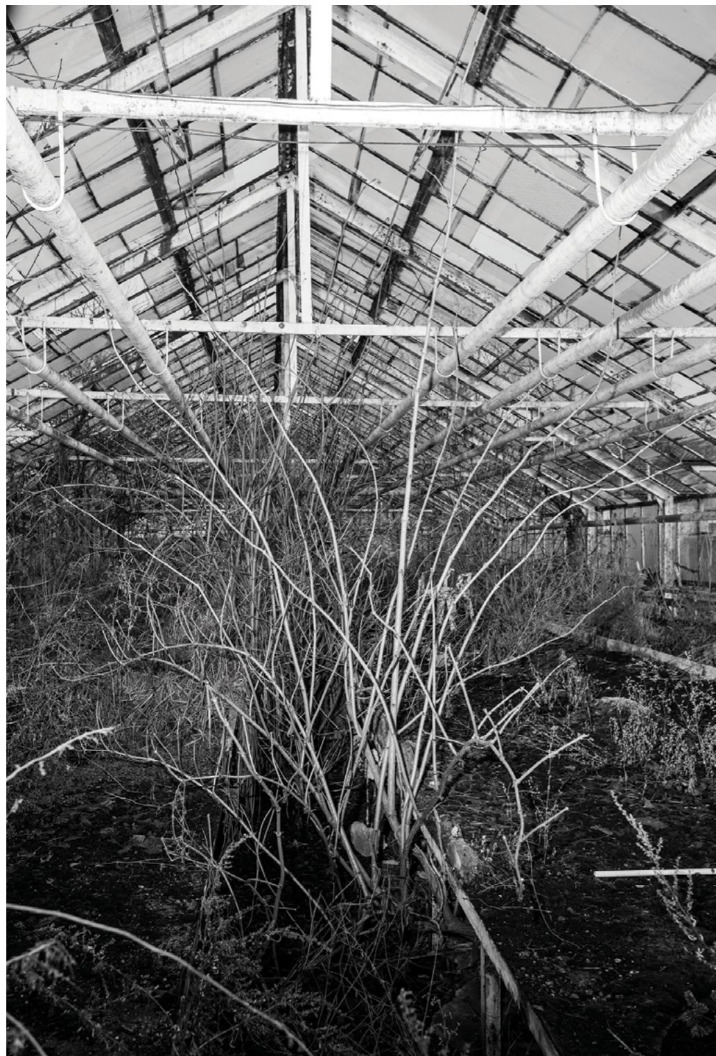
Photography: Krzysztof Orłowski, from „Mam, I came back home for a couple of days” Series

⚡ Podaří se mi někdy v mém „špatném otci” objevit jeho „dobrý a moudrý aspekt”? Podle všeho bych měl, abych poznal pravdu o svém mužském dědictví, poznat a nehodnotit. Otočit se a postavit se čelem k tomu stínu, který mě pronásleduje. Zkreslené vnímání. Extrémní emoce. Kvůli němu ztracená arkádie dětství. Právě proto jako fotograf vyprávím o nejbližší rodině. Jako bych chtěl uspokojit ten pocit smutku, zaplnit v sobě prázdné místo.