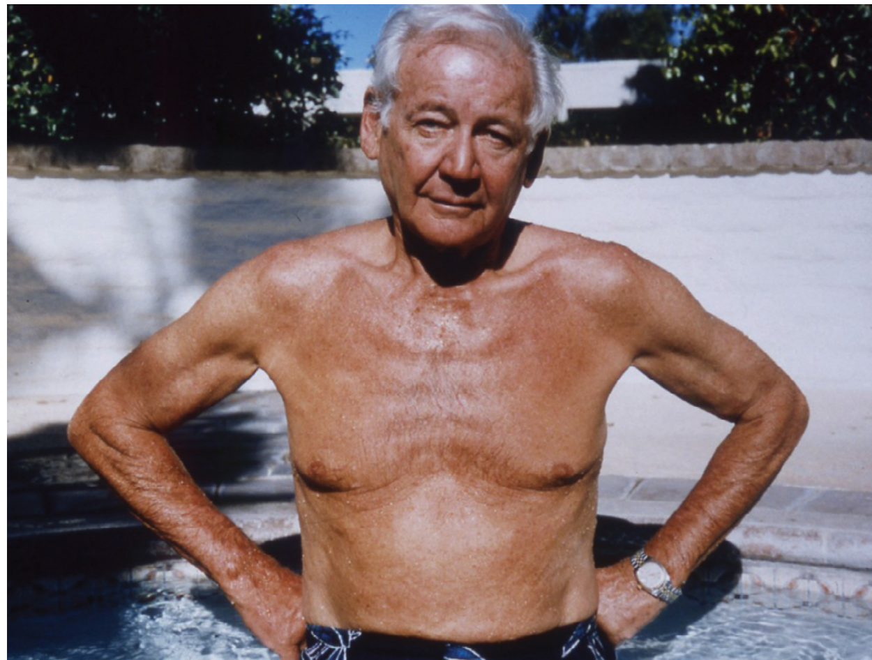
Photography: Larry Sultan, from „Pictures from Home“ Series

Během natáčení páté části filmu oba muži, což je jasně vidět, složili závěrečnou zkoušku z procesu vzájemného poznávání a uchování respektu ke své autonomii. Jejich rozhovor vytváří scénu setkání dvou zralých osobností. Protože se o tom oba zmiňují, musím uvést, že proces narovnávání jejich pošramocených vztahů ovlivnil Larryho projekt „Pictures of Home“ (publikovaný v knižní podobě v roce 1992).