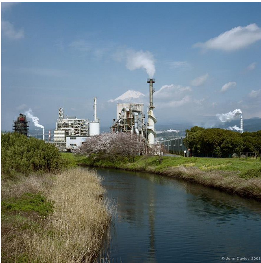
Fotografie č. 2 John Davies, Fuji City 418, Shizuoka Prefecture, Japan, 2008.

„ Mount Fuji, Japan (Fuji city) ” je cyklus fotografií, který vznikl v prefektuře Šizuoka v březnu 2008, během první cesty umělce do Japonska. Sérii tvoří 10 barevných snímků pořízených digitálním fotoaparátem. Město Fudži je jednou z nejvíce industrializovaných oblastí na světě a tato skutečnost se stala jednou z hlavních příčin vzniku cyklu. Soustředí se na specifický vztah přírodní krajiny s industriální architekturou, která charakteristickým způsobem přebírá kontrolu nad původní krajinou. Symbol Japonska, hora Fudži, tvoří důležitý prvek tohoto cyklu fotografií, protože ukazuje postavení přírodních sil, které ještě zcela nepodlehly urbanizaci, svým způsobem se jí staví na odpor. Zároveň nám dodává potěšení, když ukazuje, že svět přírody není při srážce s lidskou činností tak samozřejmou obětí, jak by se mohlo zdát. Daviesovy fotografie dokumentují charakter současného Japonska jako rozvinuté, do značné míry industrializované země, ale zároveň jako vysoce různorodé z hlediska přírodní krajiny. Před našima očima se tedy odehrává svého druhu boj přírody s lidskou činností.