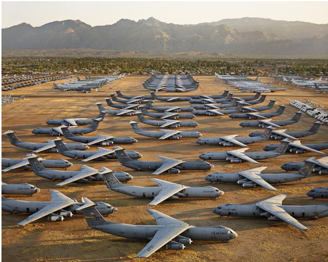
Fotografie č. 5 Edward Burtynsky, AMARC #5, Tuscon, Arizona, USA, 2006.

Fotografie zachycují součásti automobilů, vraky, hřbitovy letadel. Obecně řečeno mohou přivolávat na mysl postapokalyptickou krajinu podobnou těm, jaké se často prezentují v katastrofických nebo právě apokalyptických filmech. Burtynsky chce prostřednictvím své fotografie upozornit na velké problémy, s nimiž se potýká současný svět. Ve svých pracích nám pokládá otázky, kdy skončí éra ropy, a což je důležitější, jak pak bude vypadat svět a jaké budou hlavní změny spojené s touto událostí. Je to politicky a sociálně angažovaný fotograf, snaží se, aby jeho práce měla, podobně jako v Daviesově případě, reálný vliv na obecný zájem o nejdůležitější problémy současných společností.