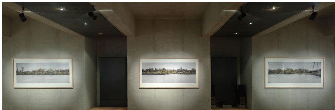
Fotografie č. 9 Juliusz Sokołowski, Niebo nad Warszawą, Warszawa, Polska, 2008.

obrovských fotografických reprodukcí přibližujících, jak byl využit prostor kolem řeky. Snímky se proplétá harmonie barev, kompozice se zdá být vysoce statická. Na jedné z fotografií vidíme, že se umělec rozhodl prolomit konvence krajiny tím, že do ní umístil charakteristický prvek infrastruktury - Svatokřížský most. Ten se prostřednictvím svého zasazení do triptychu stává jedním z klíčových prvků tvořících rám a zároveň jde o bod velice silně kontrastující s prostorem v popředí. Tento most je důležitý i s ohledem na význam pro současnou krajinu Varšavy, snaží se jemně a symbolicky ukázat směr změn kolem řeky Visly a šířeji v celém městě.