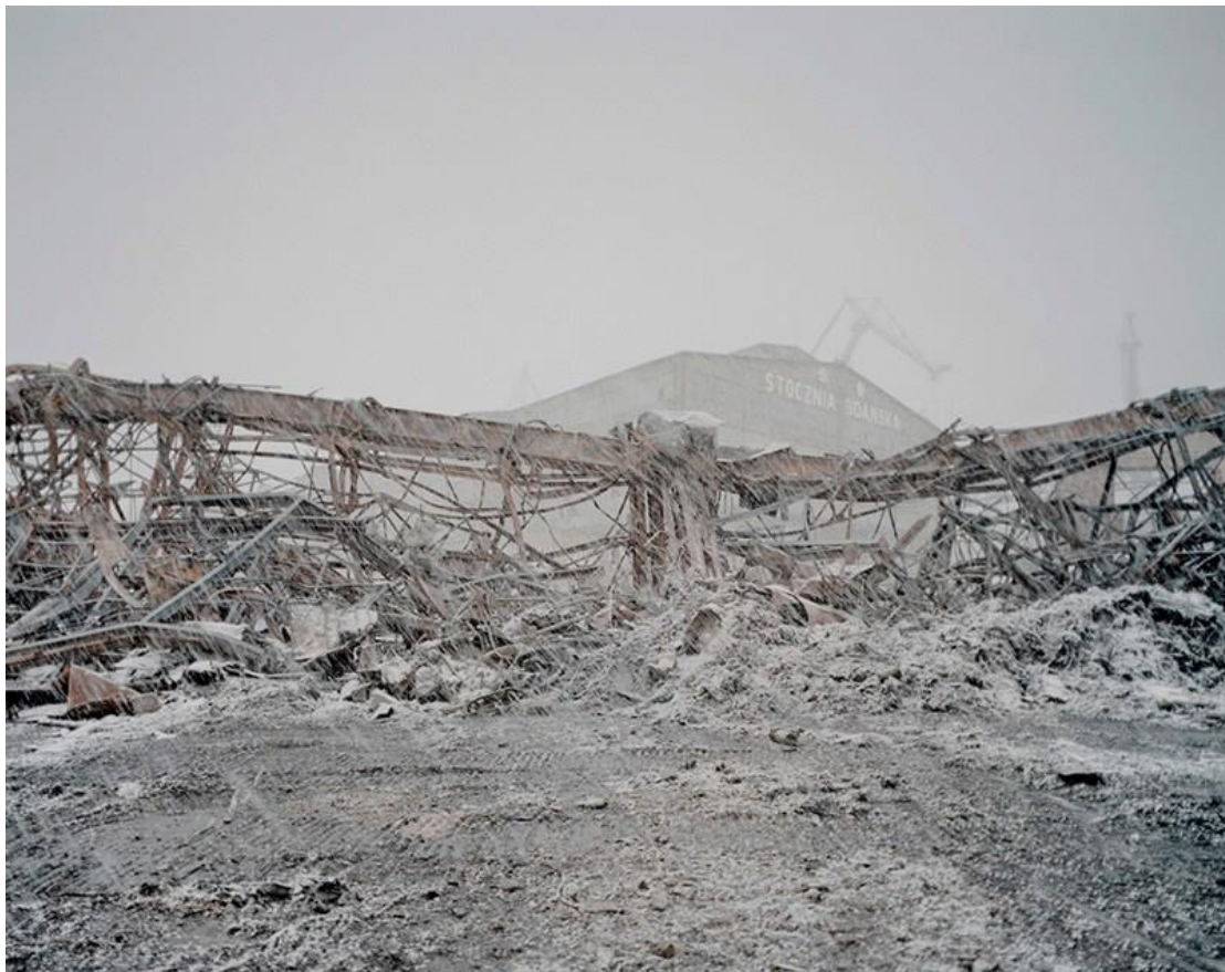
Fotografie č. 15 Michał Szlaga, Stocznia Szlaga, Gdańsk, Polska, 2013.

Cílem autora při tvorbě knihy bylo vytvoření vizuálního nástroje pro politiky, architekty a konzervátory a restaurátory památek. Tyto fotografie představují profesionální památkářskou dokumentaci. Mají představit hodnotu krajiny, místo loděnice a zdůraznit to, co je důležité a co by mělo být chráněno. 26