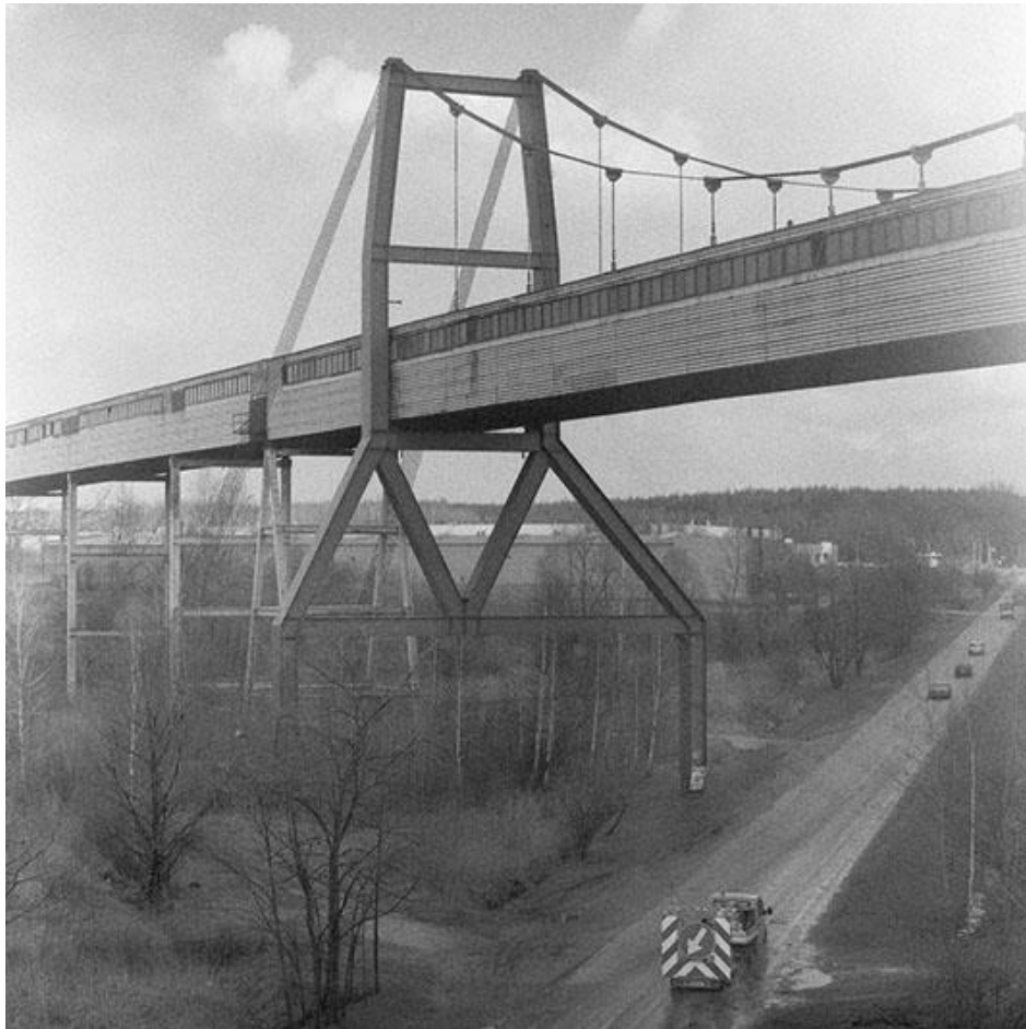
Fotografie č. 6 Krzysztof Racoń, Rura, Strzemieszyce Małe, Polska, 2013.

Fotografie jsou pořízeny středoformátovým fotoaparátem s využitím černobílého negativu. Fotografie jsou špinavé, někdy nedbale pořízené, mající četné kazy procesu vyvolávání, jde o zamýšlený zákrok, který má dosti doslovně předat charakter místa a lidí, kteří na něm žijí. Autor se snaží proplést snímky roury celým cyklem. Máme dojem, že nás, diváky, obklopuje a je také klíčovým referenčním bodem celého příběhu. Na mnoha fotografiích je zachycena v širokých záběrech nebo v pozadí, díky čemuž máme pocit, že nás obklíčila. Tento zákrok ji zdůrazňuje jako hlavní motiv a kompoziční a významový akcent.