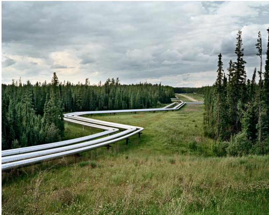
Fotografie č. 3 Edward Burtynsky, Oil Fields #22, Cold Lake Alberta, Canada, 2001.

První skupina fotografií byla pořízena na místech, kde se ve světě nejčastěji těží ropa. Umělec nám prostřednictvím těchto obrazů ukazuje, jak tento současný průmysl využívá přírodní krajinu. Vidíme na nich krajiny, které jsme kvůli našim lidským potřebám zbavili jejich panenskosti, prostě jsme je zničili a vytvořili z nich něco na způsob rozlehlých stavenišť, která skončí společně s vyčerpáním zásob ropy.