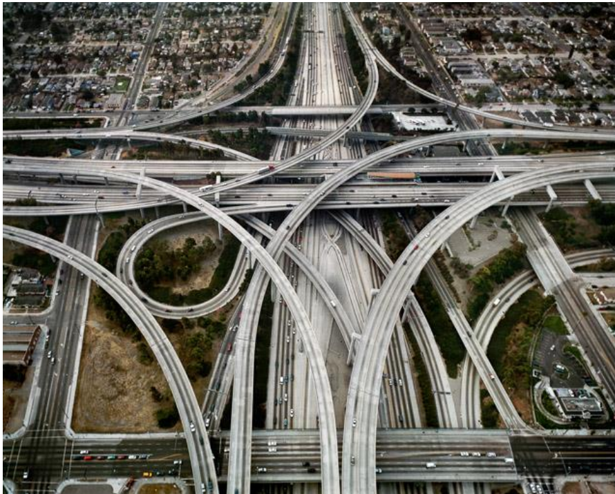
Fotografie č. 4 Edward Burtynsky, Highway #1, Los Angeles, California, USA, 2003.

Druhou tematickou skupinu tvoří snímky zachycující to, jak současný člověk tuto ropu využívá. Vidíme na nich současná města, dálnice, lidi soustředící se kolem vozidel a nesmírnou slavnostnost těchto okamžiků. 9 Sám Burtynsky v rozhovorech vypráví o výjimečném lidském připoutání k automobilům, strojům, že je to podle něj velmi důležitý a zároveň zhoubný prvek kultury. Zmiňuje se o tom v kontextu otázek, které pokládá ve svých dílech, konkrétně, co se stane se všemi těmito vozidly, až nám bude chybět ten nejvýznamnější neobnovitelný zdroj, jímž je ropa.