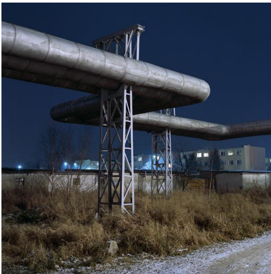
Fotografie č. 11 Łukasz Biderman, The city sleeps, Polska, 2010.

Szymon Rogiński ve svém cyklu „Poland Synthesis” uchopil podobnou tematiku fotografií, ale na svých snímcích představuje industriální krajinu jiným, mnohem temnějším způsobem. V letech 2003-2006 realizoval cyklus snímků spojených s krajinou Polska po transformaci. Fotografie také vznikaly v noci, často na cestách, umělé světlo na nich sehrává velice důležitou úlohu. Ve srovnání s Bidermanem Rogiński krajinu v noci izoluje, vybírá její určité součásti, které jsou někdy monochromatické, ale zároveň kontrastují s okolím. Na jeho fotografiích vidíme silnou inspiraci thrillery, horory nebo prvky ze světa počítačových her. Snímky jsou vysoce kontrastní, často na nich dominují barevné kontrasty a šerosvit. Složitost prvků vytváří syntézu mezi tak zvanou přírodní krajinou a vybranými industriálními součástmi současného Polska. Většina záběrů se opírá o klíčový světelný nebo barevný bod. Kompozice fotografií také často odkazuje na malířská díla.