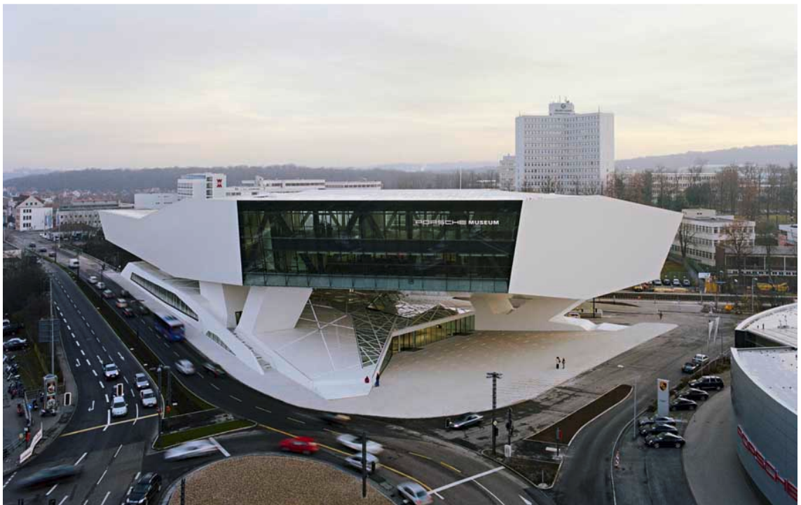
9. Hertha Hurnaus, Porsche museum, Stuttgart, 2008

Budovy vytváří a dotváří uměle formovanou krajinu obývanou lidmi. Architektura je stavěna v určitém kontextu. Úlohou architektonického fotografa je tento kontext pochopit, aby jej mohl dále zprostředkovat.