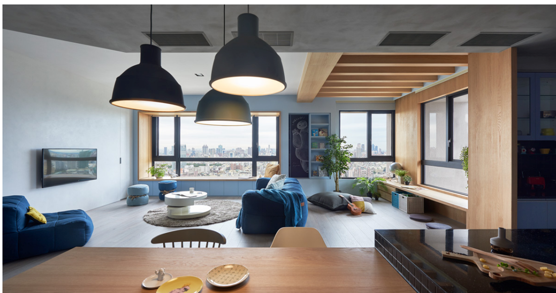
6, 7. Hey! Cheese, HAO Design, Apartmán pro rodinu s malými dětmi