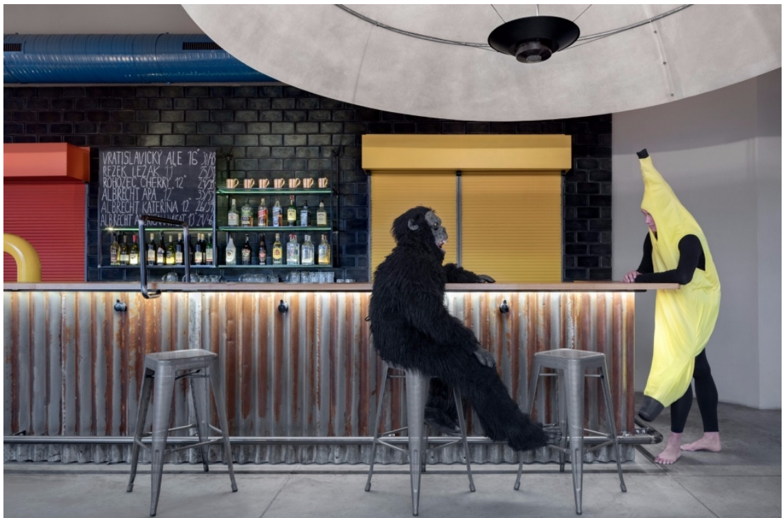
8. BoysPlayNice, Chicago Grill & Bar, Mjök architects, 2016

Každé médium kolem nás usiluje o naši pozornost, je obtížné zaujmout a vyniknout. Co by tedy měla architektonická fotografie obsahovat, aby se tak stalo? Podle kterých kritérií se vybírají fotografie, jež se otisknou či zveřejní v médiích?