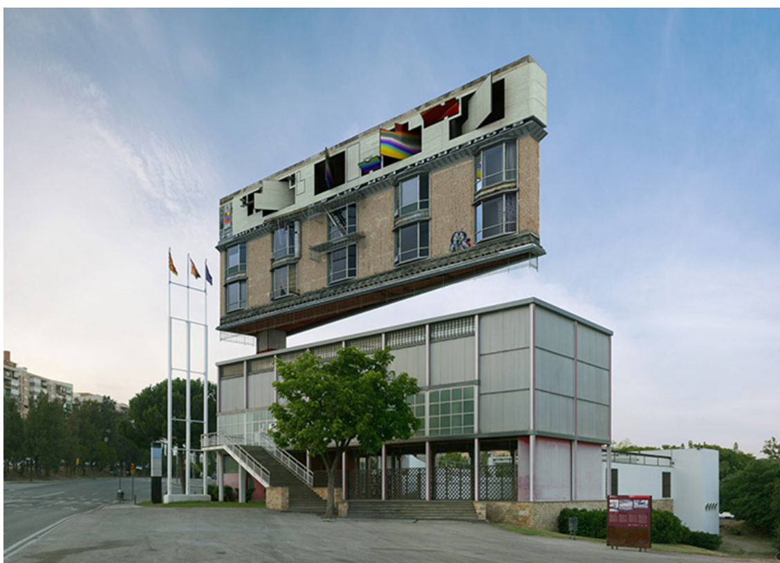
2. Victor Enfich, záměrná digitální manipulace v architektuře

Manipulace a inscenace existuje ve fotografii od počátků 2) , jen nebyla tak rozšířena z již zmíněných bariér související s tvorbou klasické analogové fotografie. Dnešní doba zpřístupnila potřebné nástroje pro manipulaci s obrazem i pro laiky. Co se postupem času však měnilo, byl rozsah manipulace, způsob provedení a jeho časová náročnost. Z fotografie se vytratil dřívější punc nezpochybňovaného svědectví.