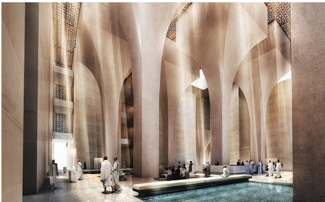
13. vizualizace, Foster + Partners, hotel complex in Mecca

V architektonické praxi se vizualizace běžně používají pro prezentaci konceptu. Například se vytváří 3D scéna, která zastupuje jedinečný prostor, který by si investor se svými zkušenostmi nedokázal představit. Postupem času se software pro tvorbu 3D modelů a renderovací algoritmy, které vytváří 2D obraz, natolik zdokonalily, že dokázaly velice věrohodně napodobovat fyzikální vlastnosti skutečného světa. Reálné využití vizualizací se s tímto pokrokem rychle rozrostlo.