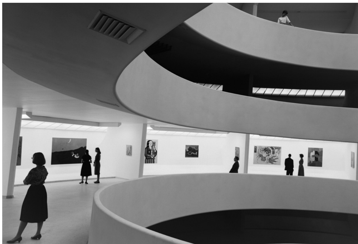
14. Ezra Stoller, Guggenheim museum, New York, architect Frank Lloyd Right

Není-li architektonický fotograf limitován etickými principy pořizování fotografie, které jsou známy hlavně u reportážních fotografů pro zpravodajství, má celkem nepřeborný počet možností jak výslednou fotografii ovlivnit.