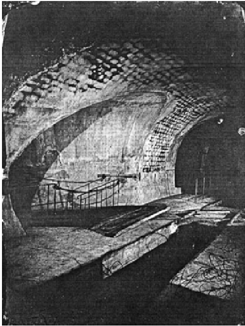
4. Nadar, Pařížské kanalizace, 1861

Další člověk, který se velkou měrou podílel na posouvání hranic a technologií ve fotografii, byl Nadar, vlastním jménem Gaspard-Félix Tournachon. Výzvy ho inspirovaly. Jako první vytvářel letecké snímky z balonu a snímky podzemí s využitím umělého osvětlení, experimentoval se záznamem pohybu, atd. Stal se jedním z prvních mistrů vizuální propagace.