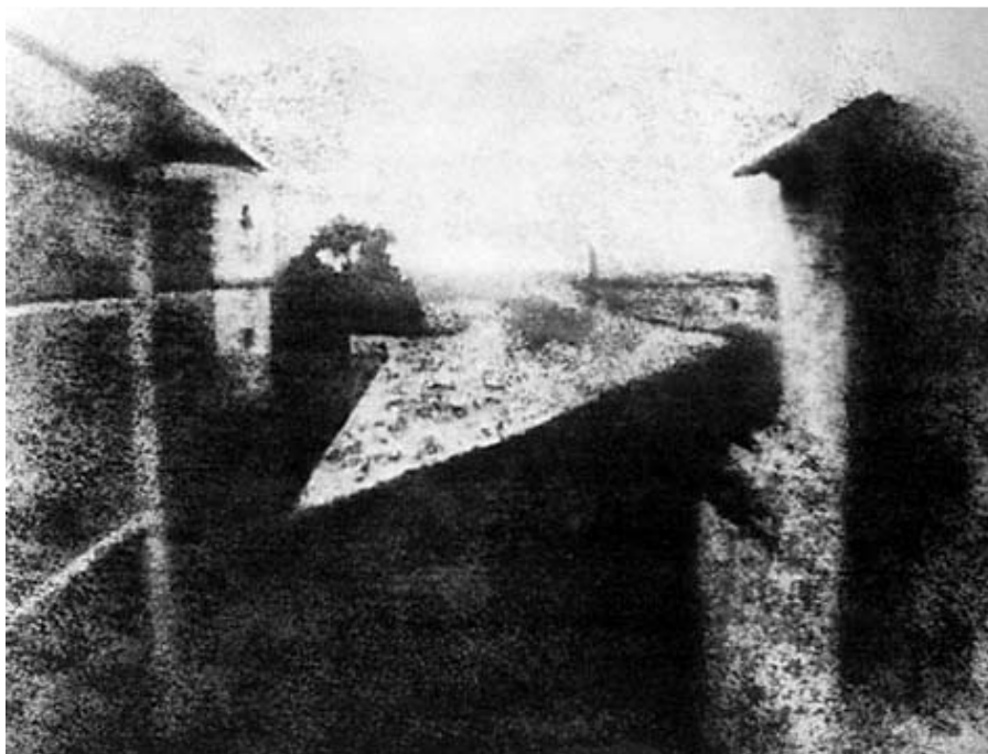
3. Nicéphore Niépce, Pohled z okna v Le Gras, 1826

Avšak technologie zásadním vlivem ovlivňovaly rozvoj a samotný vzhled fotografického obrazu.