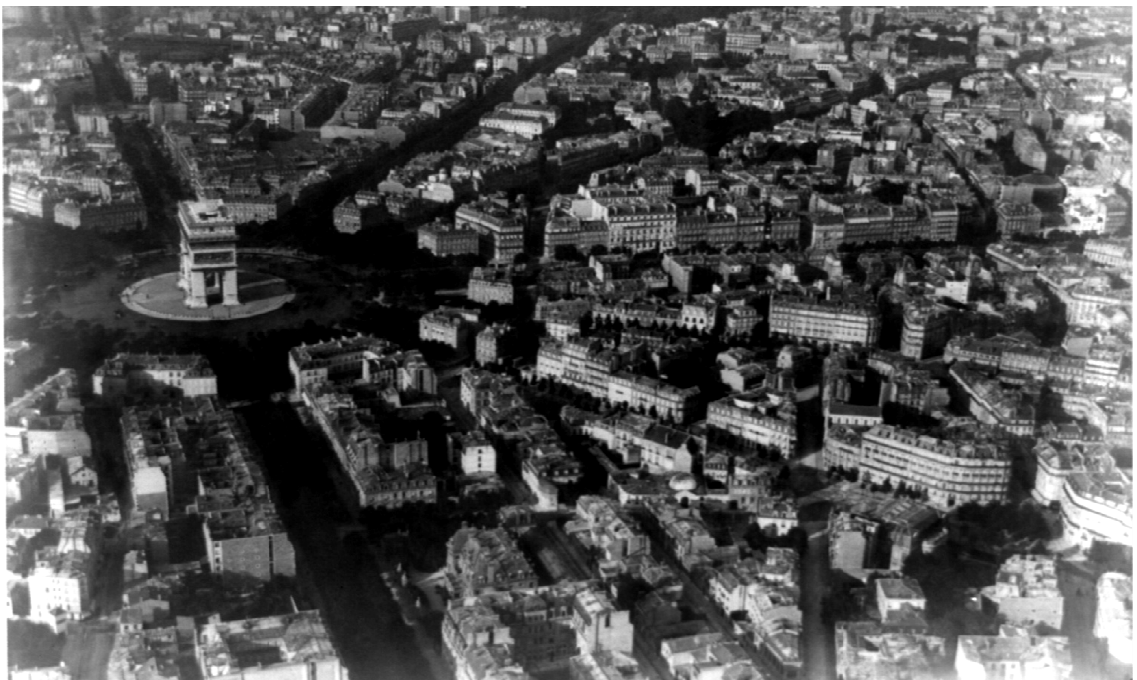
5. Nadar (Gaspard-Félix Tournachon), balonová fotografie urbanismu Paříže, 1867

Další člověk, který se velkou měrou podílel na posouvání hranic a technologií ve fotografii, byl Nadar, vlastním jménem Gaspard-Félix Tournachon. Výzvy ho inspirovaly. Jako první vytvářel letecké snímky z balonu a snímky podzemí s využitím umělého osvětlení, experimentoval se záznamem pohybu, atd. Stal se jedním z prvních mistrů vizuální propagace.