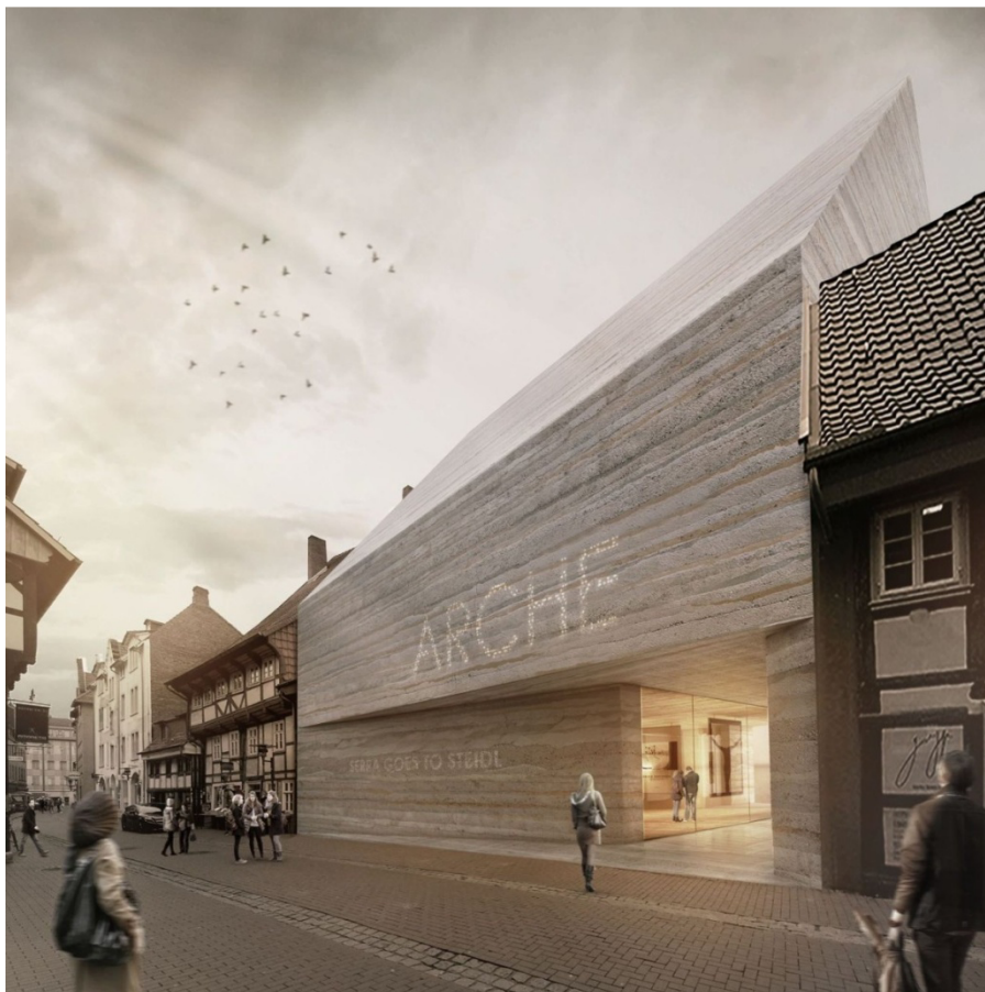
10. vizualizace, Atelier 30, KuQua Gallery

Společným znakem architektonické fotografie a vizualizace je, že prezentují prostorový předmět či scénu na plošném elektronickém či fyzickém médiu. Jedno ani druhé není ideálním zprostředkovatelem na prezentování prostorového objektu, jako je architektura. I tak jsou masově využívány, protože zatím neexistuje vhodnější a dostupnější médium.