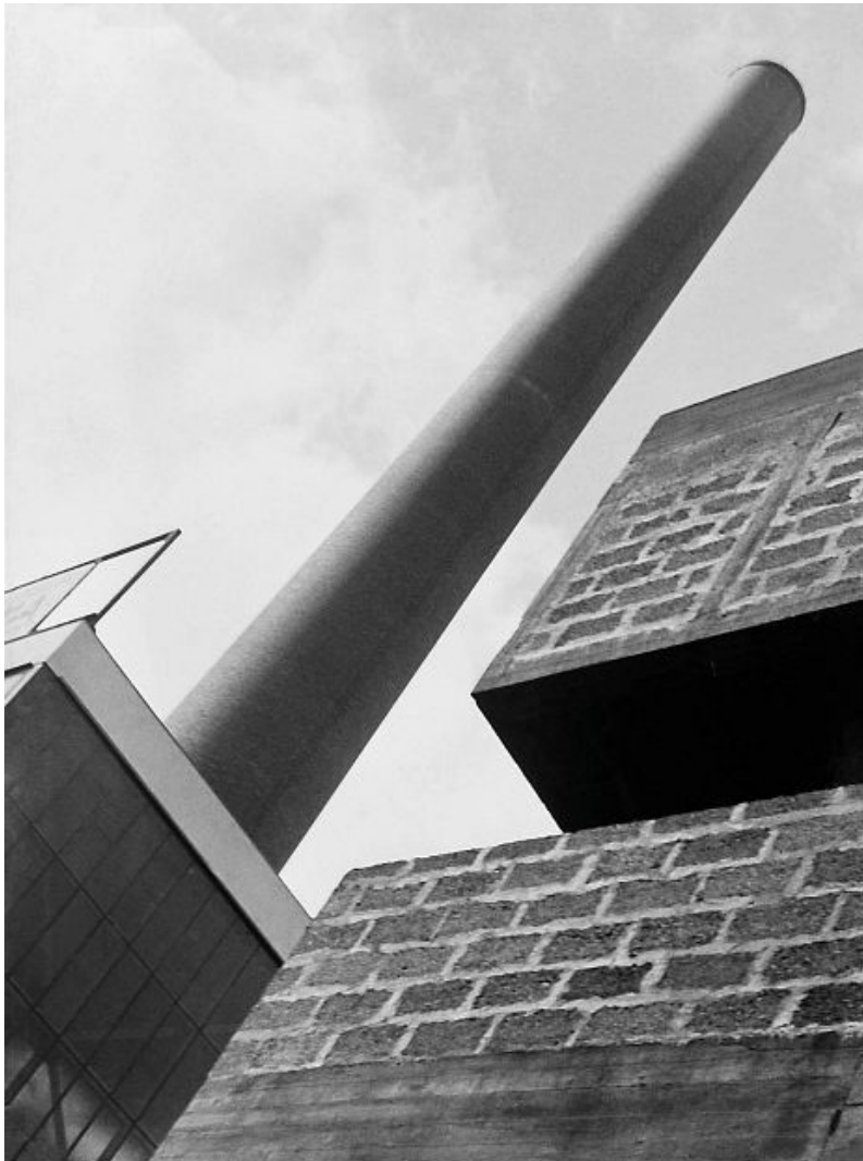
1. Jaromír Funke, Kolín, tepelná elektrárna, 1932

Dnes může být vším. Převážně se jedná o fotografické zachycení již dokončené budovy, do čehož jsou zahrnuty interiéry, exteriéry, včetně nejbližšího okolí. Způsob fotografického zachycení se odvíjí od aspektů důležitých pro zadavatele a tvůrce jakožto fotografa. Přičemž zadavatel a fotograf může být tatáž osoba.