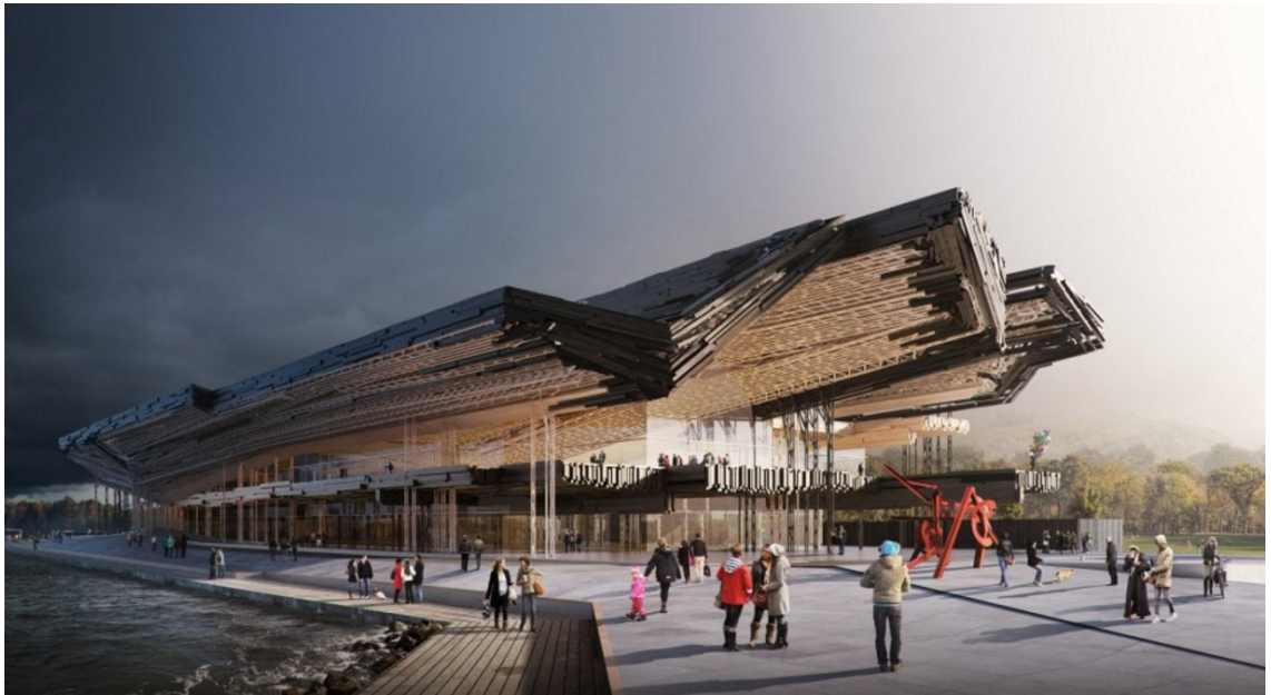
11. 3D model budovy bez nadefinovaných materiálů, 12. finální rendrovaný obraz dotvořený ve Photoshopu, Flyingarchitecture, Guggenheim Museum, Helsinky

Mluvíme-li o architektonické vizualizaci, je myšlena matematicky modelovaná scéna na základě definovaného trojrozměrného prostoru objektu pomocí specializovaného softwaru. Tato definice objektu je 3D model, který se dále používá například pro dvourozměrné zobrazení scény pomocí renderovacího procesu. V našem případě se jedná například o interiér nebo exteriér architektury, včetně dalšího prostředí dotvářejícího zamýšlenou atmosféru. Mnohdy se obraz ještě finalizuje v grafickém editoru.