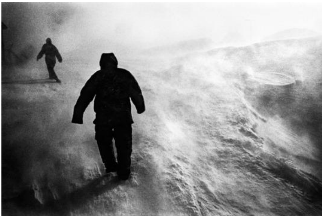
OBR. 26 JACOB AUE SOBOL, SABINE, GRÓNSKO.

Po návratu Sobol vydal fotografickou knihu nazvanou podle své múzy – „Sabine“, za kterou získal v roce 2005 nominaci na prestižní cenu Deutsche Börse. Projekt i kniha se stala obrovským úspěchem a pro samotného fotografa vstupenkou do celosvětově známé agentury Magnum Photos.