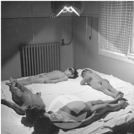
OBR. 17. JETTE BANGOVÁ , 1936, LÉČBA SVĚTLEM, QAQORTOQ, GRÓNSKO