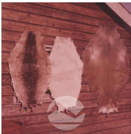
OBR. 16. JETTE BANGOVÁ , 1961, TULENÍ KŮŽE, SERMILIGAAQ, GRÓNSKO