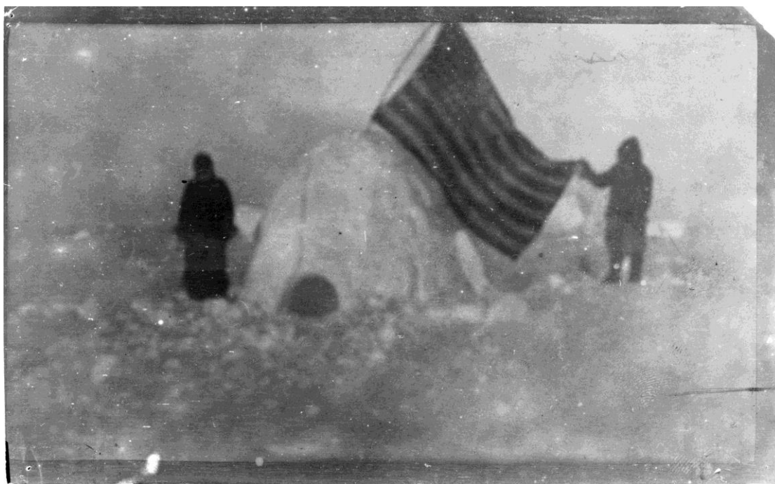
OBR. 5. FREDERICK COOK , 1909, DOKUMENTACE DOBYTÍ SEVERNÍHO PÓLU.

Fotografie odehrála zajímavou roli ve sporu o uznání dobytí Severního pólu. Konflikt se odehrál mezi dvěma cestovateli, Frederickem Cookem a Robertem Pearym. V roce 1909 oba ohlásili dobytí severního pólu. Absolvovali dvě nezávislé malé výpravy a obě byly doprovázeny malým počtem Inuitů. Oba také fotografovali, aby měli důkaz dobytí pólu, avšak s ohledem na nedostatek charakteristických orientačních bodů v této krajině, byly snímky a stejně tak i neúplné navigační údaje jako důkazy bezcenné.