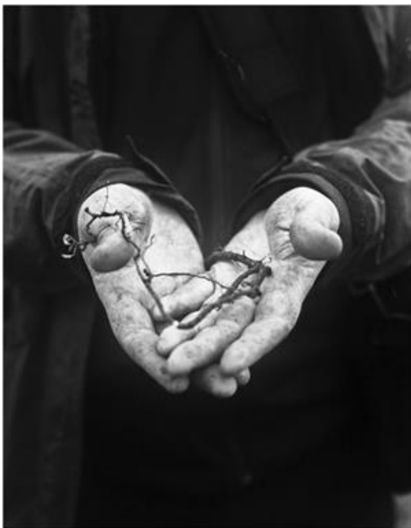
OBR. 30. ANNA SIELSKA, SALIX POLARIS, ŠPICBERKY