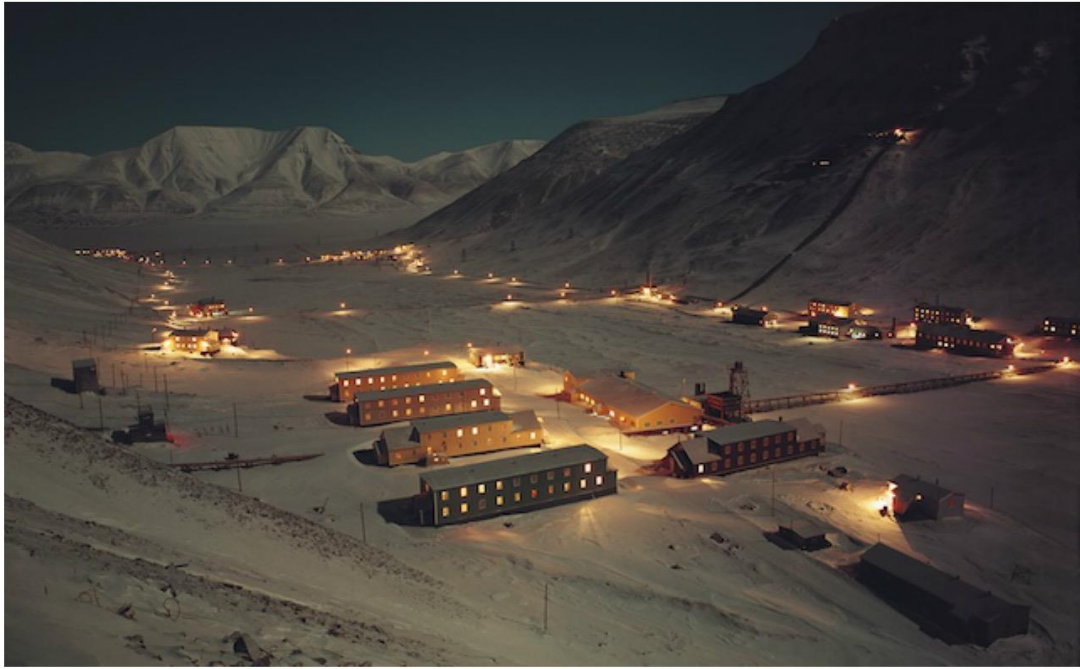
OBR. 7. HERTA GRONDAL , 50. A 60. LÉTA 20. STOLETÍ, LONGYARBYEN, ŠPICBERKY.

Ve dvacátém století, obzvláště v jeho první polovině, byly šachty hlavním poskytovatelem práce na Špicberkách, ale poskytované pouze mužům. Ženy tam měly vstup zakázán. Grondalové se však podařilo získat povolení pro vstup do dolů i fotografování. Díky tomu vzniklo velké množství záběrů pracujících horníků. Na snímku obr. 8 vidíme muže jedoucí na vagónu do dolu na svoji směnu. Na snímku vpravo obr. 9 vidíme horníka při práci.