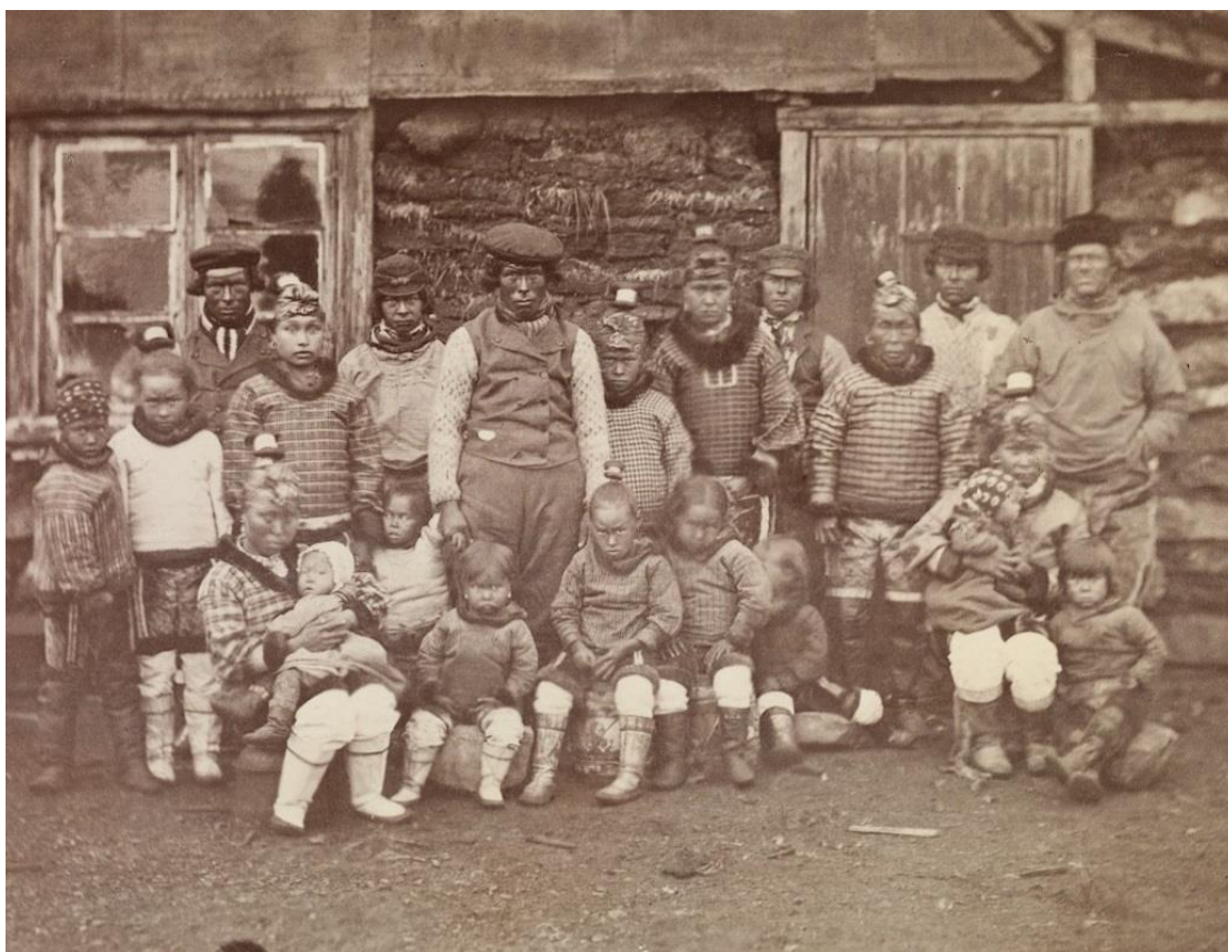
OBR. 4. WILLIAM BRADFORD, 1869, Z KNIHY ARCTIC REGIONS, GRÓNSKO