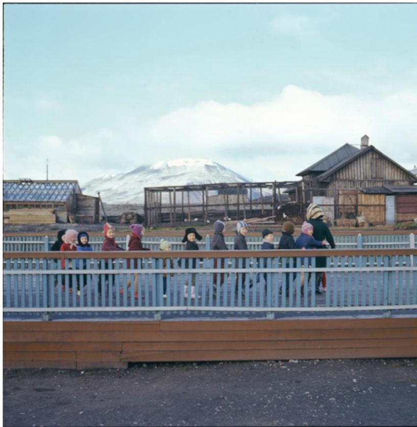
OBR. 12. HERTA GRONDAL, ŠPICBERKY