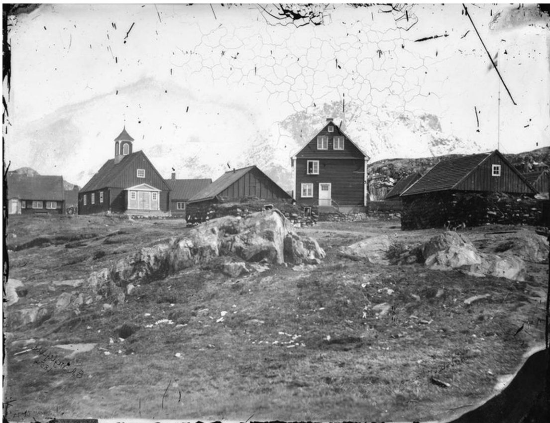
OBR. 3. EDWARD AUGUSTUS INGLEFIELD, 1854, GRÓNSKO

Sbírka obsahuje rovněž snímky lodních důstojníků a členů posádky, portrétů a skupinových snímků Islandců a mnoho záběrů přístavů a lodí. Mokřý kolodiový proces byl mnohem složitější než daguerrotypie nebo kalotypie, ale jeho nepochybnou výhodou byla možnost získat několik kopií, ale i lepší ostrost obrazu než v případě kalotypie. Začala být proto široce používanou cestujícími fotografy a můžeme říci, že se stala prvním „médiem dokumentaristů“.