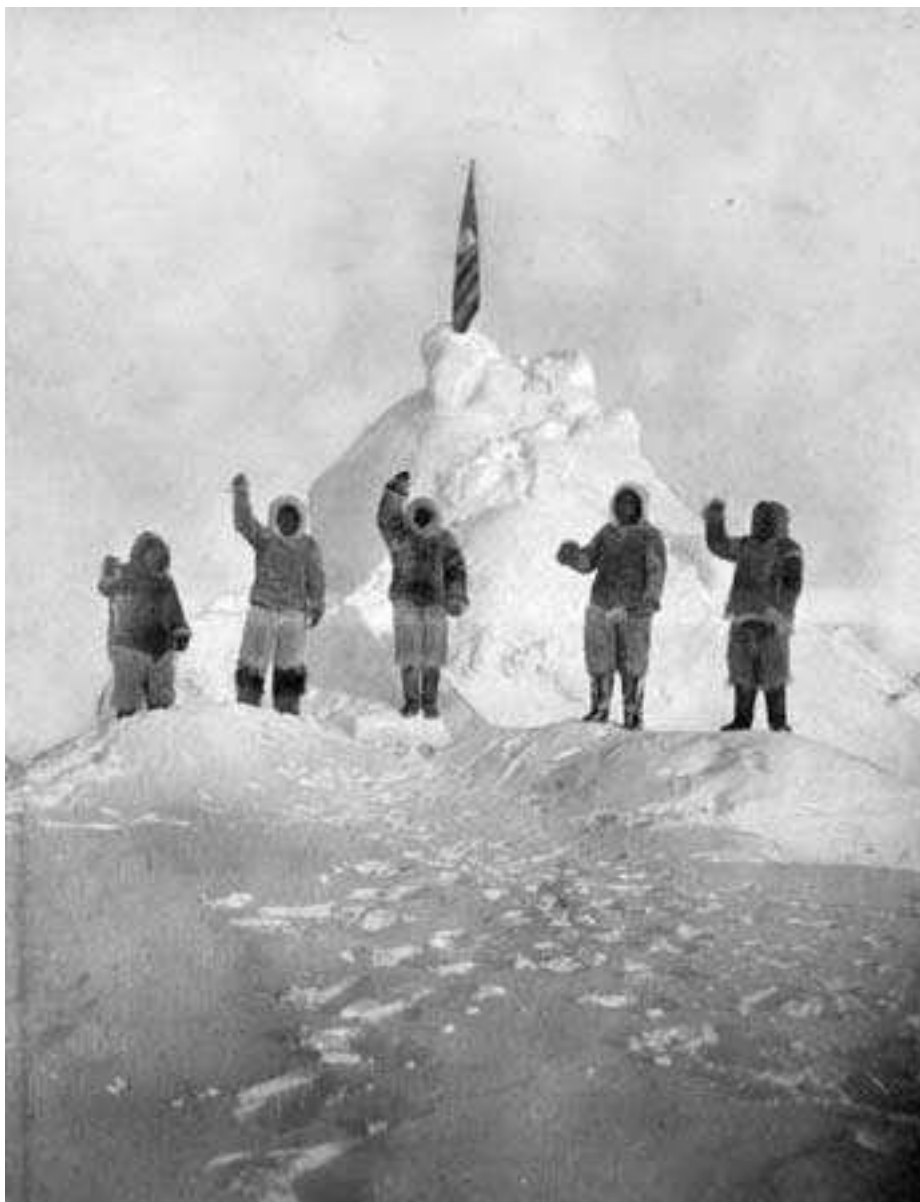
OBR. 6. ROBERT PEARY , 1909, DOKUMENTACE DOBYTÍ SEVERNÍHO PÓLU.

Spor o prvenství v dobytí severního pólu trval mnoho let a nakonec byly zásluhy za jeho dobytí přiznány Pearymu. V roce 1988 však magazín National Geographic publikoval článek, ve kterém Pearyho dobytí pólu zpochybňuje.