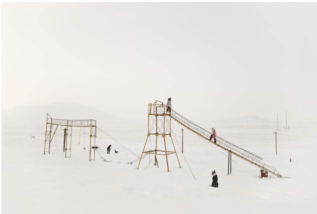
OBR. 28. EVGENIA ARBUGAEVA, TIKSI, RUSKO

Projekt Tiksi přinesl mladé fotografce mezinárodní uznání. V roce 2013 obdržela cenu Oscara Barnacka a svoje díla vystavuje na mnoha světových festivalech.