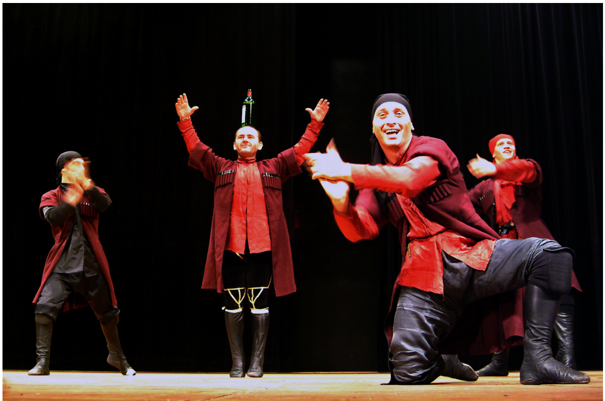
Fotografie zachycující scénu z jevištního vystoupení.