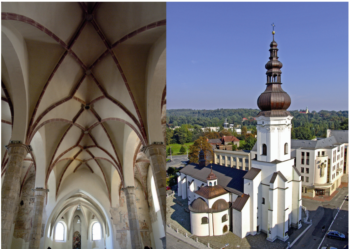
Fotografie z knihy Ostrava. Tvorbou Františka Řezníčka se od 90. let zaměřovala spíše na komerční zakázky. Jeho fotografie jsou také součástí mnoha propagačních materiálů Ostravy. Zachycoval proměny města.