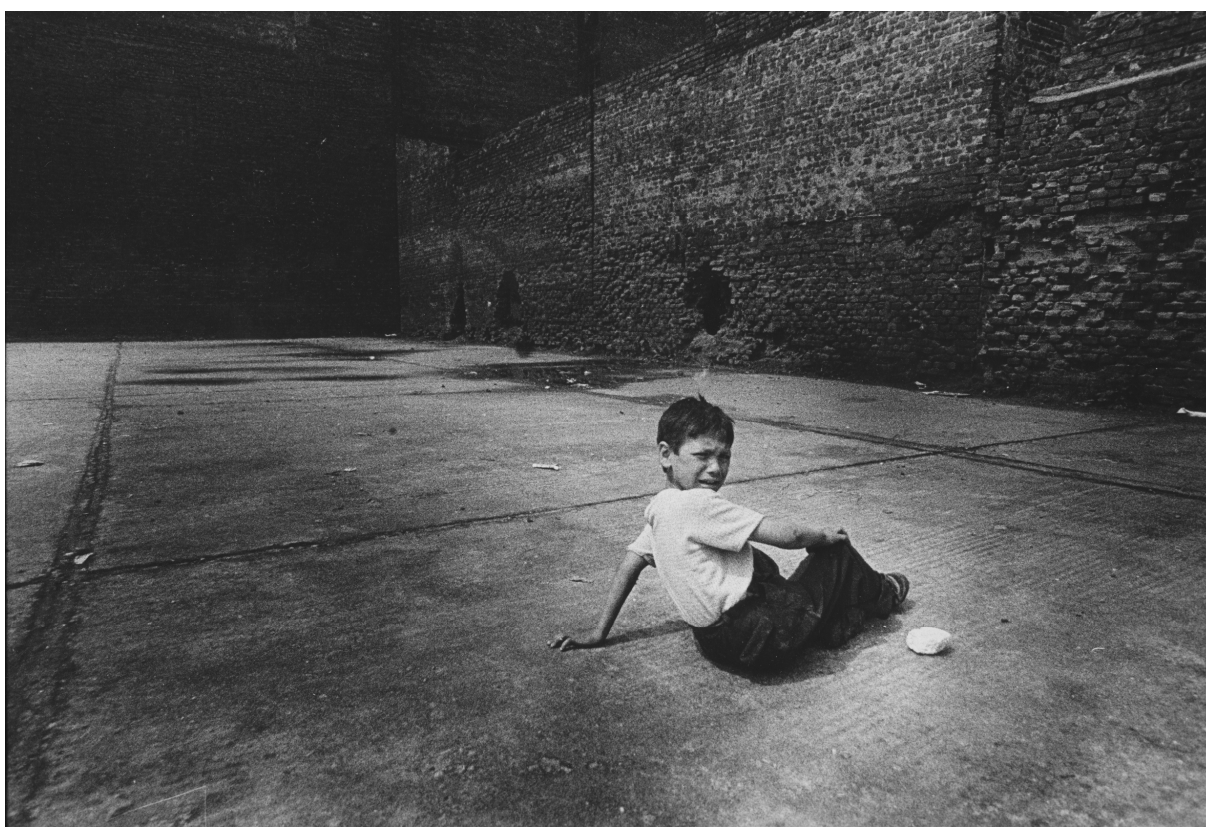
Fotografie z cyklu Cikáni. Tato fotografie je typickým příkladem dokumentární fotografie s humanistickým podtextem. V průběhu 80. let fotografoval František Řezníček ve své volné tvorbě převážně snímky tohoto charakteru. Jakoby vznikala celoživotní soubor s hlavním tématem člověk a jeho vztah ke světu.