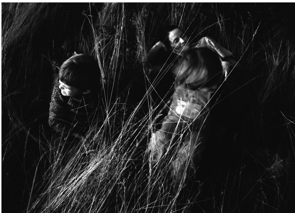
Emotivní snímek z 80. let.