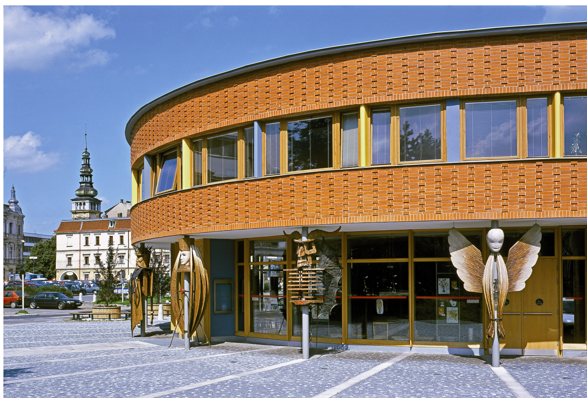
Klasičtější pojetí architektury. Na snímku je zachyceno Divadlo loutek a Stará radnice.