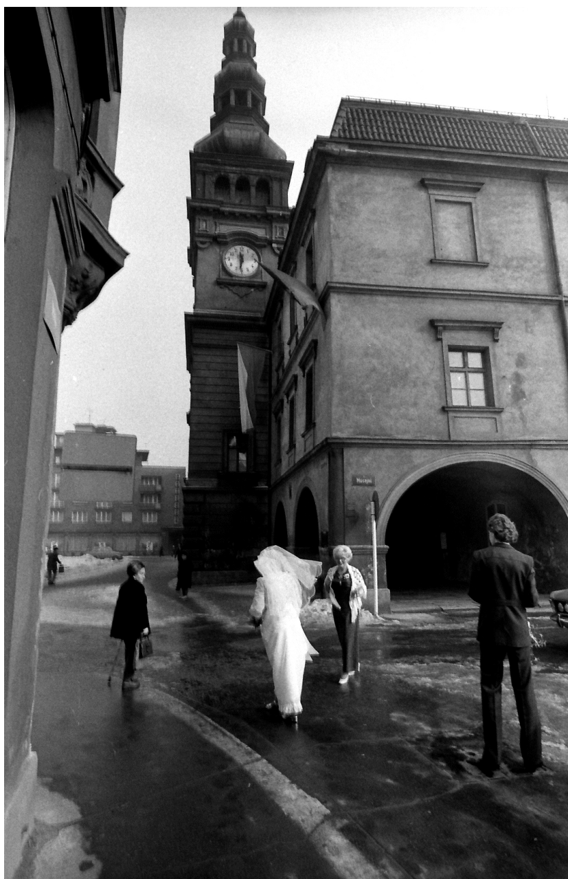
Člověk a jeho vztah k světu – paradoxní souvislosti.