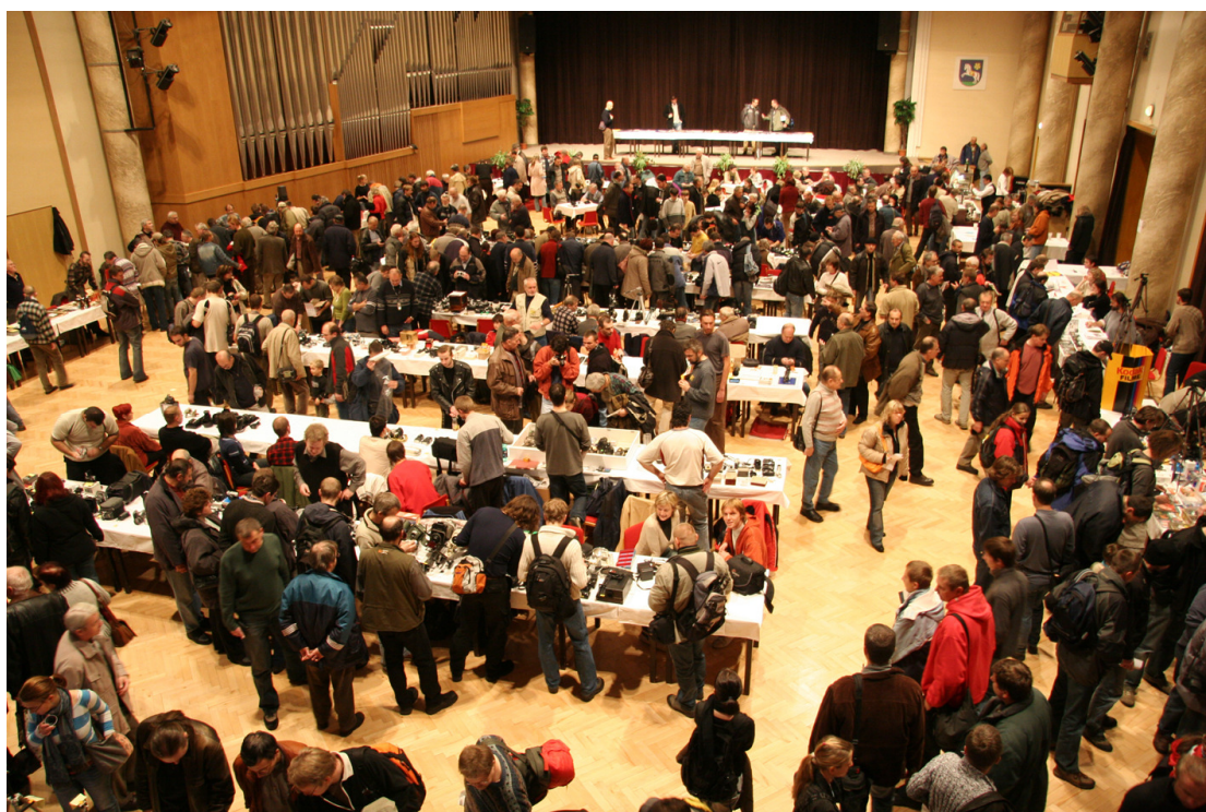
Snímek z jubilejního 40. setkání fotografů.