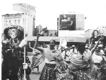
Na koncertě představení se Ostrava rozsvěcuje lidovými uměleckými díly věrně známými i hodně novými.

státního finále, které probíhá tradičně v květnu ve Velkých Losinách. Poslední dva ročníky Zpěváčků podpořil svou garan- ci světověznámý tenorista Peter Dvorský a letošní vítězové osm- ého ročníku soutěže zpívali v září na galakonzertu v pražském Kongresovém centru společně se slovenskými Sláviky. Podobně jako řadu dalších, i tento koncert natáčel pro své folklorní po- řady Český rozhlas.