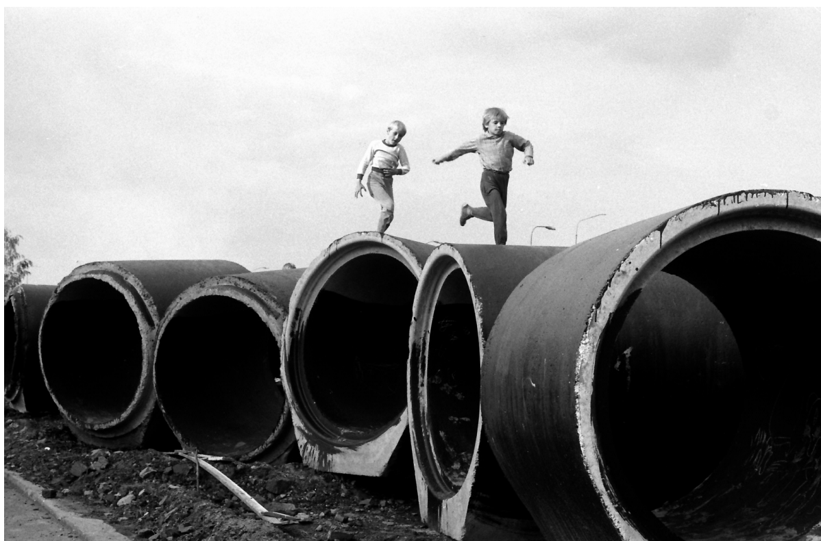
Fotografie z 80. let. Dokumentární fotografie z volné tvorby. Kontrast dětí, hrajících si v průmyslovém prostředí.