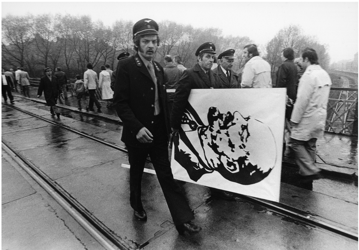
Snímek pořízený v 80. letech. Jedna z fotografií s kriticko-realistickým nábojem, spjatým s ideologií doby.