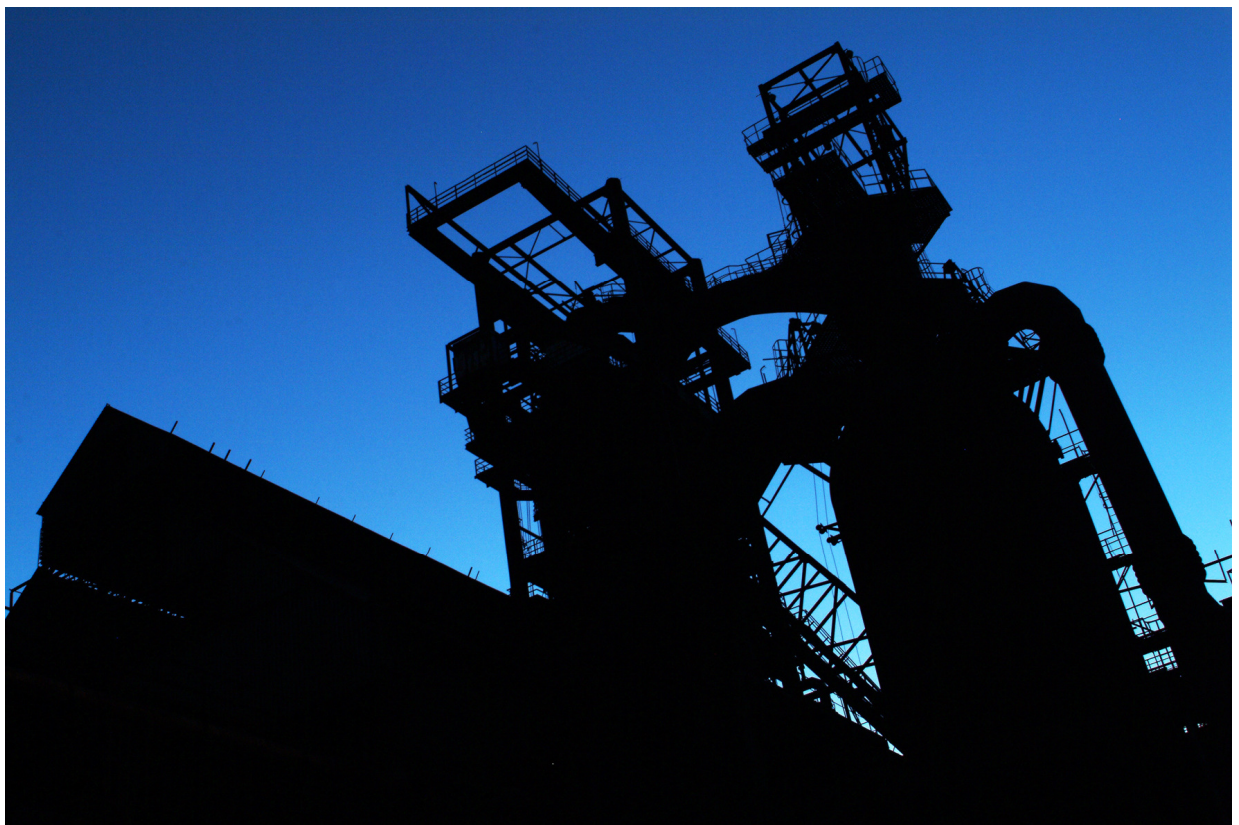
Vítkovice – Vysoké pece. Ostravské Hradčany tak, jak je zachytil František Řezníček při svítání.