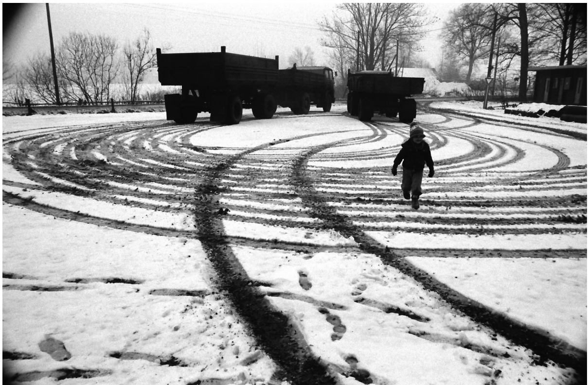
Využití abstraktního prvku ve fotografii s humanistickým podtextem.