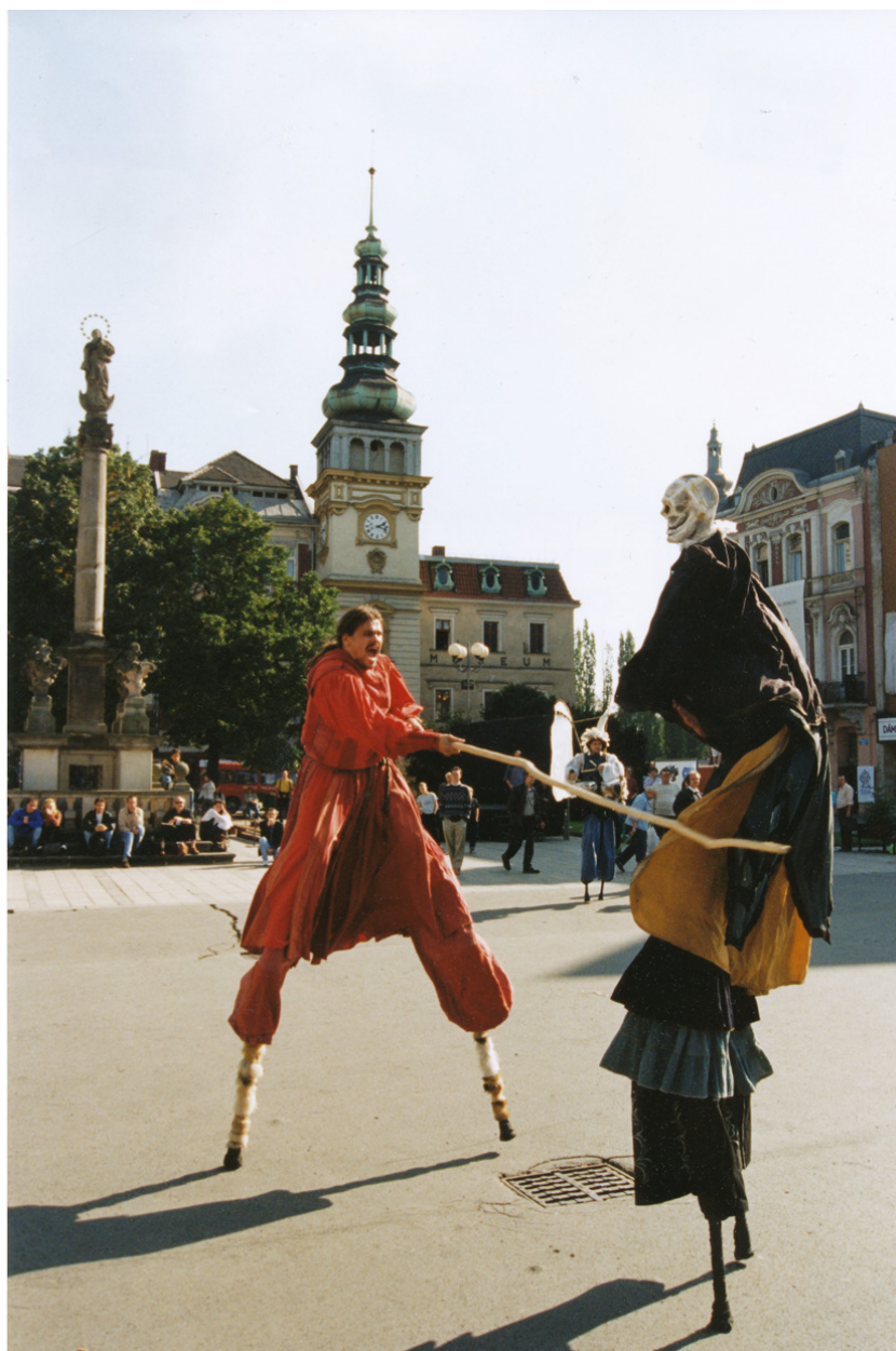
Ostrava, Masarykovo náměstí. Fotografie zachycující loutkářský festival Spectaculo Interesse.