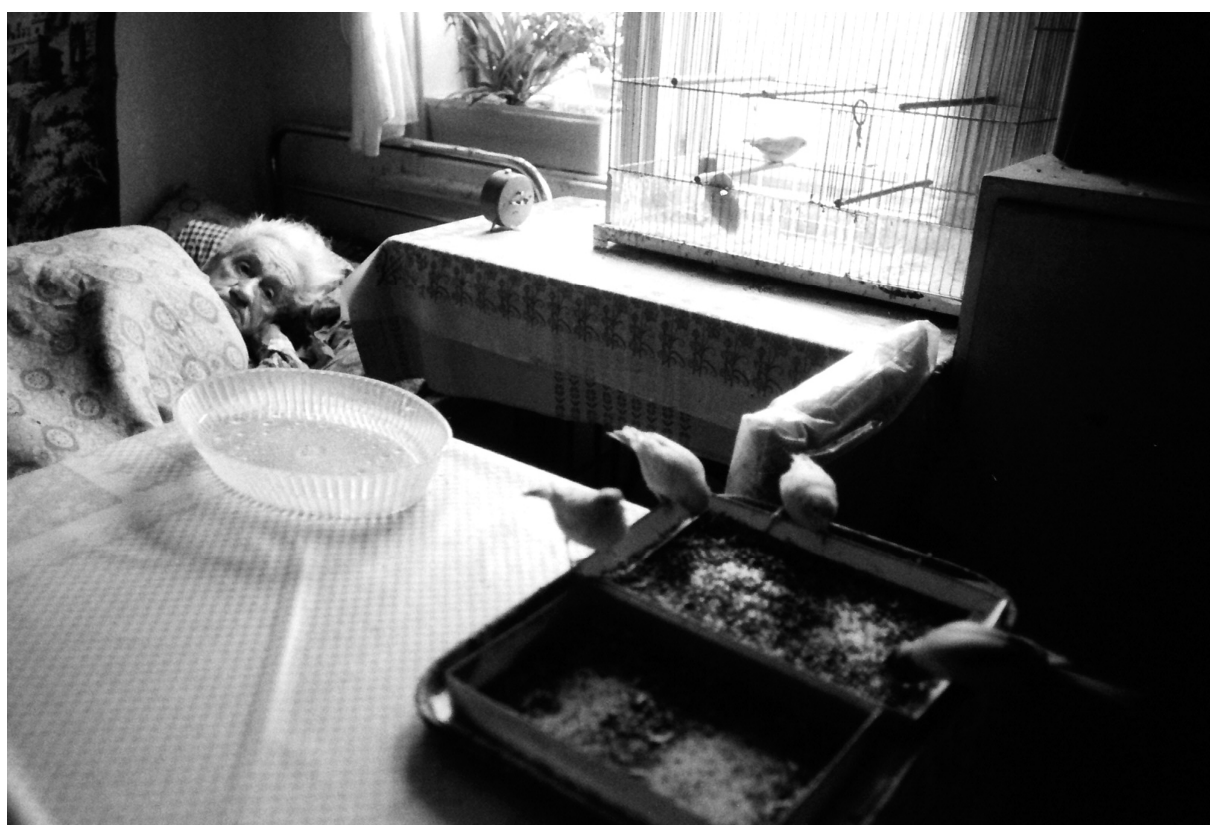
O fotografickém talentu Františka Řezníčka svědčí mnoho fotografií, které mají myšlenkový obsah, promyšlenou kompozici a více plánů.