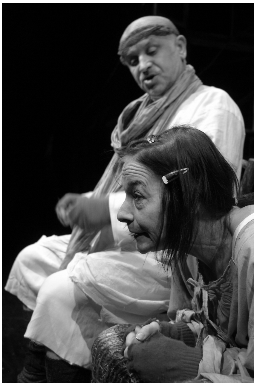
Komorní scéna Aréna, fotografie z inscenace Židle. Na tomto snímku je zachyceno gesto a psychologizace okamžiku.