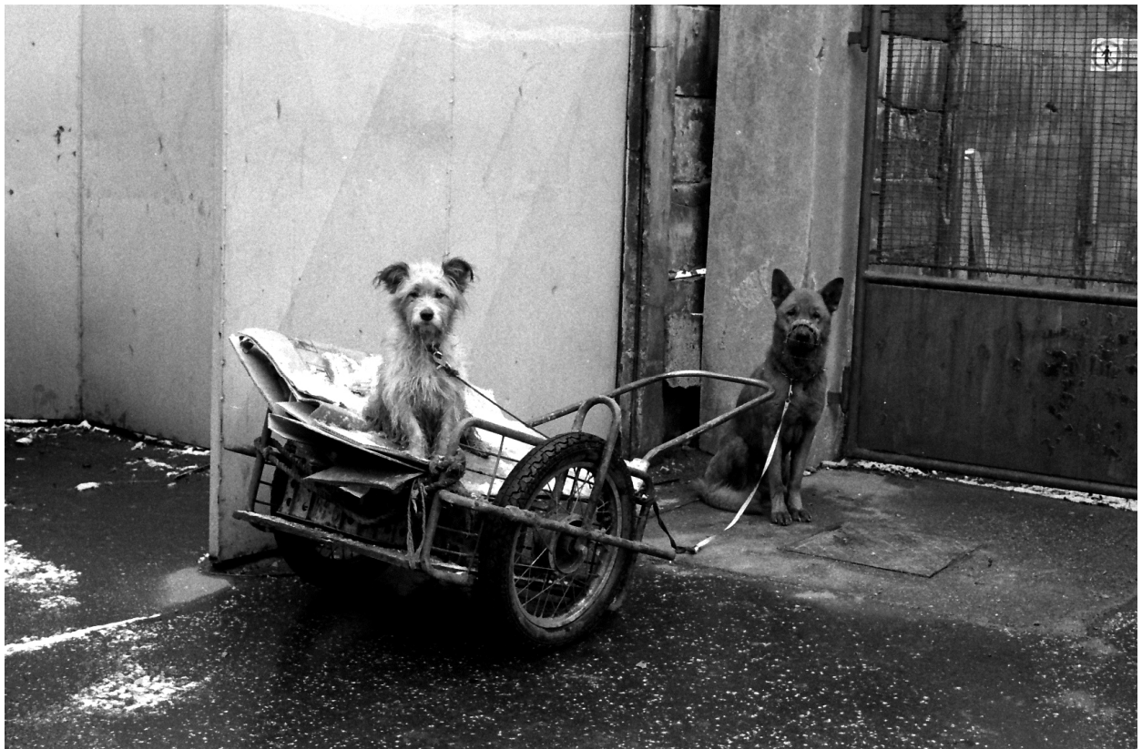
Fotografie z prostředí romské kolonie.