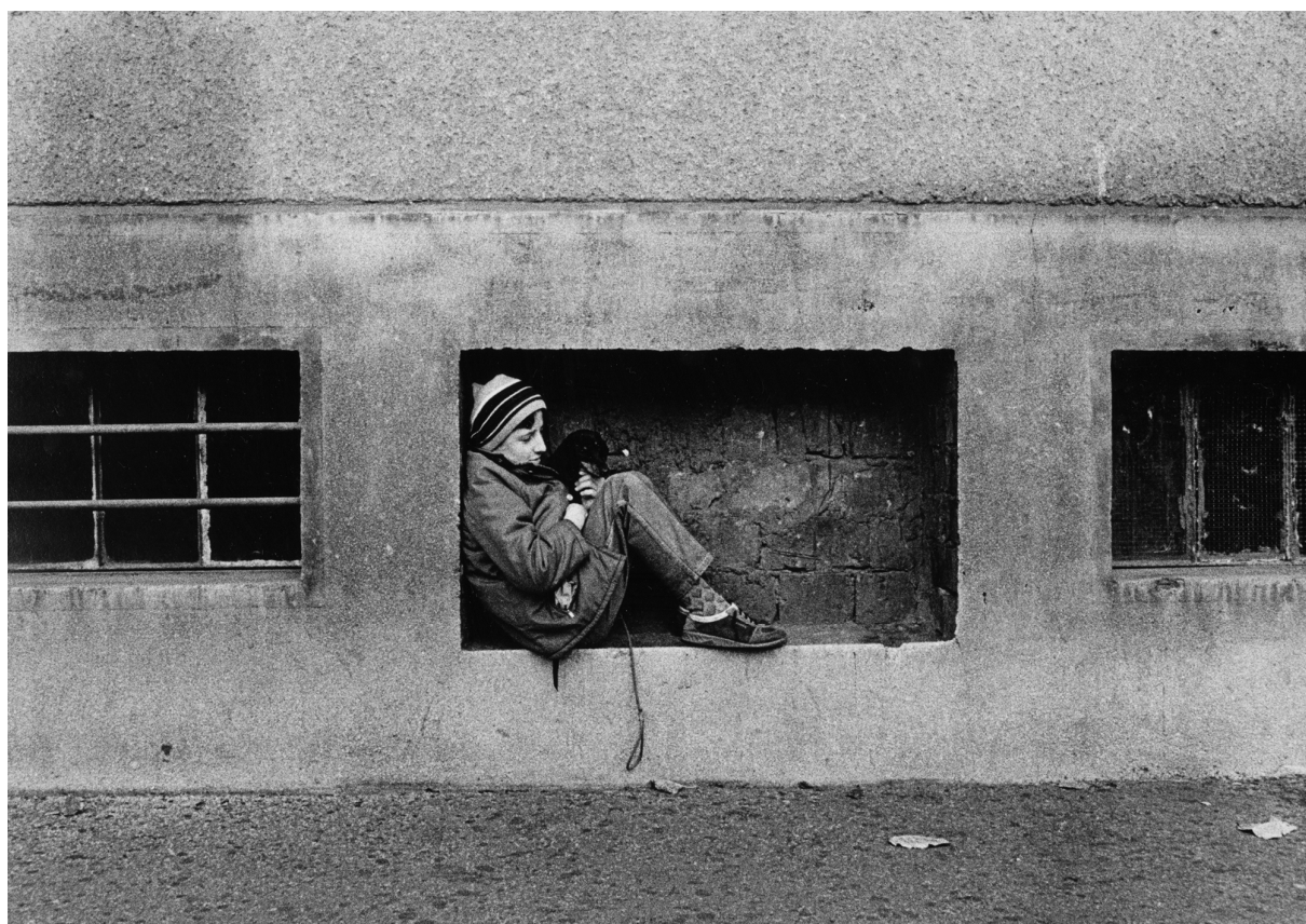
Fotografie chlapce se psem schovávajícího se před deštěm. Další fotografie z obsáhlého soukromého archivu Františka Řezníčka.