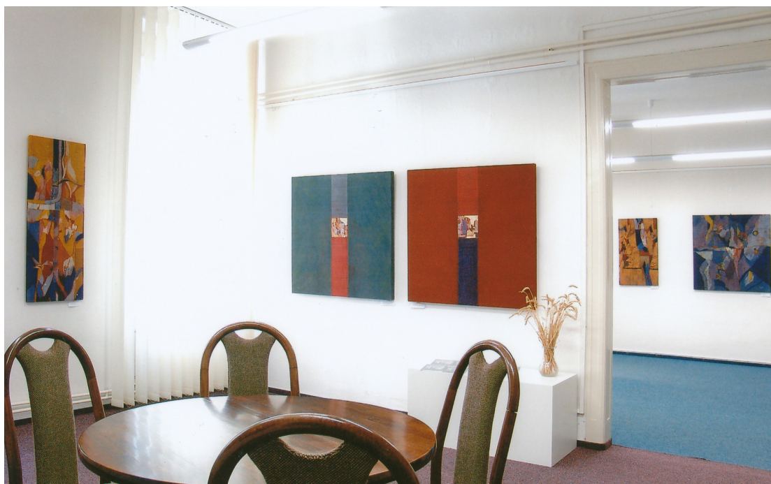
Interiér Galerie G7 na Chelčického ulici v Ostravě.