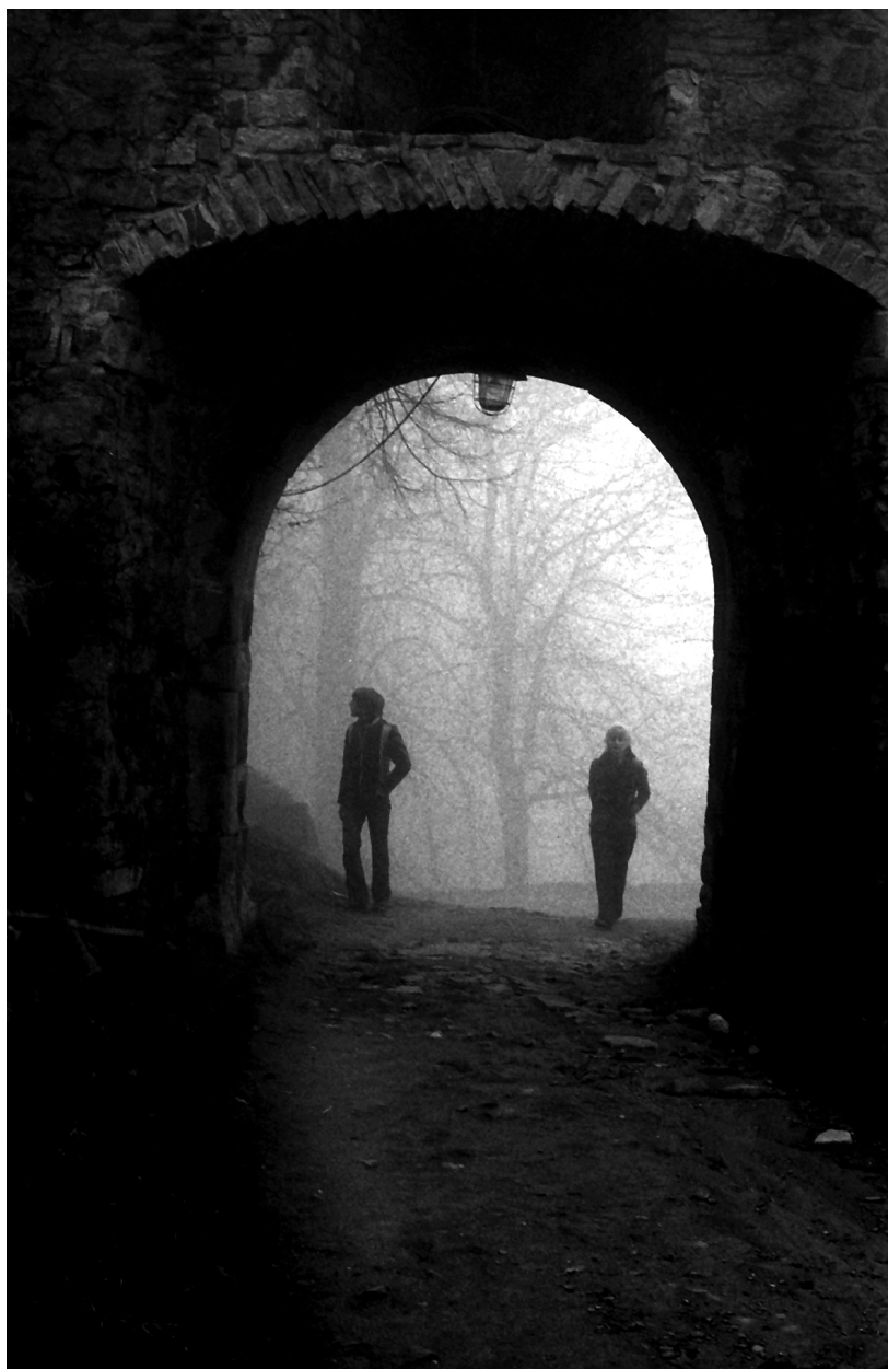
Lyricko-emoivní fotografie z Hukvald, charakteristická pro počáteční tvorbu Františka Řezníčka.