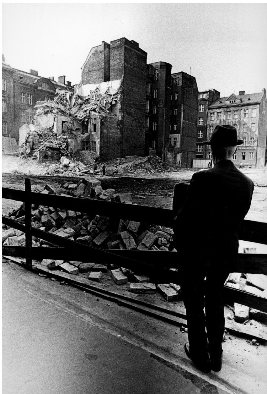
Člověk a jeho vztah k světu – nostalgie proměn.