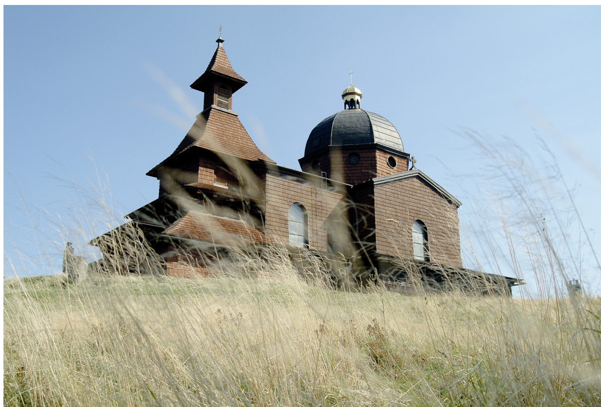
Jedna z fotografií zobrazených v knize Střípky z Moravy a Slezska Informativní fotografie s oblíbeným motivem sakrální stavby, vyfotografovaná z neobvyklé perspektivy.