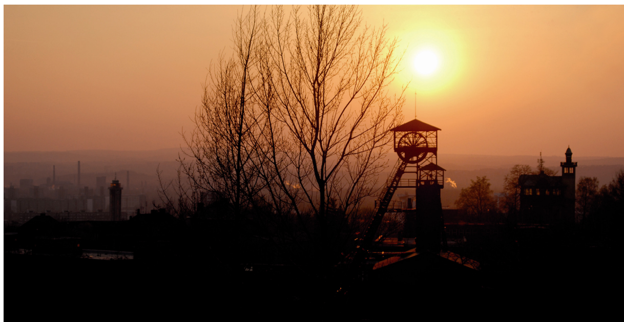
Jedna z mnoha fotografií industriální architektury Ostravy. Zde se jedná o fotografii informativní, avšak s emotivně pojatým motivem.