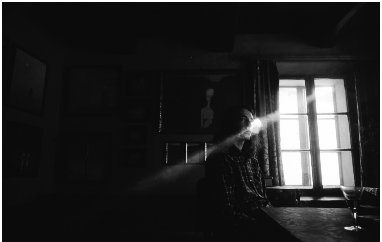
Emotivně laděný portrét.