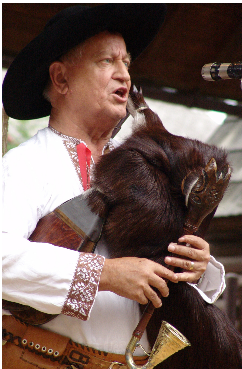
Dolní Lomná. Fotografie z folklorního festivalu Folklor bez hranic.