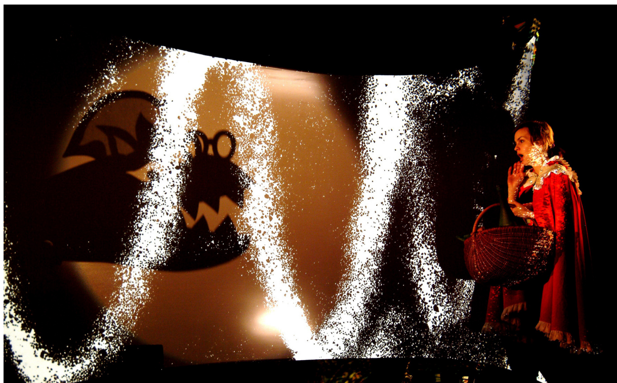
Divadlo loutek Ostrava, fotografie z inscenace Vlč.