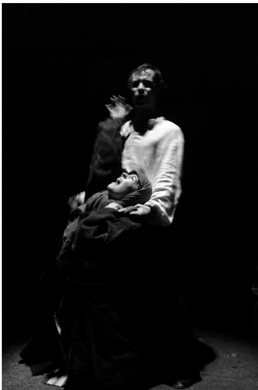
Komorní scéna Aréna, fotografie z inscenace Panočka. Snímek zachycuje výraz a dramatičnost situace.