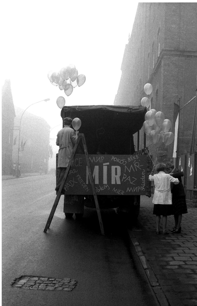
Další z kriticko-realistických fotografií 80. let.