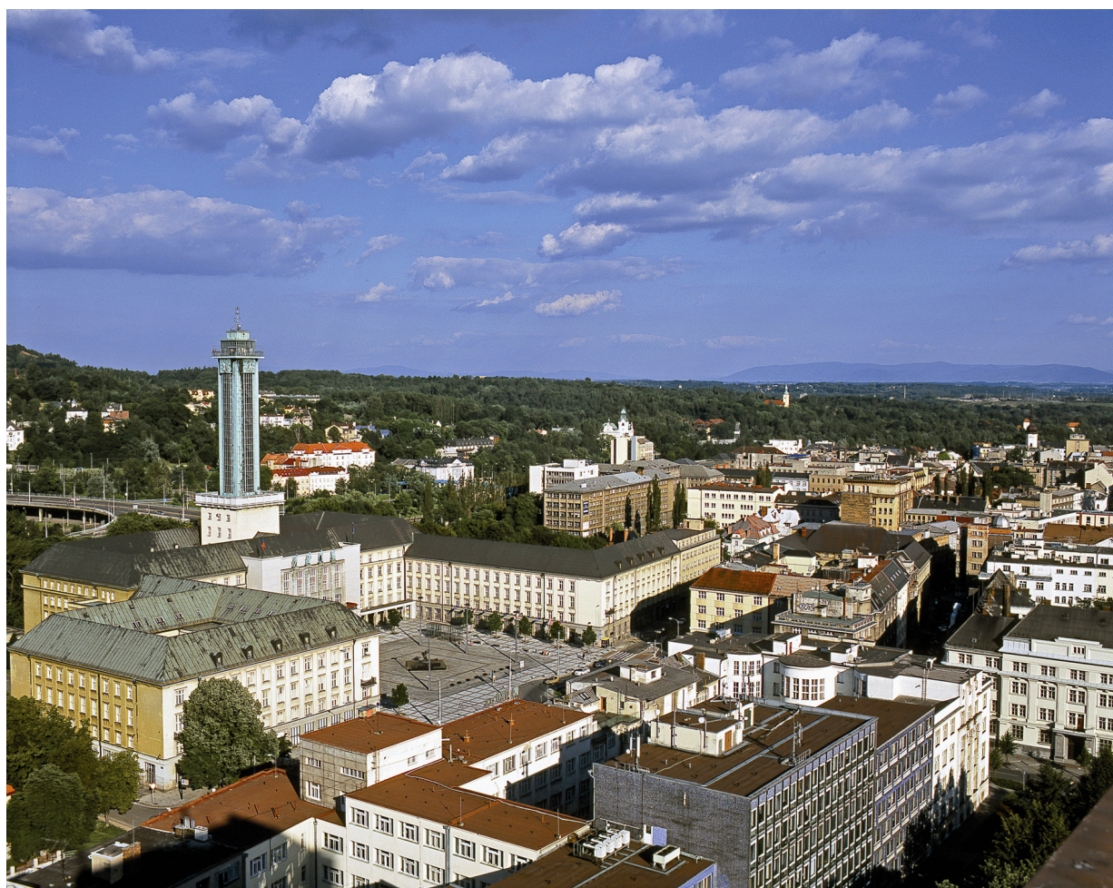
Fotografie publikovaná v knize Ostrava. Jeden z oblíbených motivů fotografií Františka Řezníčka – pohled na město s dominantou Nové radnice.