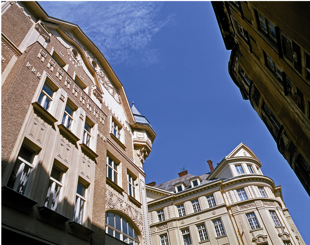
Ostravská architektura z netradiční perspektivy.