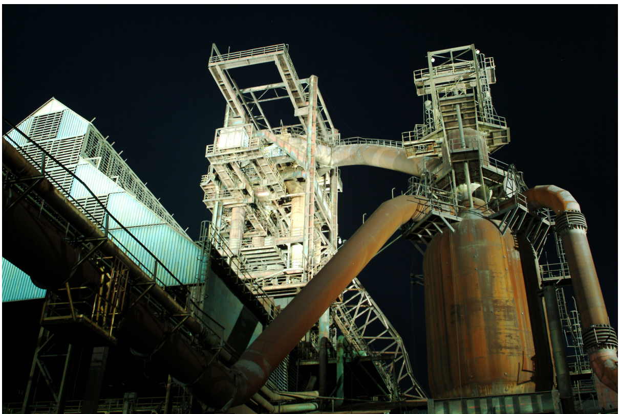
Vítkovice – Vysoké pece. Ostravské Hradčany tak, jak je zachytil František Řezníček v poetickém nočním osvětlení.