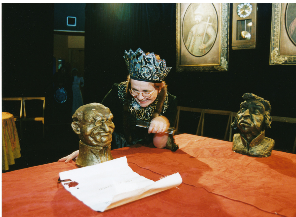
Divadlo loutek Ostrava, fotografie z inscenace Trumf.