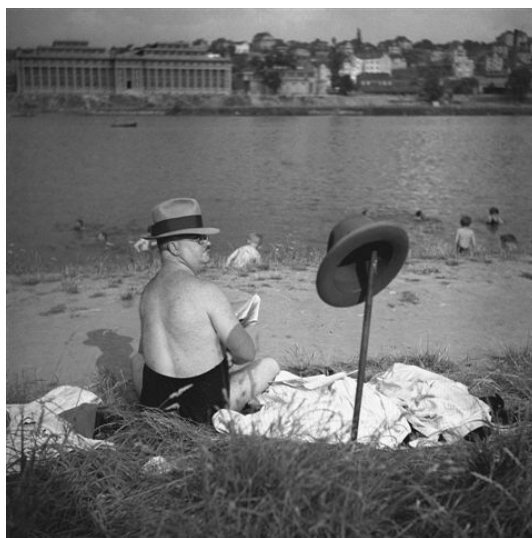
Václav Jirů: Na císařské louce, 1934

Václav Jirů svůj život prožil doslova s fotoaparátem v ruce. V šestnácti letech vstupuje do 1. československého klubu fotografů-amatérů v pražské Nekázance. „Zhruba od roku 1928 je spjat s tiskem. V té době obrázkové časopisy začínají vycházet v masových nákladech a vedle živnostenských fotografií, pohotově rozšiřujících působnost i na reportáž, jsou lákavou příležitostí pro mladou generaci fotografů ze záliby. A tak se se snímky Václava Jirů setkáváme nejprve v pražském Světozoru a Pestrém týdnu, brzy však i v časopisech zahraničních - v London News, Picture Post, Zeit im Bild, Lilliput a dalších. Vyrůstá v hvězdu magazínové fotografie na stránkách obrázkových časopisů třicátých let. Snad ve fotografii ani neexistuje oblast, jejíž výzvu by v té době nepřijal: od fotografie sportovní přes divadelní portrét, krajinu, akt, sociální tematiku až po dramatickou reportáž. A zvláště nad jeho snímky z napjatých okamžiků mobilizace v roce 1938 si vždy znovu uvědomujeme, jak velký byl vlastně reportérský talent.“ 3 Spolu s Karlem Hájkem a Janem Lukášem tvoří zakládající generaci českých fotoreportérů.