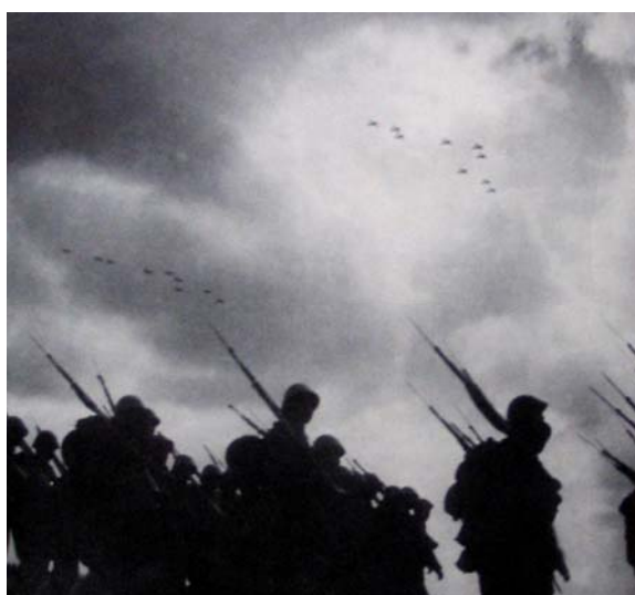
Václav Jirů: Nástup, 1936

Předválečnou tvorbu Václava Jirů lze rozdělit do tří základních celků: již zmíněné sociální snímky, snímky z okruhu divadla a umění a fotografie z vojenského prostředí. Nelze však nezmínit i jeho reklamní práce nepostrádající invenci a výtvarnost.