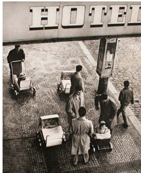
Josef Koudelka: Otcové