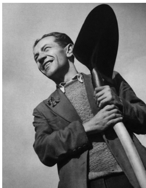
Václav Jírů: Mír, 1934

Václav Jírů vydává v roce 1954 publikaci nazvanou „O základních otázkách tvůrčí práce ve fotografii“. Jedná se v podstatě o učebnici fotografie, určenou pro amatérskou veřejnost i laiky, pracující s fotografií jako mediem. Kniha obsahuje mnoho ukázek dokumentujících text. Václav Jírů se v této knize opatrně snaží o myšlenkový návrat k estetice předválečné sociální fotografie, která na rozdíl od směru určovaného socialistickým realismem měla svou výtvarnou hodnotu. Svá tvrzení však formuluje velmi opatrně a dává si pozor, aby se nedostal do rozporu s oficiální propagandou. “Je třeba, aby fotografové výtvarníci nemuseli neustále překonávat obtíže vyplývající z nepochopení rozdílu mezi diletantským, nezáměrným snímkařením nebo suše řemeslnickou fotografií a záměrnou, uměleckou tvůrčí prací pokrokově smýšlejícího fotografa výtvarníka, který správně chápe dnešní velké úkoly všech umělců.” 7