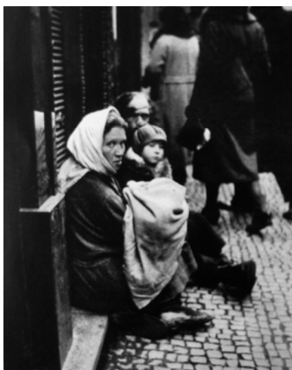
Václav Jirů: Bída, 1933

Je jedním z prvních českých fotografů, kteří se mezi světovými válkami vážně zabývají sociálním dokumentem. Ve třicátých letech minulého století se Václav Jirů začíná soustavně zabývat fenoménem chudoby v české společnosti, čímž se dost výrazně odlišuje od experimentálně pojaté tvorby české meziválečné fotografické avantgardy. K jeho typickým sociálním snímkům patří například „Bída“ (1933) nebo „Bílá hůl“ (1934).