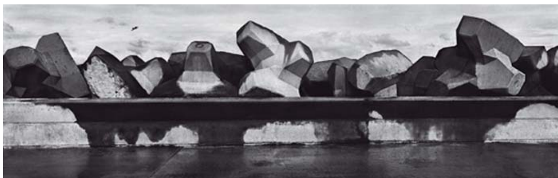
Obr. 4 Foto: Josef Koudelka / Magnum Photos, Nord-Pas-de-Calais Francie, 1989

Camargue – Projekt vznikl z popudu organizace Conservatoire du Littoral, která má na starosti ochranu přírody francouzského pobřeží. Koudelka, který nikdy neměl zájem fotografovat idylické krajiny, se tohoto projektu zúčastnil, protože pro něj měla svou povahou osobní kouzlo. Je to rovinatá krajina, která je pro své močály, divokost a mokřady prostá jakékoliv líbeznosti a prvoplánové krásy. Byla to krajina, mnoho let člověkem nechána svému osudu, a jako takovou, nepoddajnou silou žijící krajinu, ji Koudelka zachytil. Její rovinatost byla pro Koudelku jednou z mnoha překážek, se kterou se musel při fotografování Camargue vyrovnat.