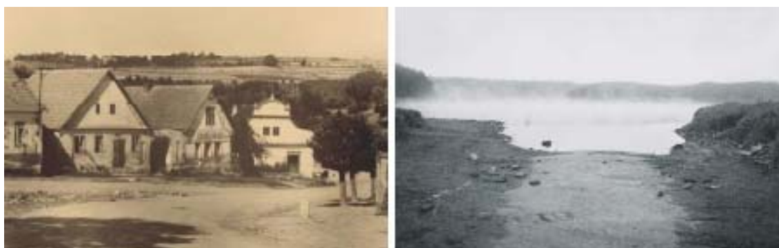
Obr. 8 Fotografie zapůjčená autorce obyvateli Zahrádky (vlevo) v porovnání s fotografií Aleny Dvořákové (vpravo)

Druhým fotografickým projektem, který jsem do této kapitoly zařadil, je částečně komparativní projekt Aleny Dvořákové s názvem Zahrádka na Želivce . Na rozdíl od Letem českým světem se autorka zaměřila na jedno místo, na jednu obec, která musela ustoupit vodní nádrži Želivka. Obec, ze které se zachoval pouze kostelík, socha Panny Marie, hřbitov a několik přístupových cest, které nyní míří pod hladinu obřího reservoáru pitné vody.