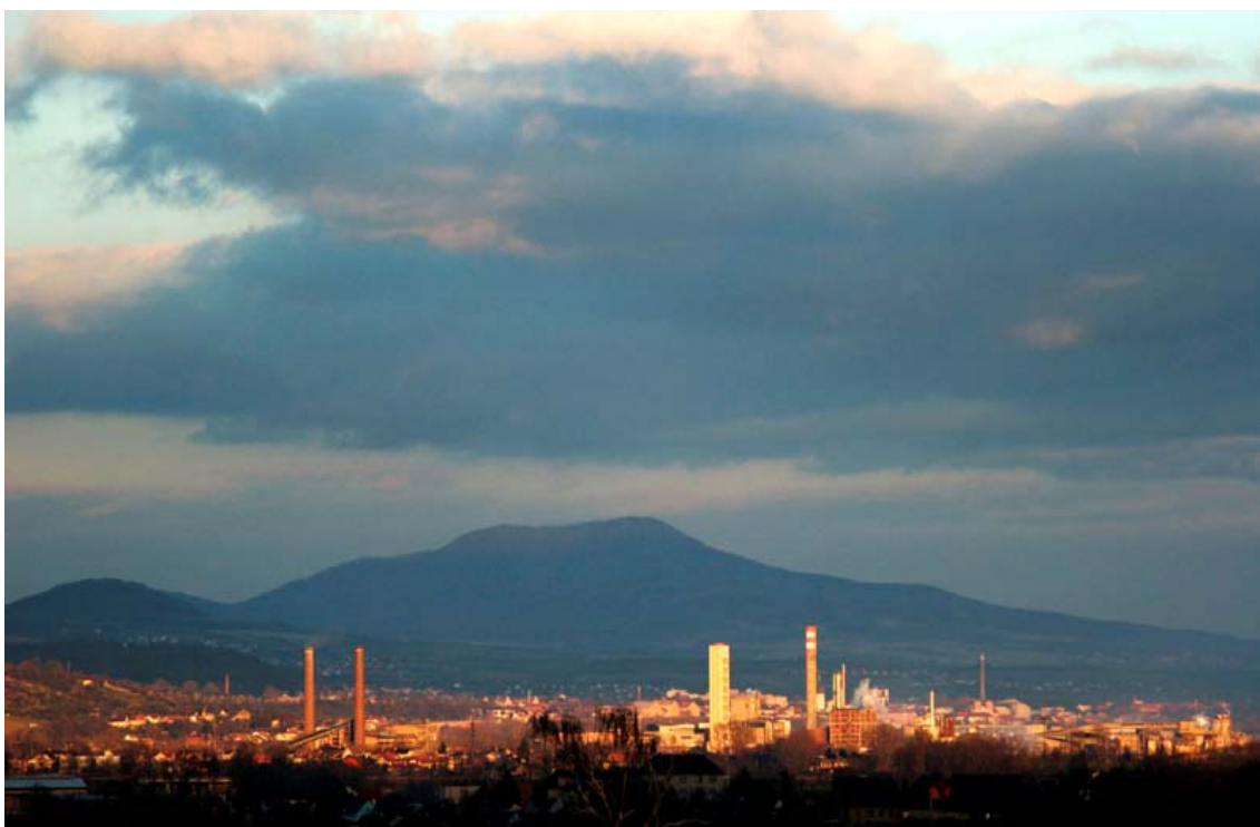
Obr. 6 / Foto: Jan Hodač, Glanzstoff Bohemia, projekt Fabrica Bohemica

Fotografie jsou až na výjimky špatné a laciné a po autorově filosofickém vnímání krajiny ani památky. Zřejmě zájem o tyto fotografie způsobil jejich veliký formát a pestré barvy. Fabrica-Bohemica byl oficiálním kulturním programem českého předsednictví Evropské unii v roce 2009. Kupodivu.