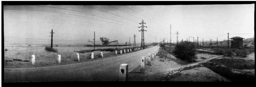
Obr. 1 / Foto:Josef Sudek Od Komořan ke Quidu, cyklus Smutná krajina , 1957–1962

Ekologie před rokem 1989 nebyla státem uznanou vědní disciplínou a oficiální podoby začalo ekologické hnutí nabývat až roku 1978 založením Ekologické sekce Biologické společnosti při ČSA. Toto je příznačné i pro českou ekologickou fotografii. Komunistický stát vytvářel všemi prostředky zdání ráje a dokonalé společnosti, a snímky, dokumentující stav krajiny a ekologie, i ty do té doby nejzásadnější (Josef Sudek – Smutná krajina ), se dočkaly zveřejnění daleko po roce 1989.