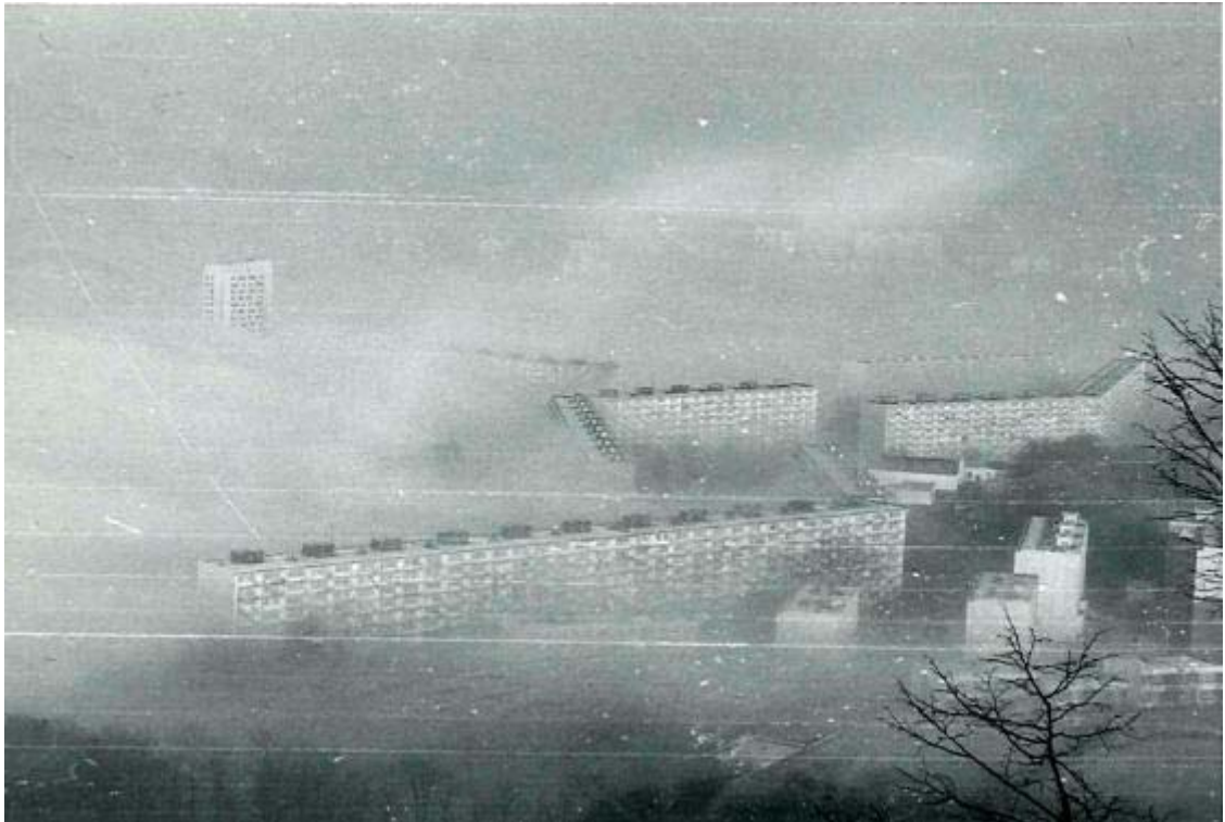
Obr. 7 / Podzim 1989 a smog nad Teplicemi. Pohled na Šanov II z Doubravky