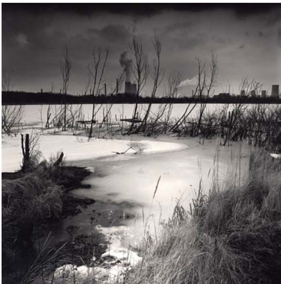
Obr. 5 Foto: Aleš Waksmundský, Horní Jiřetín, cyklus Smutné krajiny , 2002

Takto přesně zhodnotil Koudelkovy fotografie z cyklu Chaos Jiří Zahradnický. Nezbyvá než dodat, že takto lze charakterizovat až na výjimky většinu fotografií z Koudelkových ekologických cyklů.