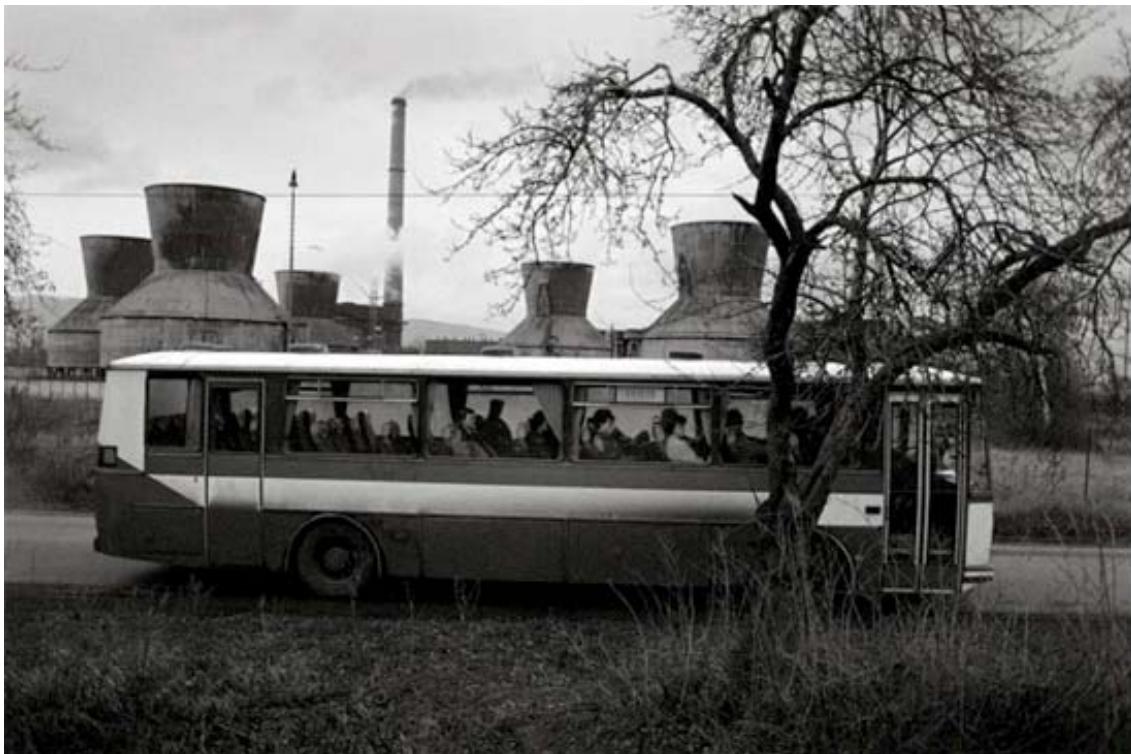
Obr. 15 kniha Vanishing , severní Čechy, 90. léta

Vrcholu současné doby v ekologické fotografii dosahuje dle mých měřítek Antonín Kratochvíl . Jeho práce s ekologickou tematikou jsou angažované, burcující, zneklidňující.