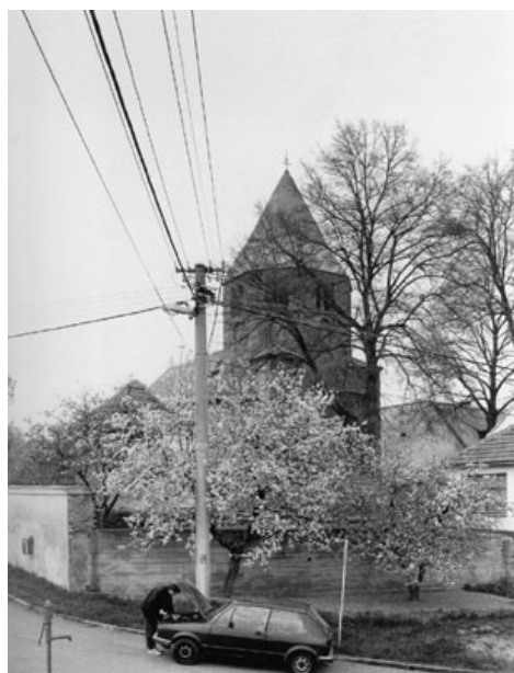
Fotografie z knihy Letem českým Světem vydané roku 1999, str. 340, 341

Ekologické téma se v něm vedle společensko-vědních témat objevuje sice jakoby mimochodně, avšak lépe si podle něj můžeme uvědomit drobné nuance lidských zásahů do krajiny a životního prostředí. Při prohlížení snímků je nutné si uvědomit, že člověk jako v mnoha jiných případech nemusí zničit krajinu najednou, ale postupně, a že změnou krajiny a svého životního prostředí platí za svůj blahobyt.