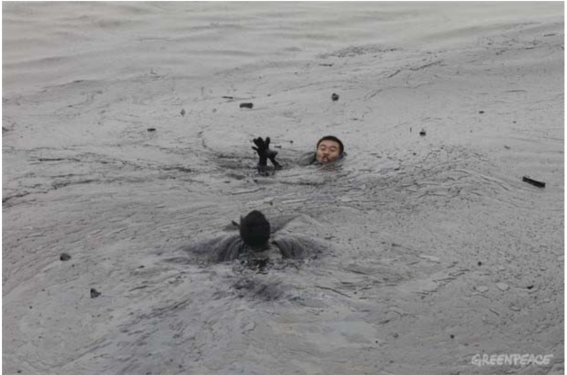
Obr. 18, Topící se hasič v ropné skvrně, 20.7.2010