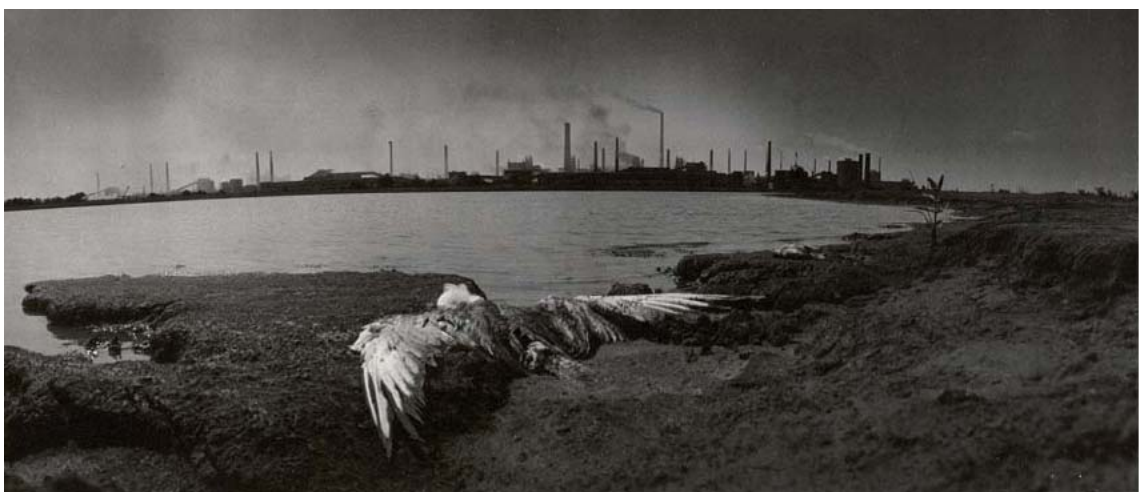
Mrtvý racek, 60. léta