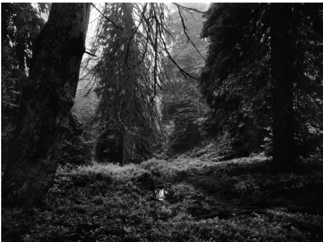
Obr. 17 Dunajske rameno, Červenec 1955

Zcela jiný úhel pohledu na fotografie z knihy Prales Mionší je poté, co byly z popudu ekologů zařazeny do výstavy Neregulováno – prales v české fotografii (Moravská galerie v Brně 16/10/2008—11/1/2009). Výstava, která nevznikla nápadem fotografů, navazovala na výzkumy, které se zabývají sledováním dynamiky přirozených lesů. Pro výstavu byla i příznačná dvě významná pralesní výročí (Žofín roku 1838 a Boubín 1868), která připadla právě na rok 2008. Výstava nebyla určena pouze lesnickým a ekologickým odborníkům, ale doplněna o potřebné odborné ekologické souvislosti oslovila širokou neodbornou veřejnost. „Výstavou fotografií Neregulováno jsme chtěli nejen připomenout tradici ochrany českých pralesů, ale zároveň i poukázat na jiné než přírodovědecké nebo lesnické hodnoty, které pralesy i další divoká místa mají.“ 14