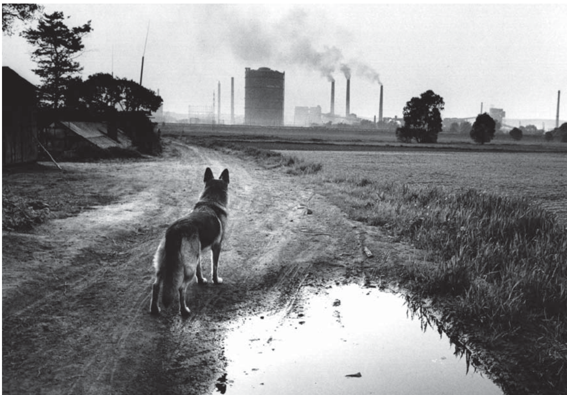
cyklus Ostrava, 1975