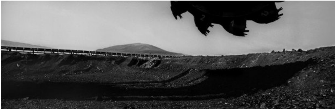
Obr. 3 /, těžba uhlí na úpatí Krušných hor, 1993.

Černý Trojúhelník - Nejvýznamnější fotografické dílo v české ekologii je Černý trojúhelník . Jeho tématem, ostatně jako tématem mnoha českých ekologických fotografických prací, je člověkem zdevastované Podkrušnohoří. Podkrušnohoří je západním cípem pověstného černého trojúhelníku, nejvíce zničeného území Evropy. Zasahuje od nás až do Saska a Polska. Zničeného extensivní těžbou hnědého uhlí a na něj navázaný průmysl, například elektrárenský, teplárenský a chemický. Koudelka se fotografování této oblasti věnuje po svém návratu z emigrace domů, to jest roku 1990. Během čtyř let zachycuje ekologickou katastrofu Podkrušnohoří. Na vzniku souboru mělo podíl nejen autorovo osobní zaujetí ale i bývalý ministr životního prostředí Josef Vavrouška. Fotografie vyšly v knižní podobě v roce 1994 v nakladatelství Vesmír ku příležitosti výstavy, pořádané v červnu až září 1994 v Salmovském paláci v Praze, který byl pro lepší vyznění fotografií zanechán ve své zchátralé podobě.