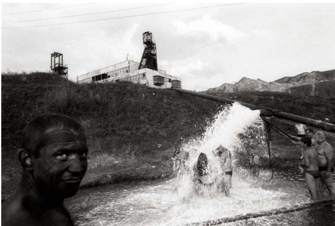
Obr. 10 Foto: Václav Vašků, Solotvino, Ukrajina, 2006

Jeho dalším oceňovaným cyklem s ekologickou tematikou je reportáž ze Solotvina, které je dnes jedním z posledních míst v Evropě, kde se těží sůl v hlubinném dole. Mezi horami odpadků u malého jezírka se zde u několika trubek, z nichž prýští roztok soli, koupají lidé, aby si zde léčili kožní onemocnění. Tomuto místu se přezdívá Solotvinské mrtvé moře.