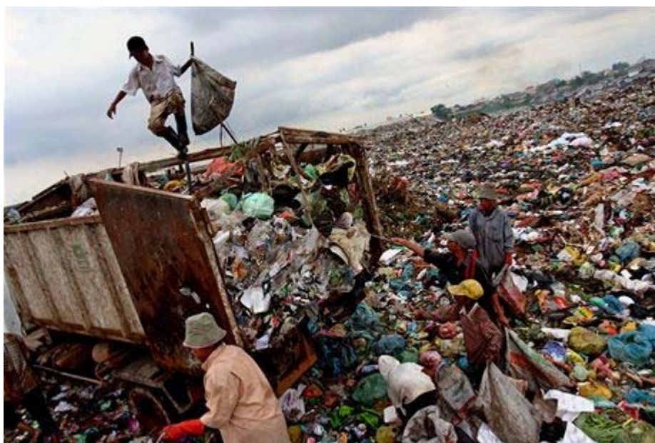
Obr. 11 Těžká práce dětí na skládce, Kambodža 2007