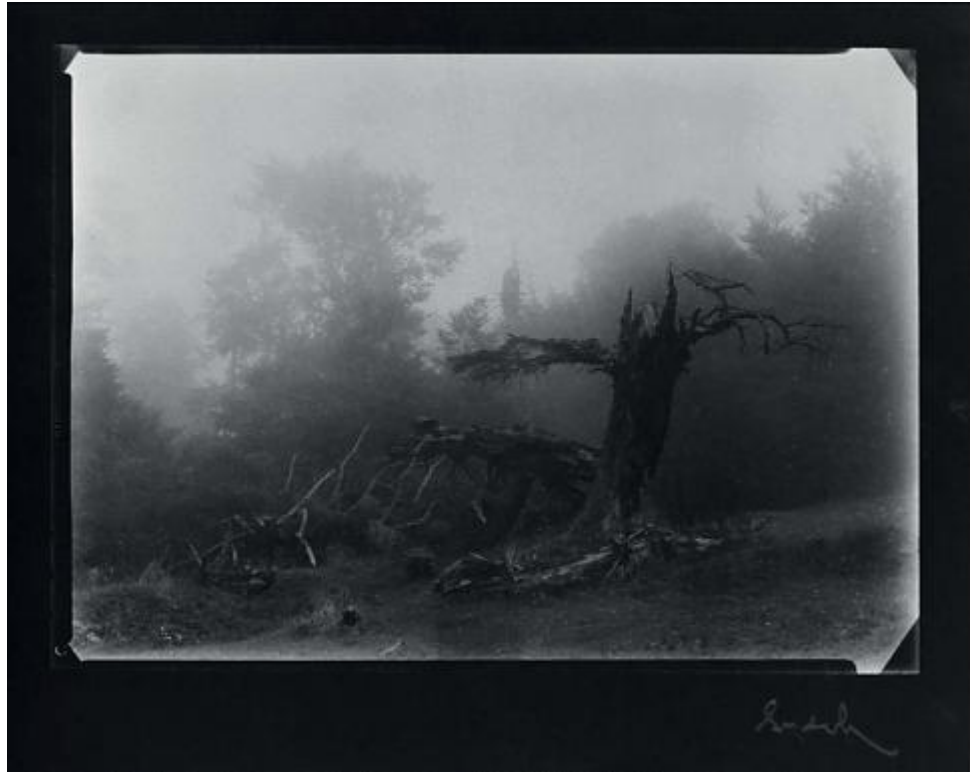
Zmizelé sochy, 1952 - 1970