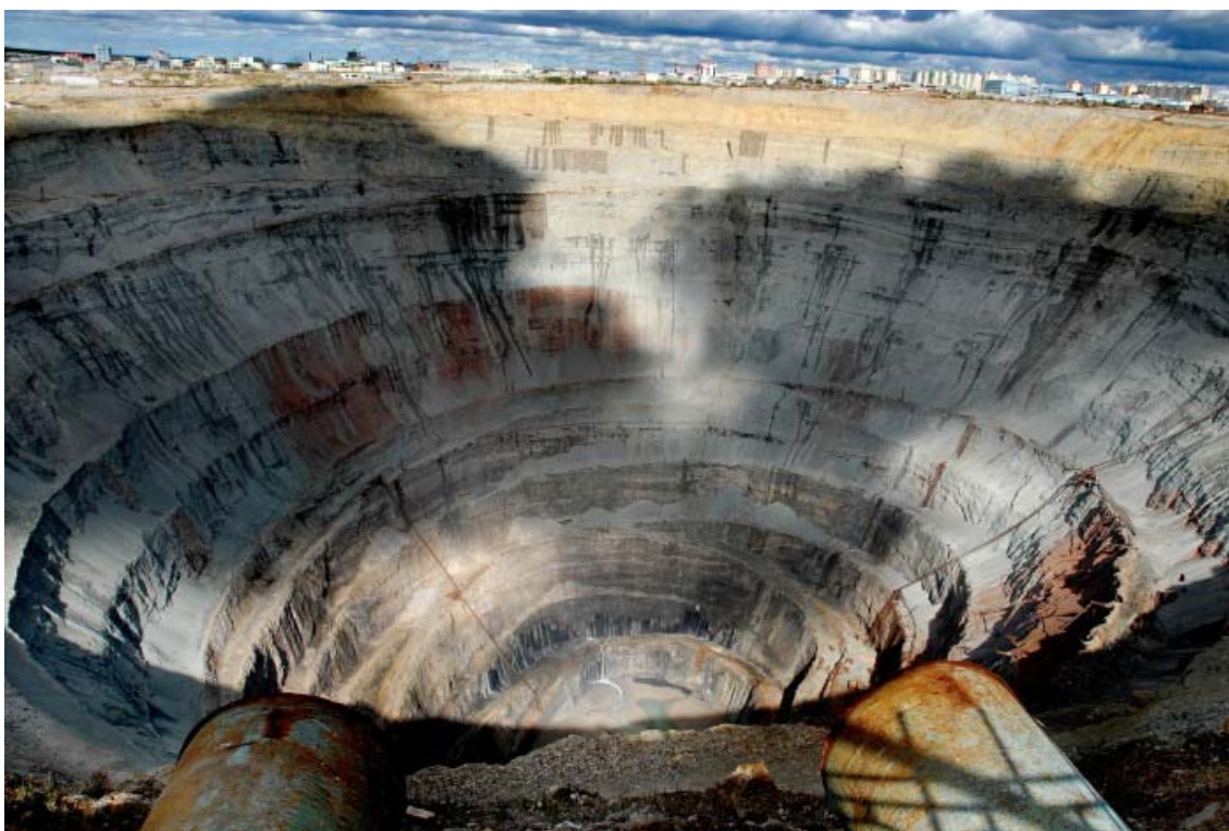
Obr. 9 Truba MIR – největší diamantový důl, Rusko, Červenec 2007

Převážně z nejzapadlejších míst bývalého Sovětského svazu pořizuje reportáže mladý dokumentarista a reportér Filip Singer (1980). Je držitelem prestižního novinářského ocenění v rámci soutěže Czech Press Photo a vystavuje v Čechách i v zahraničí. Úspěšně spolupracuje s mnohými zahraničními agenturami a časopisy (Der Spiegel, GranAngular, Photo, Central Asia Times, Spektrum Picture, REA atd.).