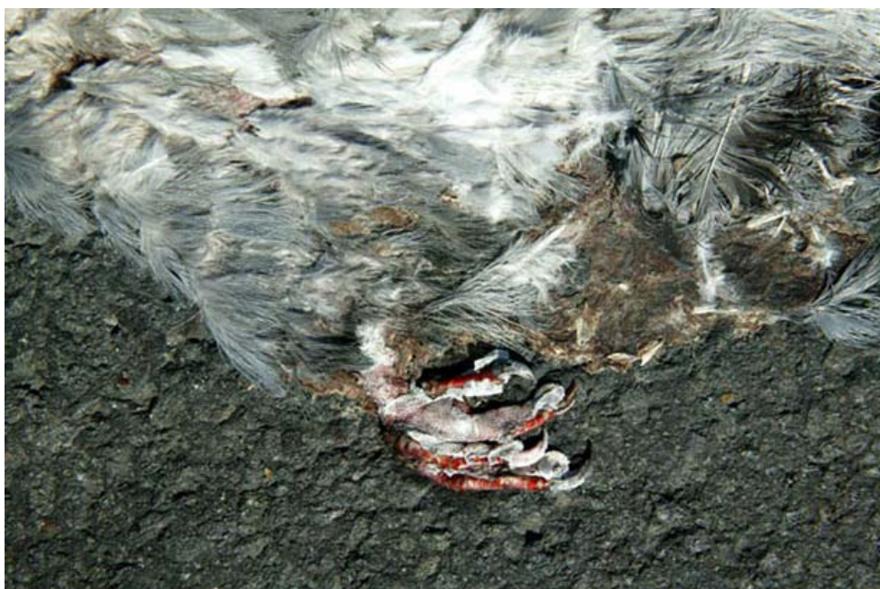
Obr. 12, Columba Domestica, cyklus What we ride on, 2004