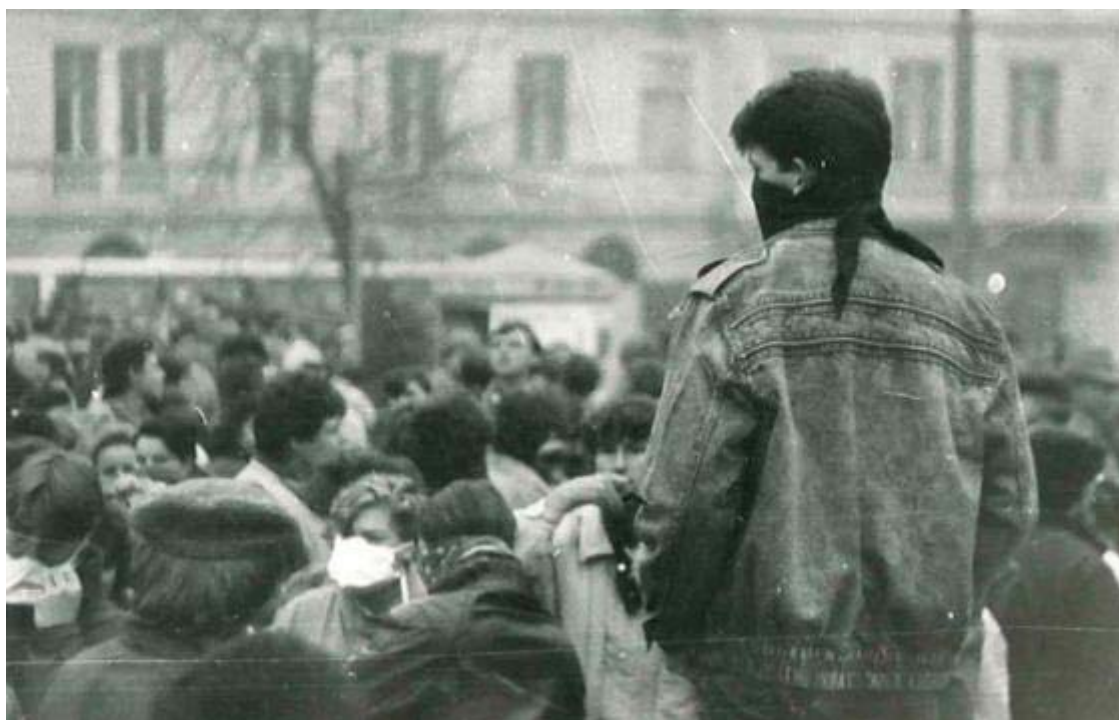
Obr. 2 / foto: Petr Stolař, ekologická demonstrace v Teplicích, listopad 1989

Posledním limitem této práce je rok 1989. Stejně, jako po tomto roce proběhlo v Čechách mnoho politických a sociálních změn, změnil se diametrálně i přístup českých lidí k ochraně přírody, krajiny a ekologii vůbec. V několika málo letech před rokem 1989 i v něm samém, začínají v Čechách působit první organizace, mající ve svých stanovách zkoumání životního prostředí a jeho ochranu (roku 1978 založením Ekologické sekce Biologické společnosti při ČSA, Brontosaurus se oddělil od ČSM, Hnutí duha, Veronica, Děti země aj.). Hrozivý stav životního prostředí byl jedním z mnoha důležitých důvodů nespokojenosti obyvatel s komunistickým režimem, který se otázkou životního prostředí a ekologií nezabýval. Začíná se také správně pojmenovávat stav životního prostředí v Čechách po období, kdy