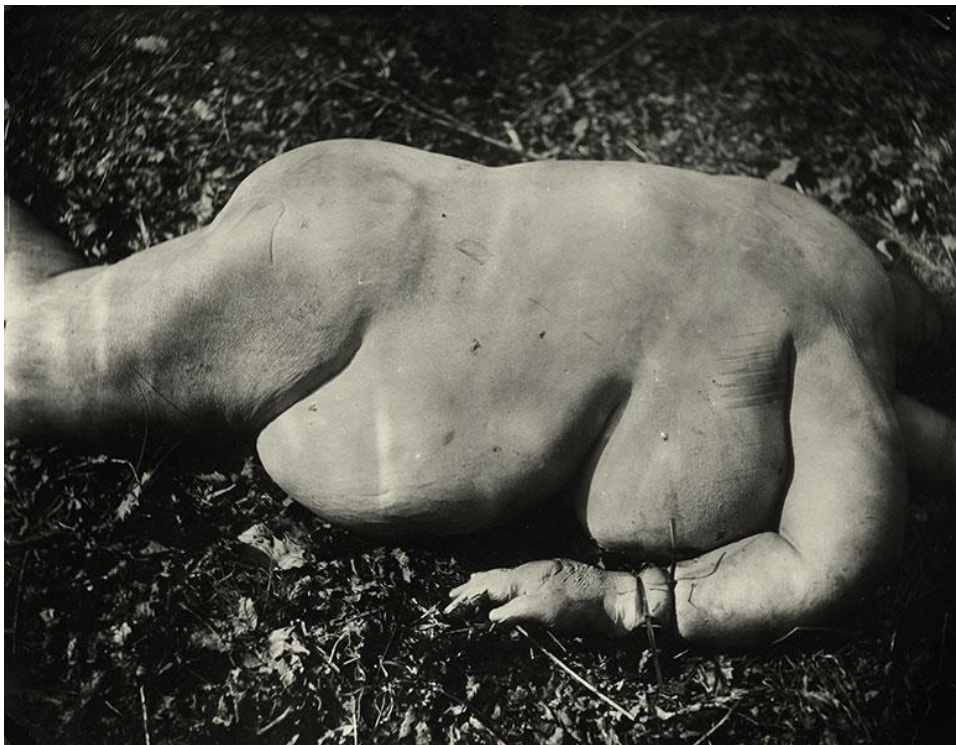
Nahoře: Les Krims, Nepojmenované, ze série The Incredible Case of the Stack O'Wheat Murders, 1972 Dole: Sally Mann, Nepojmenované, ze série Body Farm, 2000-2001