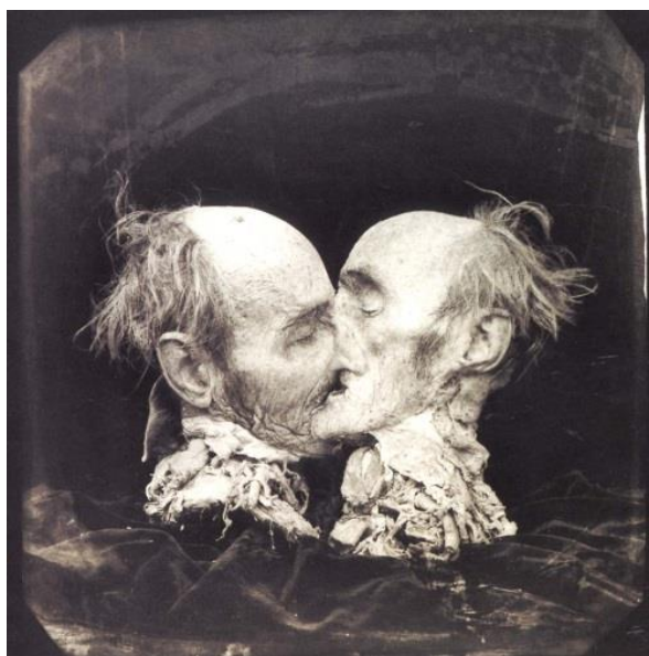
Joel Peter Witkin, Kiss , 1982

Příkladem může být fotografie Kiss z roku 1982, která zobrazuje dvě chirurgicky separované poloviny hlavy jednoho člověka naaranžované tak, aby připomínaly líbající se pár. Fotografie má chladný a děsivý anatomický charakter ale i Witkinův vizuální rukopis. Witkin většinou v ateliérových podmínkách své objekty výrazně stylizuje a mnohdy z nich instaluje více či méně komplikované scény. Součástí výrazové prvku výsledné fotografie jsou vždy estetické stopy po destruktivní práci s negativem.