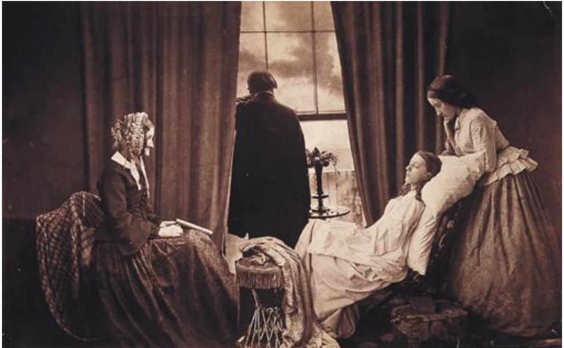
Henry Peach Robinson, Odcházení, 1858

Ačkoliv posmrtná dokumentární, reportážní a užitá fotografie prostupuje historií fotografie velmi často, umělecká posmrtná fotografie zažívá svůj rozmach až v 70. letech 20. století. V tomto období začíná být smrt legitimním, i když stále tabuizovaným a kontroverzním tématem. Poprvé v historii se umělci fotografové začínají smrti zabývat, reflektovat jí a přinášet svoje mnohdy velmi osobní výpovědi. Tento fakt je zapříčiněn hned několika faktory. Po skončení II. světové války se stává společnost citlivější ve vnímání humanitních otázek. Lidé pozorně sledují silné šokující fotografie, které z válečných konfliktů přinášejí dokumentaristé. Není tedy divu, že v šedesátých letech poznamenaných válkou ve Vietnamu vyvolávají veliké společenské debaty témata jako potraty nebo eutanázie. Smrt, truchlení po ztrátě blízké osoby a etické otázky týkající se života a smrti hýbou společností a stávají se tak i předmětem studií široké škály vědních a později i uměleckých oborů. Akademici z rozličných oblastí začali vydávat svoje expertízy zkoumající téma smrti. Příkladem může být kniha Barneyho Glasera a Anselma Strausse Awareness of Dying , která studovala vztahy mezi umírajícím pacientem, rodinou a personálem hospitalizačního zařízení a kritizovala nedostatečnou nebo nulovou informovanost těchto pacientů o faktu, že umírají.